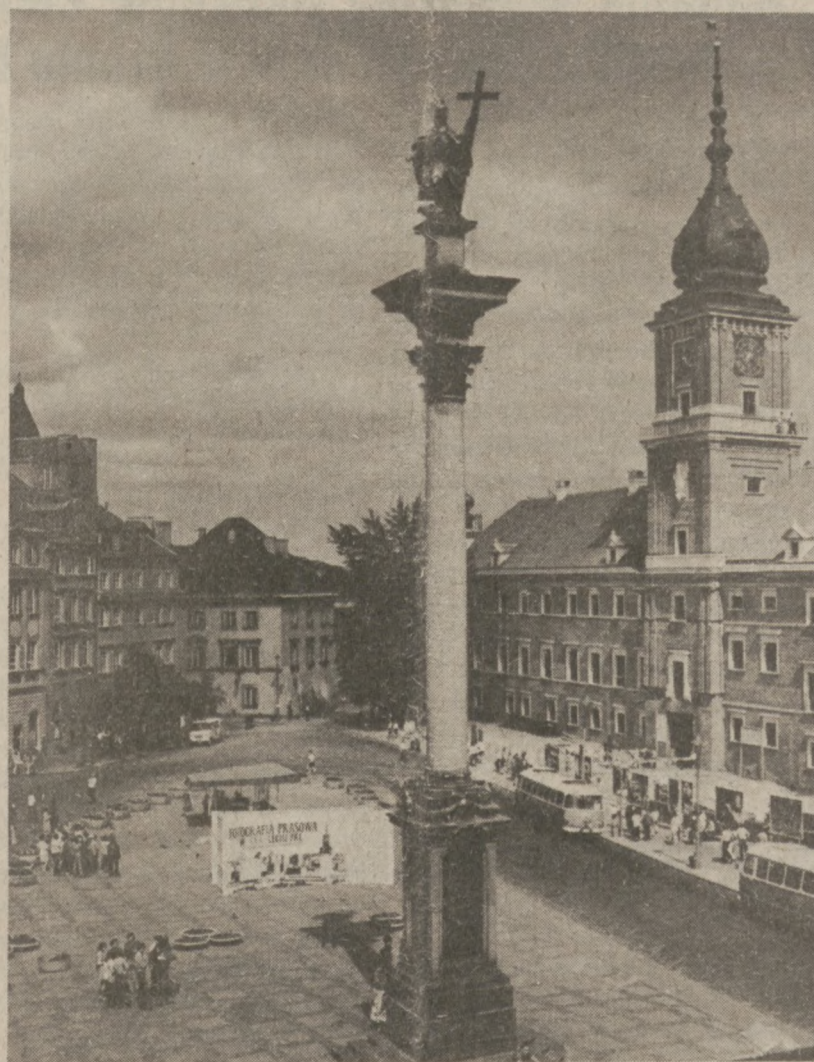
WARSZAWA. — Kolumna Zygmunta.