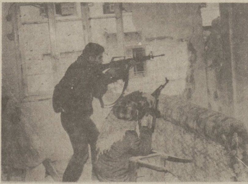
TRYPOLIS, LIBAN — W Trypolisie trwają walki pomiędzy zwolennikami i przeciwnikami Syrii. Na zdjęciu dwaj przeciwnicy Syrii ostrzeliwiają pozycje zwolenników.