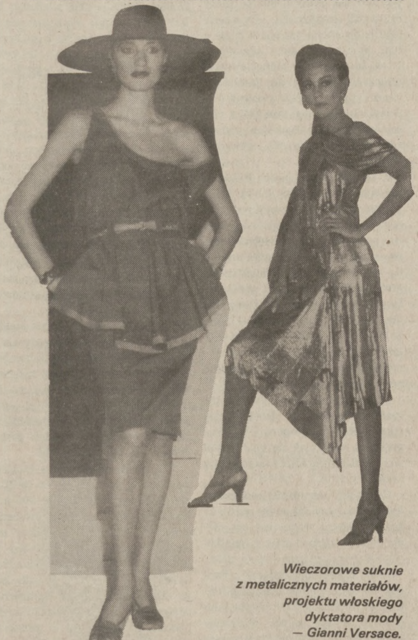
Wieczorowe suknie z metalicznych materiałów, projektu włoskiego dyktatora mody - Gianni Versace.