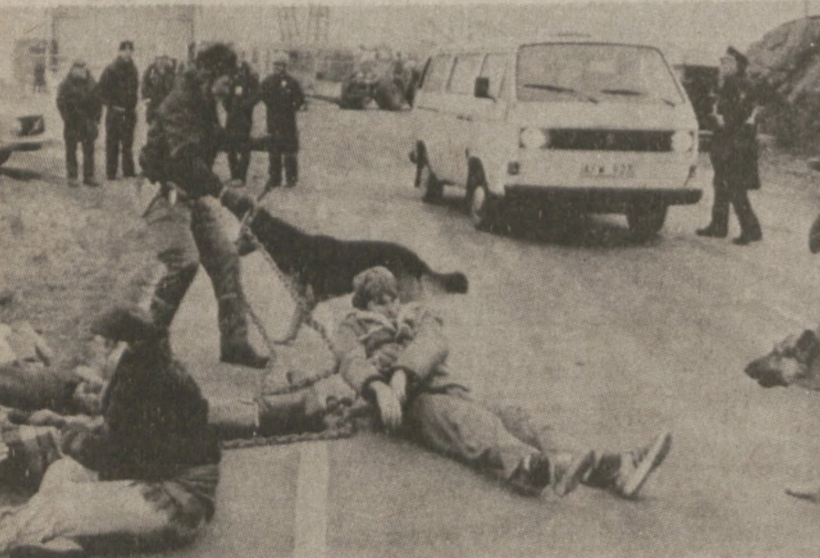
VARBERG, SZWECJA. — Mieszkańcy demonstrowali przeciw wywożeniu z silowni nuklearnej radioaktywnych odpadów produkcyjnych. Demonstranci przykuli się łańcuchami do bramy silowni. Policja zmuszona była aresztować kilka osób.