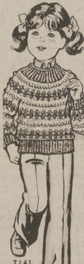
7161 by Alice Brooks

Warm her heart and dazzle her eyes with this colorful pull. For girls or boys! Crochet cozy pullover in 3-colors of worsted-type acrylic that provides extra warmth. Crochet neck down (all one piece). Pattern 7161: sizes 4-10 included. $2.50 for each pattern. Add 50¢ each pattern for postage and handling. Send to: