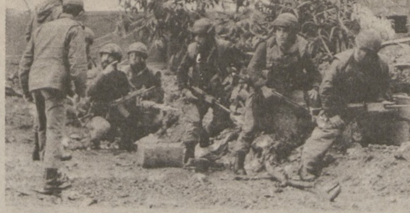
KHALDE, LIBAN. — Grupa izraelskich żołnierzy obejmuje stanowisko w pobliżu hotelu w którym prowadzone są rokowania izraelsko-libańskie, na krótko po tym, jak wybuchł pocisk z "Katuszy" raniąc dwóch żołnierzy.

Reprezentacja Anglii miała odbyć tego lata tournée po południowej Ameryce, rozgrywając mecze piłkarskie w Brazylii i Argentynie. Niepostrzeżenie Brazylija odwołała wizytę reprezentacji Anglii, uważając widocznie, że piłkarze angielscy nie są dostateczną atrakcją. Jest to przykrośc dla reprezentacji Anglii. Mąż trenera zespołu angielskiego, Robson, — przyznał, że jest b. zawiedziony. Zastąpienie meczy z Brazylią i Argentyzną meczami z Australią jest oczywiście niezadawalające.