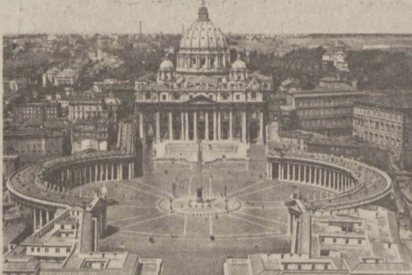
RZYM - Plac Św. Piotra

Rozmowy w Republice Federalnej (Ciąg dalszy na str. 6-ej)