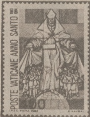
WATYKAN. — Poczta watykańska wydała serię czterech znaczków upamiętniających Rok Święty 1983—1984.