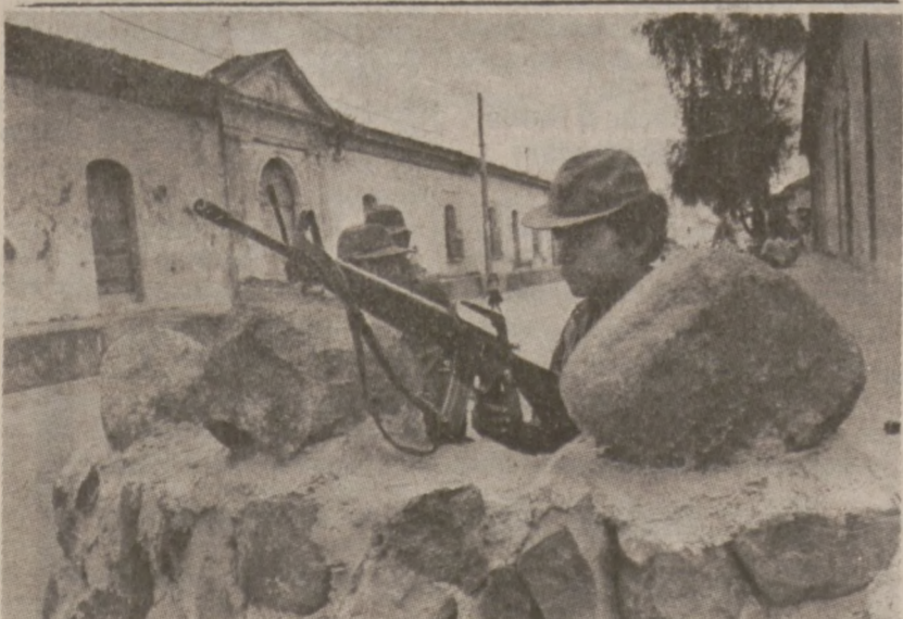
SUCHITOTO, EL SALVADOR. — Mieszkańcy miasta w obawie przed ponownym napadem rebeliantów roztawili straż. (UPI)

Ostatnia kontrola nie wykazała czy rodzice dzieci murzyńskich mają rację. Nie zdołano ustalić, czy własne dzieci murzyńskie są bardziej bite niż ich biali rówieśnicy. Podobna kontrola zostanie przeprowadzona jeszcze raz w kwietniu. Warto zaznaczyć, że wśród uczniów szkół powszechnych w Peorii 34% to uczniowie pochodzący z tzw. mniejszości.