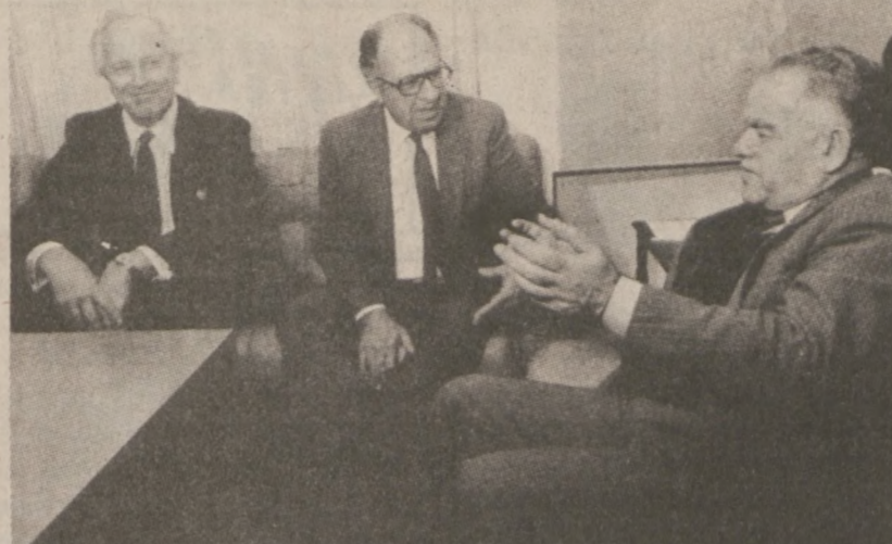
JEROZOLIMA. — Minister spraw zagranicznych Izraela Ytzak Shamir (po prawej) w rozmowie ze specjalnym wysłannikiem U.S. Philipem Habib (w środku). W rozmowie wziął udział wiceminister spraw zagranicznych Izraela Morris Draper. Zdjęcie z 15 lutego br.

Adwokat CHESTER M. PRZYBYŁO Po informację można dzwonić w każdej porze na Nr. 631-7100 MÓWIMY PO POLSKU