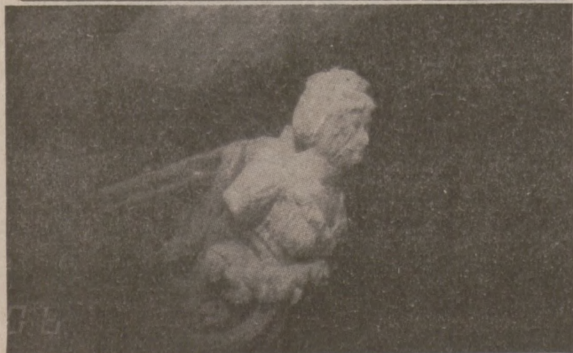
WASHINGTON. — Na dnie jeziora Ontario znajdują się dwa okręty wojenne U.S. zatopione w wojnie 1812 r. Niedawno znaleziono szczątki tych okrętów, podobno zachowane w doskonałym stanie. Na zdjęciu galeon okrętu "Hamilton".