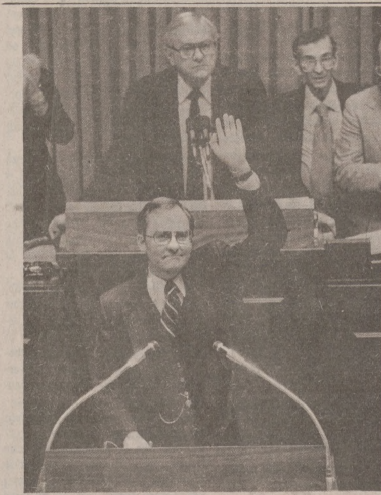
SPRINGFIELD. — Gubernator stanu Illinois—James Thompson.

W walkach zginęło 7 osób, zniszczonych zostało około 200 domów. W sumie od czasu rozpoczęcia walk etnicznych w tej okolicy 1 lutego br., zginęło 3,654 osoby.