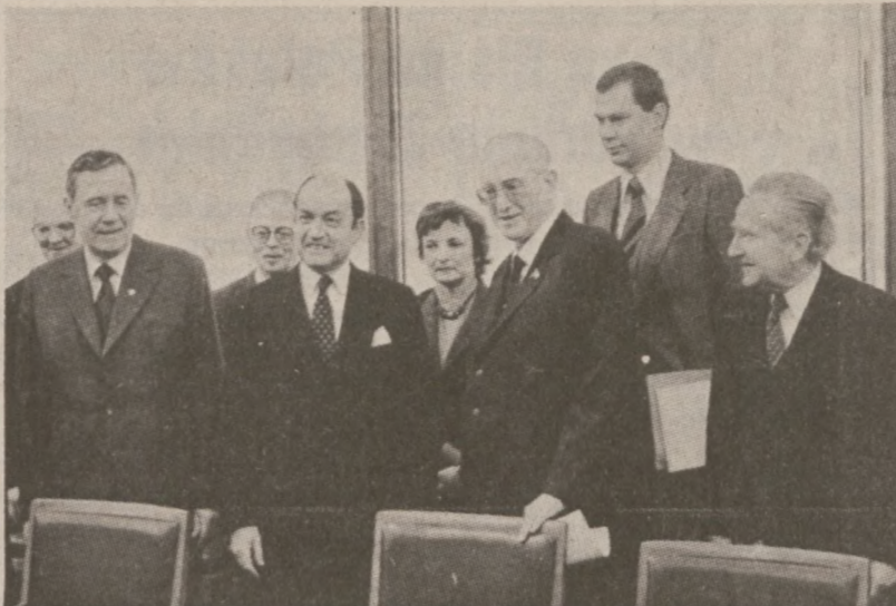
MOSKWA. — Spotkanie Sekretarza Generalnego Sowietów Jurij Andropowa (po prawej, w okularach) z ministrem spraw zagranicznych Francji Claude Cheysson (drugi od lewej). Po lewej stoi sowiecki minister spraw zagranicznych Andrej Gromyko.