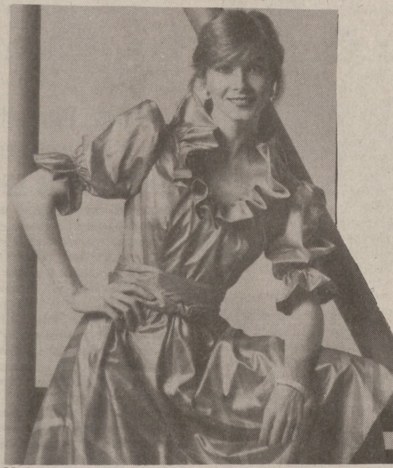
Modne na każdą porę dnia falbany, zazwyczaj zdobione wycięciem dekoltu i zakończeniami rękawów.