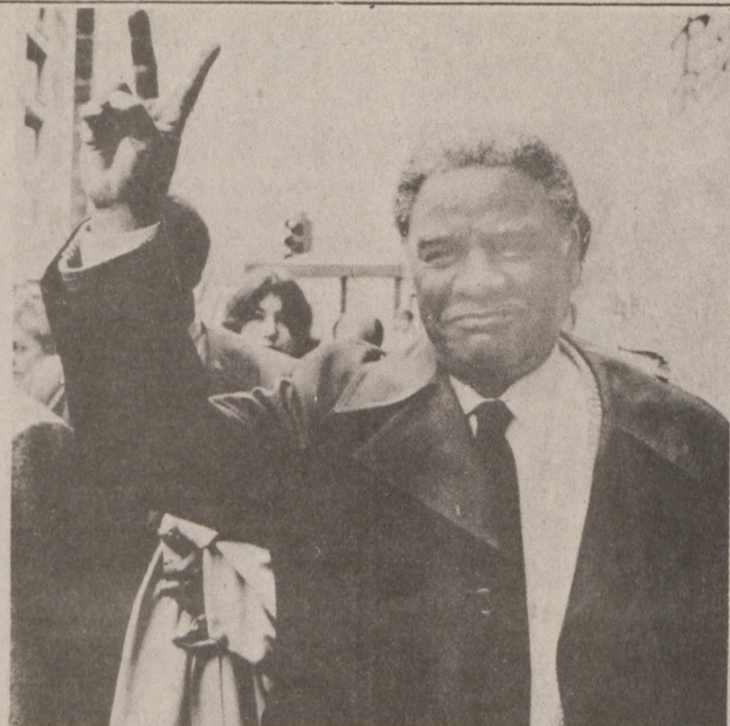
CHICAGO. - Kongr. Harold Washington, po złożeniu głosu we wtorkowych prawyborach. Wygrał on prawybor i jest kandydatem demokratów na stanowisko mayor a miasta.

W przyszłą niedzielę Błyskawica gra z litewską drużyną Liths o godz. 20.15. Informujemy również, że zespół bilardowy Błyskawicy bierze udział w polonijnych rozgrywkach bilardowych i w ostatnią sobotę pokonał zespół Wisły 9:6.