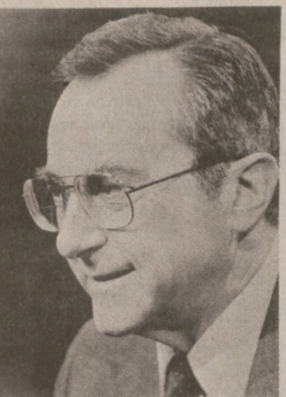
JEROZOLIMA. — Moshe Arens, ambasador Izraela w U.S. obejmuje stanowisko ministra obrony Izraela, po Arielu Sharonie. (UPI)

Our Magazine Cover Printed Pattern 4807 SIZES 8-18