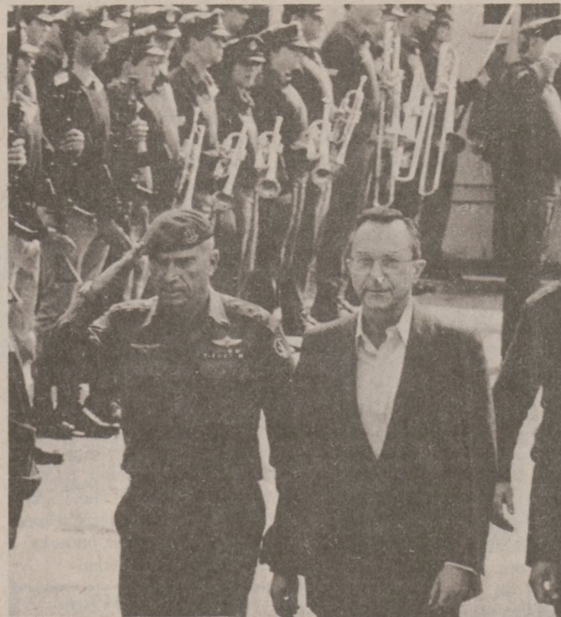
TEL AVIV. — Nowy minister obrony Izraela Moshe Arens, przed frontem kompanii honorowej w towarzysztwie szefa sztabu gen. Raphael Eitan. Arens, były ambasador Izraela w Washingtonie, został mianowany ministrem obrony po ustąpieniu Ariela Sharon.

Ażeby zrozumieć obrazowo, jak mały jest ten otwór, można to porównać na następującym przykładzie. Jeśli w guziku wielkości jednego cala wywierci się ten najmniejszy otwór, a następnie będzie się chciało powiększyć otwór do 1 cala, wtedy guzik osiągnie wielkości około 200 mil średnicy, czyli odległość od Chicago do Springfield.