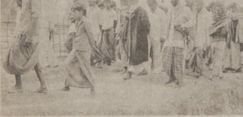
GAUHATI, INDIE. — Eksodus pozostałych przy życiu ofiar masakry w indyjskiej wiosce Rangaloo, położonej w prowincji Assam.