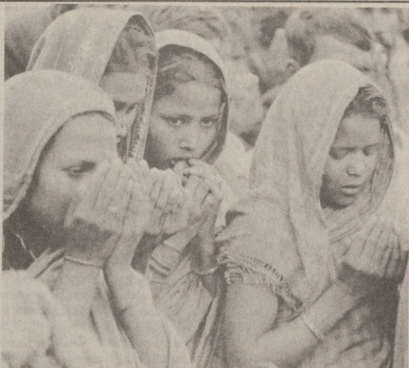
GAUHATI, INDIE. — Pozostali przy życiu mieszkańcy wioski Rangaloo podczas modlitwy za pomordowanych w czasie niedawnej masakry.

Wierzymy w zwycięstwo. Inaczej byśmy nie działali.