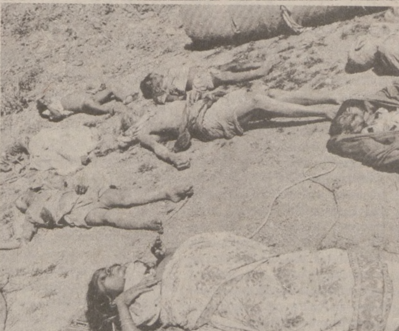
NELLIE, INDIE. — Podczas masakry w indyjskiej wiosce oprawcy nie szczędzili żadnego członka rodziny. Na zdjęciu zwłoki pomordowanych.

Od 1927 roku liga piłkarska w Polsce — zwana często ekstraklasą — przechodziła różne koleje losu. Dość istotna zmiana nastąpiła w roku 1962, kiedy postanowiono przejść na system rozgrywek "jesień-wiosna". System ten był już wtedy szeroko stosowany w całej Europie.