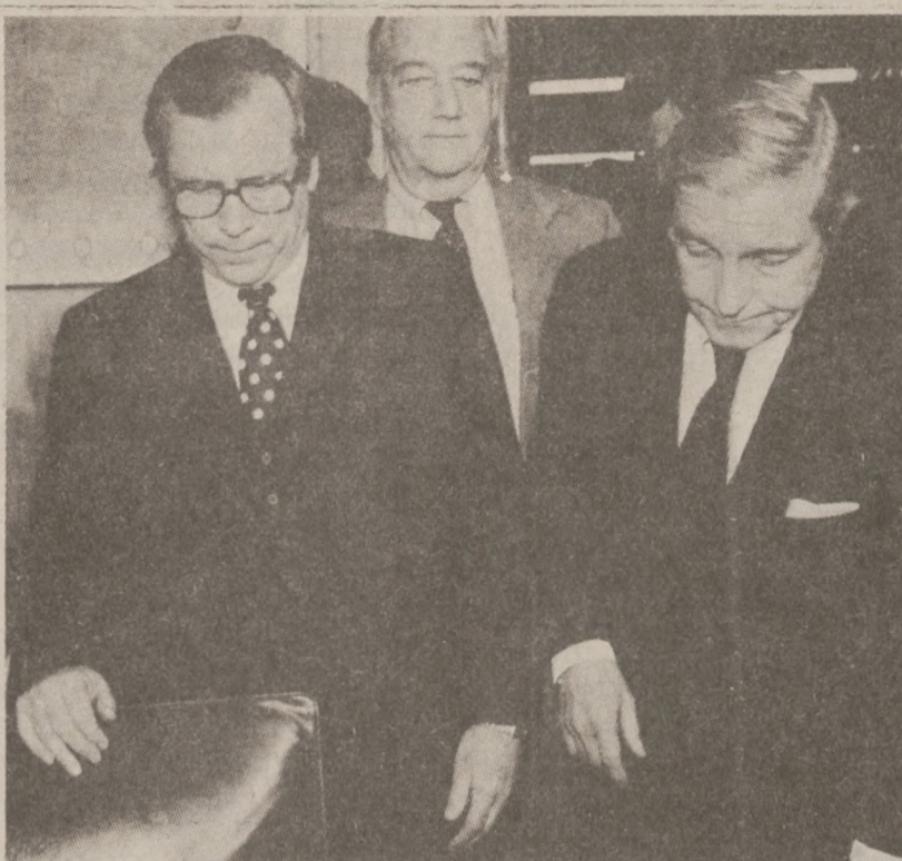
WASHINGTON. — Stojący na czele senackiego Komitetu Stosunków Międzynarodowych Charles Percy (R-Ill.) oraz senator Howard Baker (R-Tenn.), rozczarowani nie udzieleniem przez Komitet rekomendacji dla Kennetha Adelmanna na stanowisko przewodniczącego Amerykańskiej Komisji Kontroli Zbrojeń i Rozbrojenia.

Podania starających się o pożyczki prześle bank do miejskiego departamentu mieszkaniowego, który je rozpatrzy i jeśli zatwierdzi, bank przyzna pożyczkę. Pożyczki będą udzielane na ponad 25 lat. Każdy starający się o nie, musi posiadać stałe miejsce pracy i być w stanie dokonać 10% wpłaty oraz zapłacić koszty adwokackie. Jeśli nabywca domu będzie się starał o pożyczkę na remont domu, będzie musiał składać oddzielne podanie.