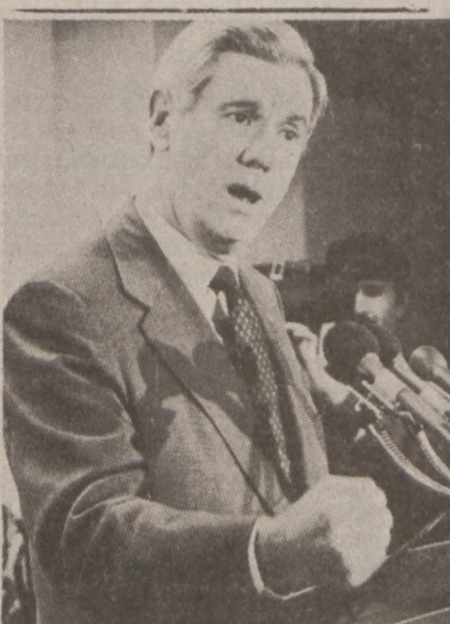
WASHINGTON — Były gubernator Florydy, Reubin Askew, oficjalnie ogłasza chęć ubiegania się o fotel prezydencki z ramienia partii demokratycznej podczas wyborów w 1984 roku.

Tymczasem zajmująca centralną pozycję partia socjalistyczna we Włoszech zaczyna prowadzić rozgrywkę o głosy z chrześcijańskimi demokratami i komunistami. W swoim przemówieniu zjazdowym Berlinguer wezwał socjalistów do zapomnienia sporów i połączenia się z komunistami dla stworzenia "demokratycznej alternatywy" dla zdominowanego przez chrześcijańskich demokratów rządu.