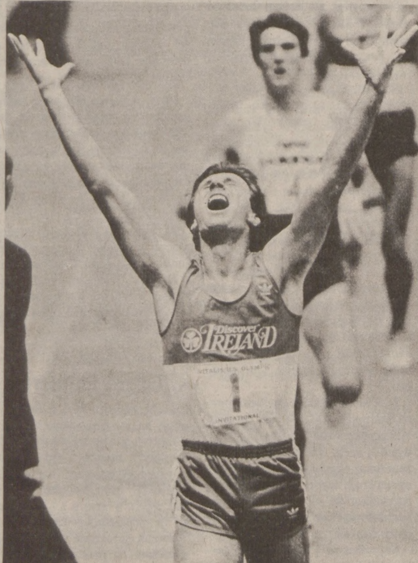
EAST RUTHERFORD, NEW YORK. — Eamonn Cogan okazuje swą radość po ustanowieniu nowego rekordu świata w biegu na jedną milę w hali krytej. Cogan przebiegł tę odległość w czasie 3:49.78.