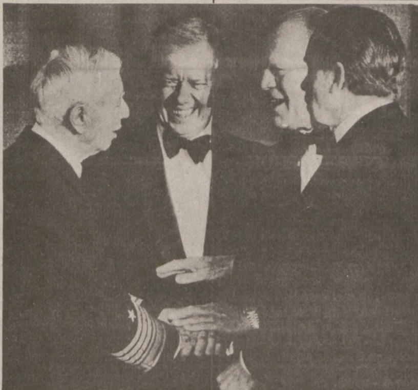
WASHINGTON. — Na uroczystym bankiecie, bilety na który kosztowały po $1000 wydanym na cześć admirała H.G. Rickover (po lewej) spotkali się trzej byli prezydenci Stanów Zjednoczonych: Jimmy Carter, Gerald Ford i Richard Nixon.

Podczas konferencji poruszano problemy parapsychologii; odbyło się kilka wykładów na temat właściwego stosowania talizmanów oraz astrologii i zagadnień okultyzmu.