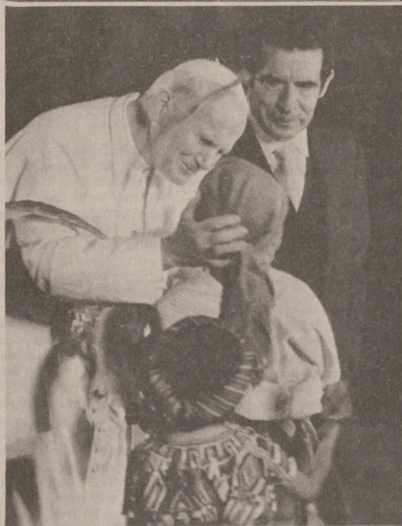
GWATEMALA. — Ojciec Święty wita polskie dzieci, mieszkające w Gwatemali. Grupa polskich dzieci powitała Papieża na lotnisku gwatemalskim 6 marca br.

"Kładę na szalę całe moje życie: polityczne by nie zezwolono na eksport lub wspólną produkcję broni, która może zabijać i ranić ludzi" — powiedział Sadanori Yamanaka.