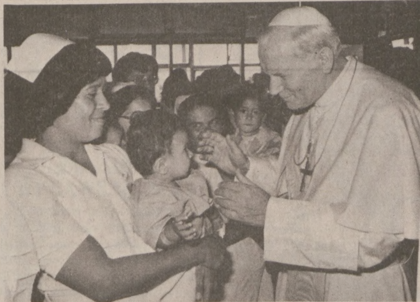
SAN JOSE, KOSTARYKA. — Ojciec Święty odwiedził szpital dziecięcy.