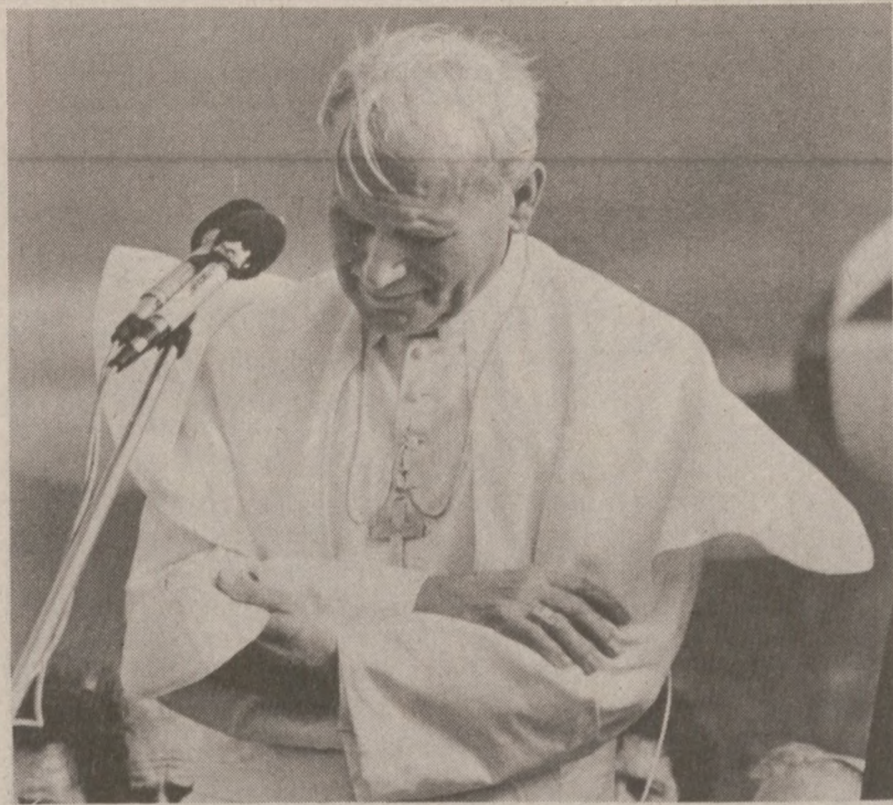
SAN JOSE, KOSTARYKA. — Zmęczony 14-godzinną podróżą z Rzymu Ojciec Święty w czasie uroczystości powitalnych na lotnisku, 2 marca 1983 r.

"Dziennik Związkowy" kosztuje mniej niż szklanka piwa!