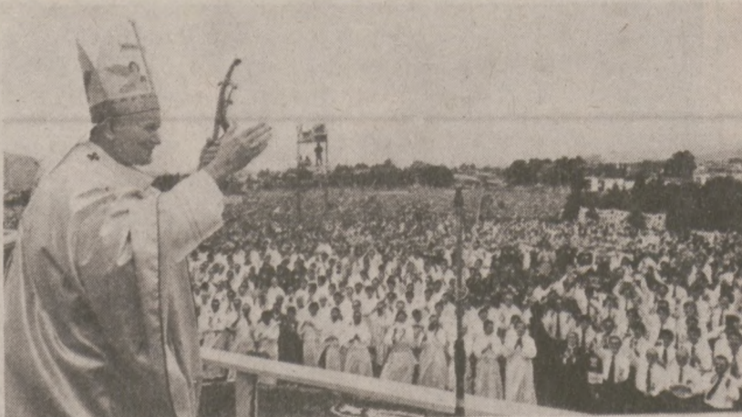
SAN JOSE, KOSTARYKA. — Papież Jan Paweł II błogosławił zgromadzone tłumy w parku Savana, w centrum stolicy Kostaryki, w czasie swej podróży do krajów Ameryki Centralnej, 3 marca 1983 r.

Od jakiegoś czasu, coraz częściej pojawiają się głosy krytyczne, stwierdzające, iż miasto powinno zatrudniać firmy lokalne, a nie spoza miasta, czy nawet stanu, jak się to dzieje w wypadku Festivals Inc., której siedziba znajduje się w Milwaukee, Wisconsin. Firma ta urządzała festiwale miejskie takie jak: Chicago Fest, Taste of Chicago, Loop Alive i szereg innych od 1978 r.