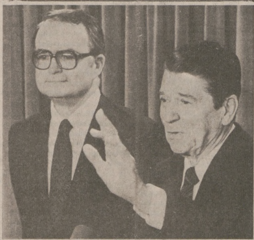
WASHINGTON. — 21 marca Prezydent Reagan wysunął kandydaturę Williama Ruckelshaus na stanowisko dyrektora Agencji Ochrony Naturalnego Środowiska. (UPI)

Uczestnicy konferencji oświadczyli, że wprowadzenie tej propozycji w życie, zapewniłoby Sovietom większą ilość pocisków nuklearnych średniego zasięgu, niż posiadali oni przed rozpoczęciem w listopadzie 1981 r. rozmów genewskich. Propozycja ta, w wypadku jej urzeczywistnienia, przyczyniłaby się także do pozabawienia państw zachodnich możliwości unowocześnienia obecnego arsenału atomowego.