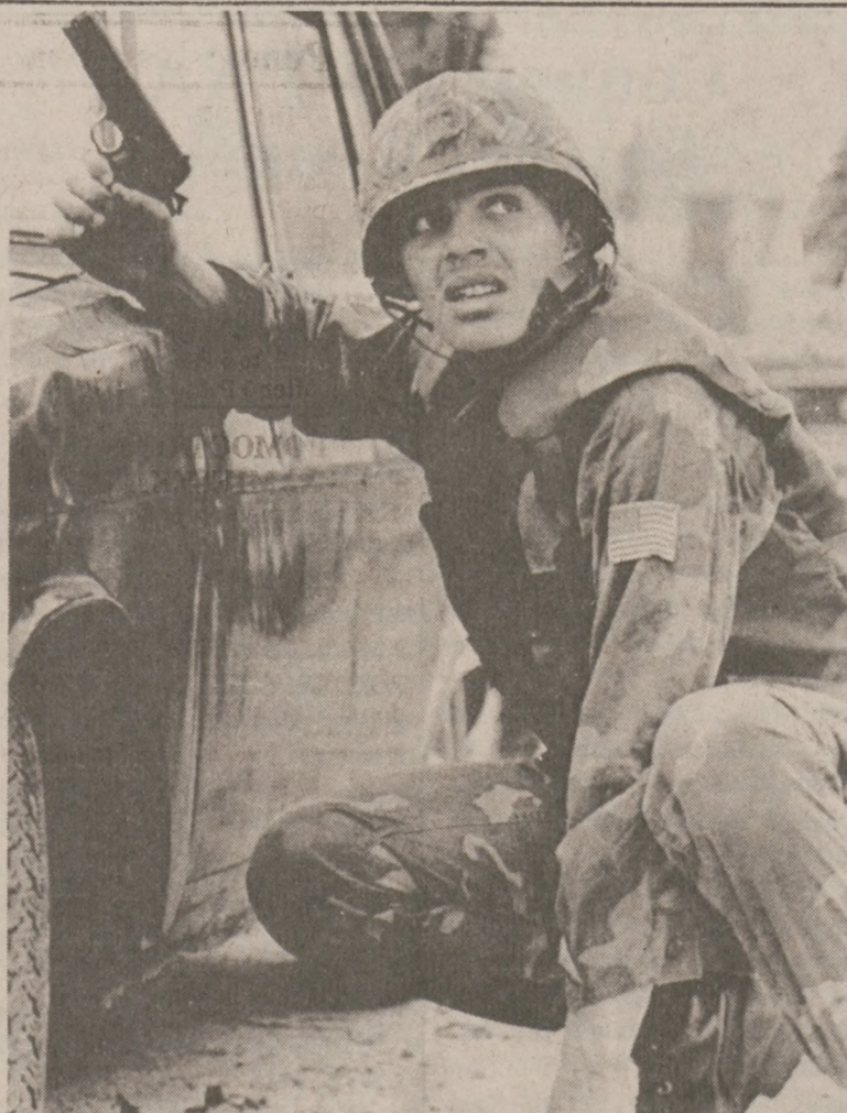
BEJRUT. — Żołnierz amerykańskiej piechoty morskiej "Marines" w pogotowiu bojowym. 16 marca patrol marines został zaatakowany i pięciu żołnierzy odniosło obrażenia. (UPI)

Szpital w Salt Lake City uzyskał już pozwolenie na przeprowadzenie siedmiu podobnych operacji.