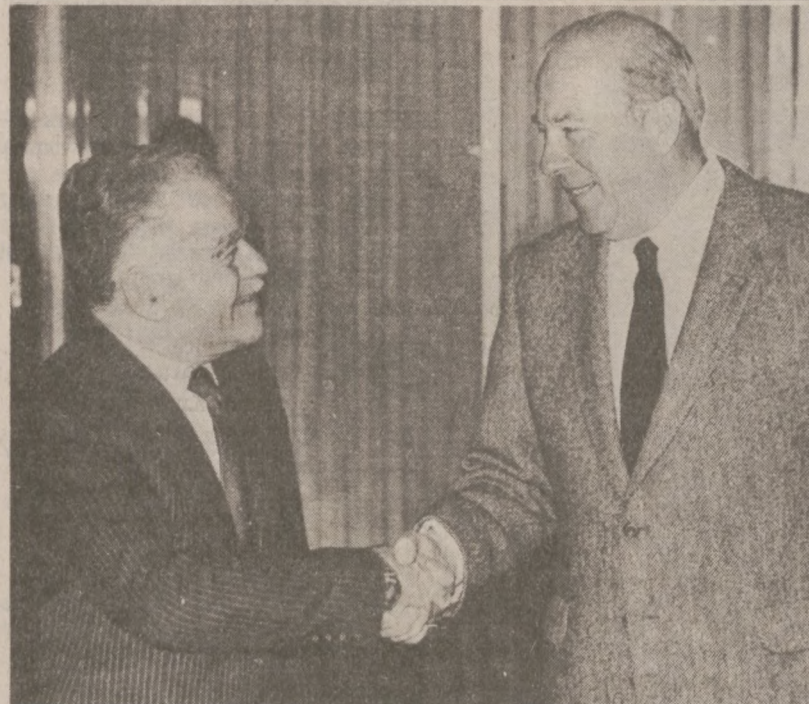
WASHINGTON. — W czasie swej wizyty w USA, minister spraw zagranicznych Izraela Yitzhak Shamir, spotkał się z sekretarzem stanu U.S. Georgem Shultz (po prawej).