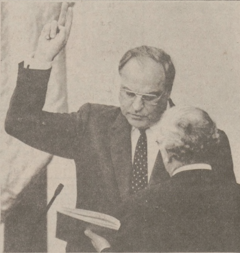
BONN. — Kanclerz Niemiec Zachodnich Helmut Kohl składa przysięgę, obejmując stanowisko. Przysięgę odbiera przewodniczący Bundestagu Rainer Barzel.