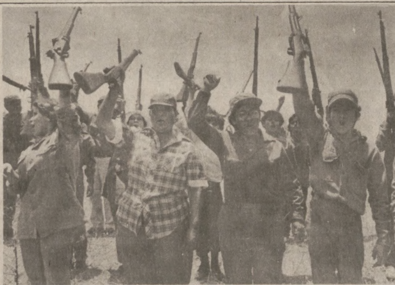
MANAGWA, NIKARAGWA. — Członkowie Ludowej Milicji Nikaragwy po zakończeniu cotygodniowych ćwiczeń.

1920 Downs Drive, West Chicago, Illinois 60185 (Minorities are encouraged to apply)