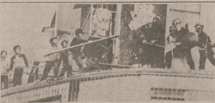
HONG KONG. — Mieszkańcy przeznaczonych do zwalnia budynku walczą z policją, która zmusiła ich do opuszczenia nielegalnie zajmowanej budowli. Budynek uznany za ruinę, został zburzony. W starciu z policją 18 osób odniosło obrażenia.

Głównym oskarżonym, tj. domem gdzie prowadzona jest skrupulatna kontrola, jest Oxford Lane Nursing Center z Naperville. Pozostałe domy, które są własnością tego samego właściciela to: Wentworth Nursing Center; Lakeland Manor, 820 W. Lawrence; Ora G. Morrow Nursing Home, 5001 S. Michigan Ave.; Leyden Community Extended Care Center, 10500 W. Grand, Franklin Park i Heather Manor Convalescence Home, 15600 S. Honore, Harvey.