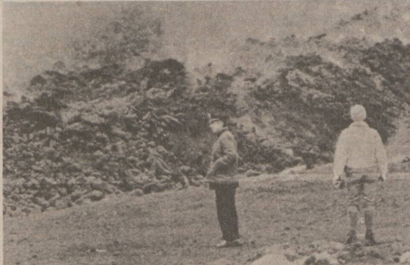
CYNTIA, SYCYLIA. — Archeolog i policjant stoją w pobliżu spływającej z wulkanu Etna lawy.

Prosimy o kontaktowanie się telefonicznie (202) 633-5028 lub listownie do: Bruce L. Einhorn, U.S. Department of Justice, Office of Special Investigations, Criminal Division, Post Office Box 28603, Washington, D.C. 20005-0603.