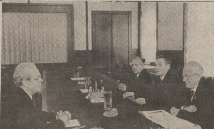
MOSKWA. — Sekretarz Generalny O.N.Z. Javier Perez de Cuellar (po lewej) w rozmowie z Jurim Andropowem i Andrejem Gromyko, 28 marca br.