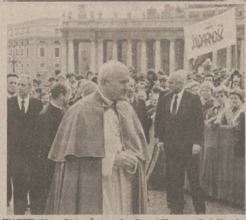
WATYKAN. — Ojciec Święty Jan Paweł II wznowił audiencje generalne na Placu Św. Piotra (po przerwie zimowej). W czasie audiencji 30 marca, witali Papieża polscy pielgrzymi z transparentem "Solidarność".

Cena złota wahała się w granicach $429 za uncję.