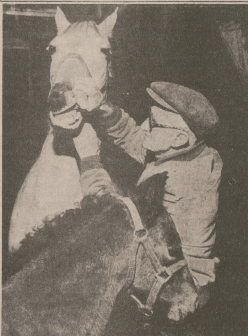
GOURNEE, ILL. — Weterynarz bada klacz rasy "Lipizzanów" Sabrinę, sprawdzając, czy nie zachorowała ona na chorobę, która zdziesiątkowała stadniny koni w Austrii. W Illinois znajduje się 350 koni tej rasy. W całym świecie jest ich 1000.