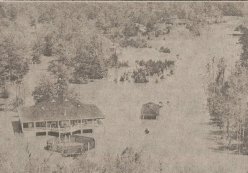
SLIDELL, LA. — Rzeka Pearl wystąpiła z brzegów zalewając okoliczne miejscowości. Trzeba było ewakuować przynajmniej 3,500 osób. Walka z powodzią nadal trwa.

Nastolatki poniżej 16 roku życia będą zatrudnieni przez 20 godzin tygodniowo, dla starszych natomiast, czas pracy będzie o 5 godzin większy. Kryterium przyjęcia do pracy sezonowej jest niski dochód rodziny aplikanta, który w przypadku 4 osób, nie może przekraczać $10,910 rocznie.