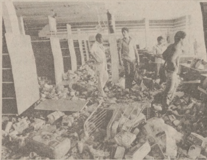
SAO PAULO, BRAZYLIA. — Pracownicy sklepu spożywczego oglądają zniszczenia, po zamieszkach jakie odbywały się na początku kwietnia.

5 spośród 54 nauczycieli zwolnionych z pracy przez władze dystryktu szkolnego w Lake Zurich, zostało ponownie wciągniętych na listę pracowników. Zgodnie z ostatnią decyzją, w ich miejsce zwolnione zostaną osoby, nie zatrudnione w szkołach na pełnych etatach.