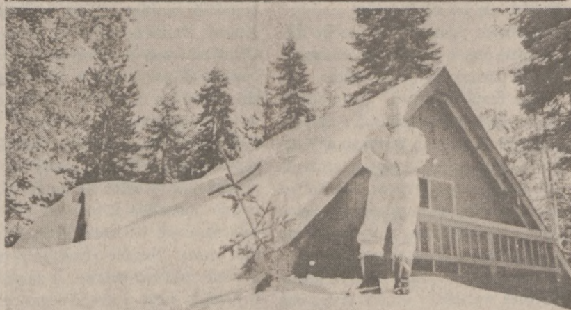
SODA SPRINGS, KALIFORNIA. — Pogoda dokucza mieszkańcom prawie całych Stanów Zjednoczonych. Mieszkaniec miasteczka w Kalifornii stoi na górze śnieżnej przed swym trzypiętrowym domem.

W poszukiwaniach za zaginionym samolotem brało udział 20 myśliwców odrzutowych, samoloty transportowe oraz śmigłowce.