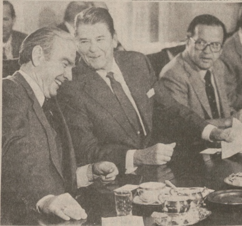
WASHINGTON. — Prezydent Ronald Reagan w rozmowie z ustawodawcami, od lewej repr. Jamesem Wright (D. Texas) i sen. Tedem Stevens (R. z Alaski).