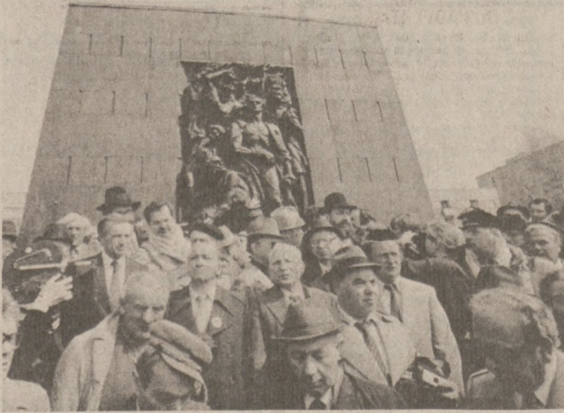
WARSZAWA. — Zdjęcie z uroczystości złożenia wieńców pod pomnikiem Bohaterów Getta, jaka odbyła się tu 19 kwietnia br. w 40 rocznicę wybuchu powstania.

OBSZERNE informacje przeczytasz i najlepsze zdjęcia zobaczysz w Dzienniku Związkowym.