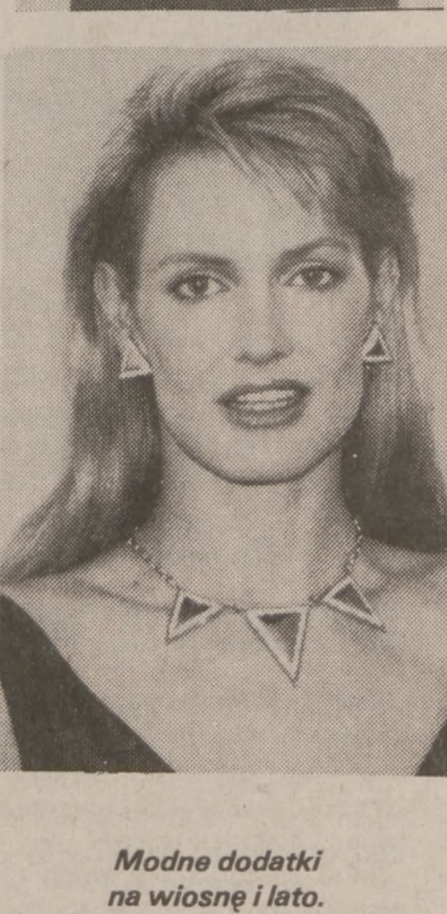
Modne dodatki na wiosnę i lato.