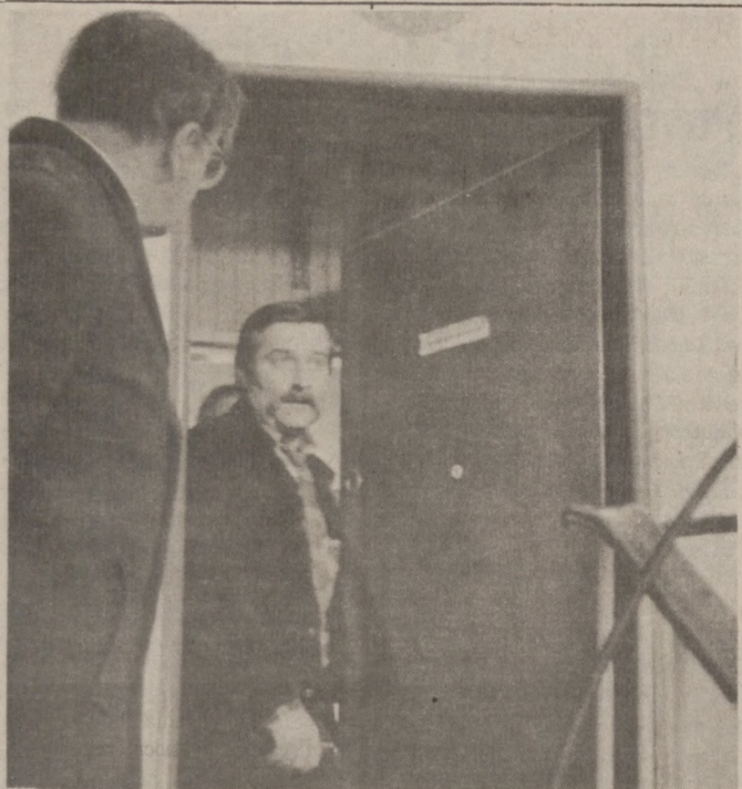
GDAŃSK. — Lech Wałęsa wychodzi z mieszkania w drodze do komendy milicji na przesłuchania. Zdjęcie z 19 kwietnia bież. roku.