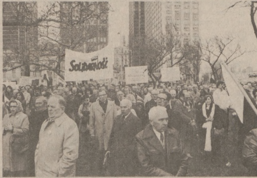
CHICAGO — Uczestnicy demonstracji solidarności z narodem polskim, zorganizowanej przez Wydział Stanowy Kongresu Polonii Amerykańskiej, która odbyła się 1-go maja przed konsulem PRL.

Korespondenci zachodni donoszą, iż na dzień dzisiejszy "Solidarność" nie ogłosiła wezwania do demonstracji — opublikowano jedynie ulotki nawołujące do noszenia w dniu dzisiejszym kokard w kolorach narodowych.