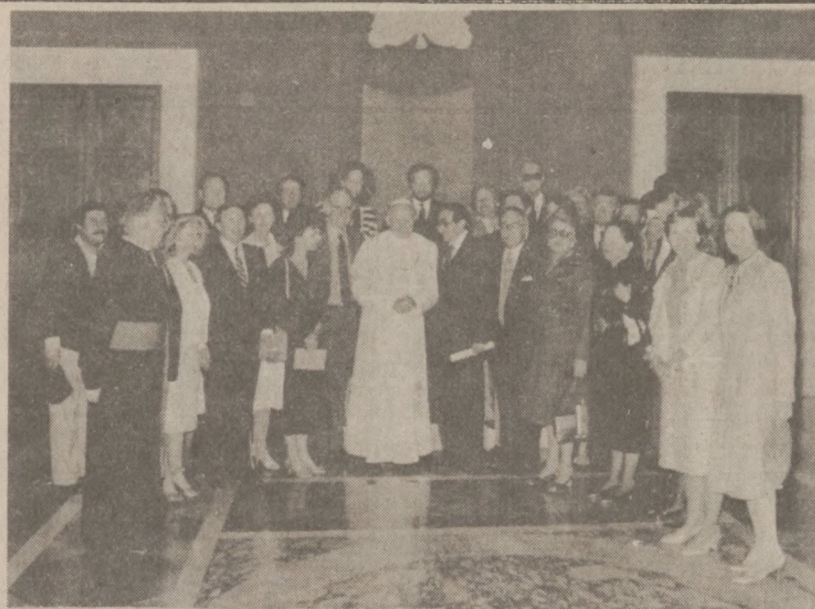
WATYKAN — Ojciec Święty Jan Paweł II, o.4.25 spotkał się z przedstawicielami Simon Wiesenthal Center, organizacji zrzeszającej Żydów ze Stanów Zjednoczonych, Kanady i Meksyku.

Coraz częściej młodzi mieszkańcy miasta posiadają rodziców, reprezentujących dwie różne grupy etniczne. Osób o mieszanym pochodzeniu jest obecnie w Chicago prawie pół miliona, przy czym u blisko 100,000 przynajmniej jedno z rodziców było Polakiem.