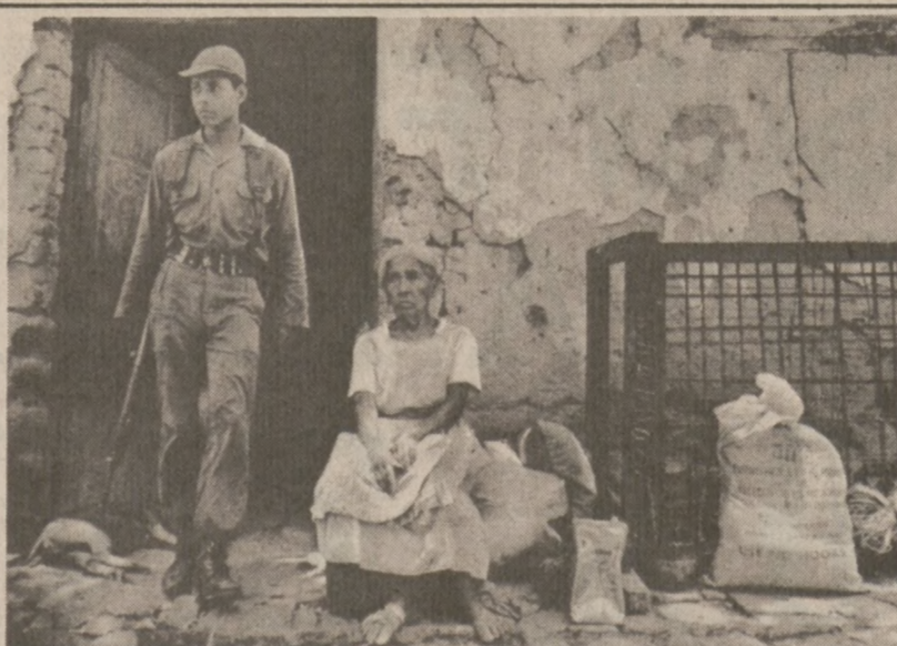
CINQUERA, SALWADOR — Nieliczni pozostali przy życiu mieszkańcy miejscowości Cinquera, po ataku lewicowych partyzantów, przeprowadzonym 8 maja, otoczeni zostali opieką regularnych oddziałów wojskowych.