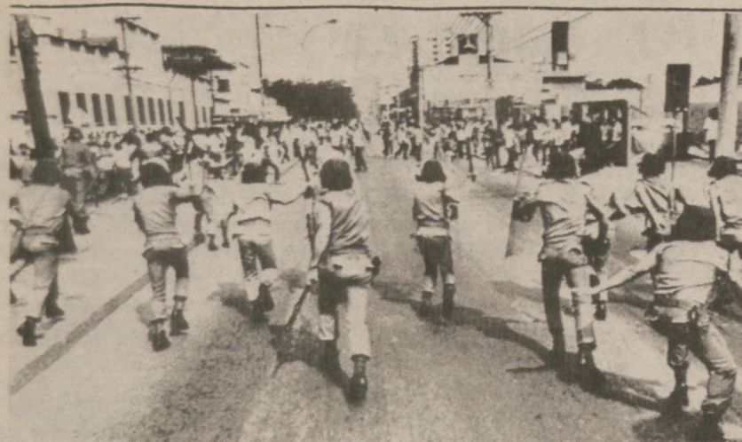
SAO PAULO, BRAZYLIA — 10 maja policja urządziła rajd na bezrobotnych demonstrantów.