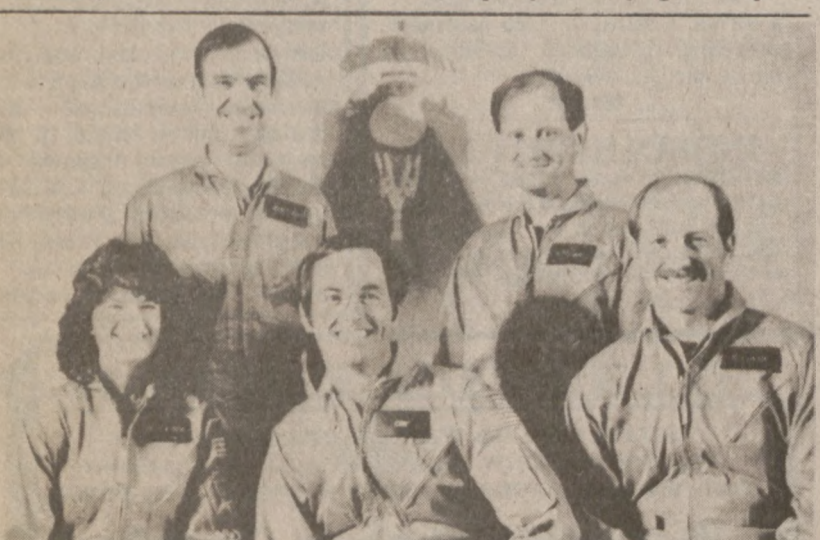
WASHINGTON — Załoga kolejnego lotu wahadłowca kosmicznego "Challenger", który zaplanowany jest na 18 czerwca. Od lewej stoją: John Fabian, Norman Thagard; siedzą: Sally Ride, pierwsza amerykańska astronautka; Robert Crippen i Frederick Hauck.