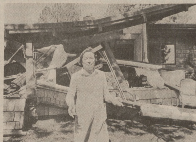
ENO, NEV. — Mieszkanca okolic Washoe Valley, która stoi przed ruinami swojego domu, zniszczonego 30 maja przez ścianę wody i mułu, stwierdza, że zamierza wyprawać się gdzieś daleko, gdzie nie ma w pobliżu żadnych gór.

KUPUJCIE W SKŁADACH KTÓRE OGŁASZAJĄ SIĘ W DZIENNIKU ZWIĄZKOWYM