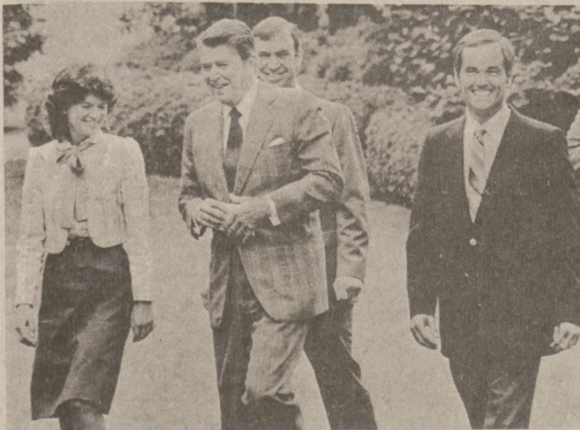
WASHINGTON — Prezydent Reagan w towarzystwie 3 członków 5-osobowej załogi kolejnego lotu wahadłowca kosmicznego Challenger.