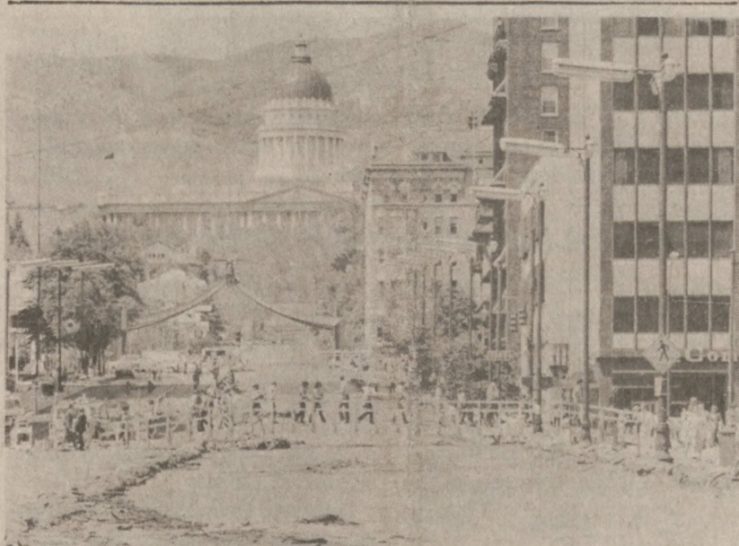
SALT LAKE CITY, UTAH — Mieszkańcy stolicy stanu Utah korzystają z prowizorycznego mostu nad jezdnią, po powodziach, jakie zalały ostatnio centrum ich miasta.

W Londynie wartość funta wynosiła 1.5720 dol.