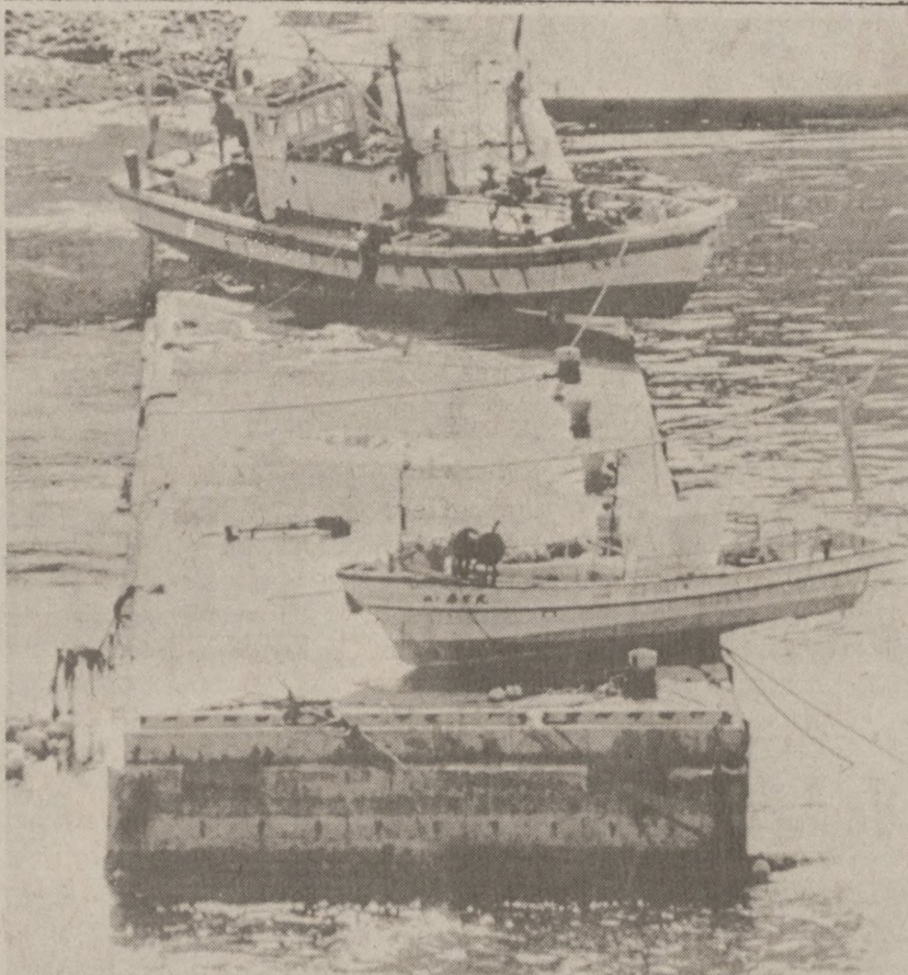
JAPONIA — Japońskie statki rybackie, które zostały zniszczone w głąb oceanu przez ogromną falę, jaka powstała w wyniku trzęsienia ziemi, 26 maja.

CHESTER M. PRZYBYŁO Po informacji można dzwonić w każdej porze na Nr. 631-7100 MÓWIMY PO POLSKU