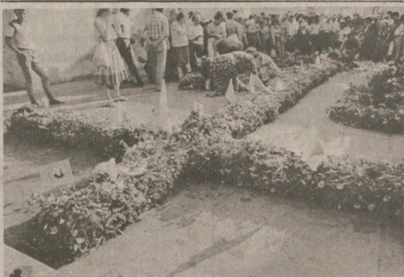
WARSZAWA — Przed kościołem Św. Anny, w pobliżu warszawskiej Starówki, mieszkańcy stolicy ułożyli na powitanie Papieża, Jana Pawła II ogromny krzyż z kwiatów. (UPI)

Obecnie do Warszawy zjechała ponownie duża grupa dziennikarzy zachodnich licząca ok. 1,000 osób. W czasie poprzedniej wizyty w Polsce akredytowanych było 3,000 dziennikarzy ze wszystkich stron świata. Akredytacja dziennikarska kosztowała w 1979 roku $10. Obecnie za to samo władze PRL liczą sobie $20.