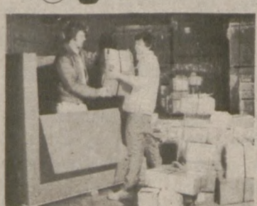
Paczki lotnicze są fachowo i ostrożnie załadunkowane do specjalnego kontenera.