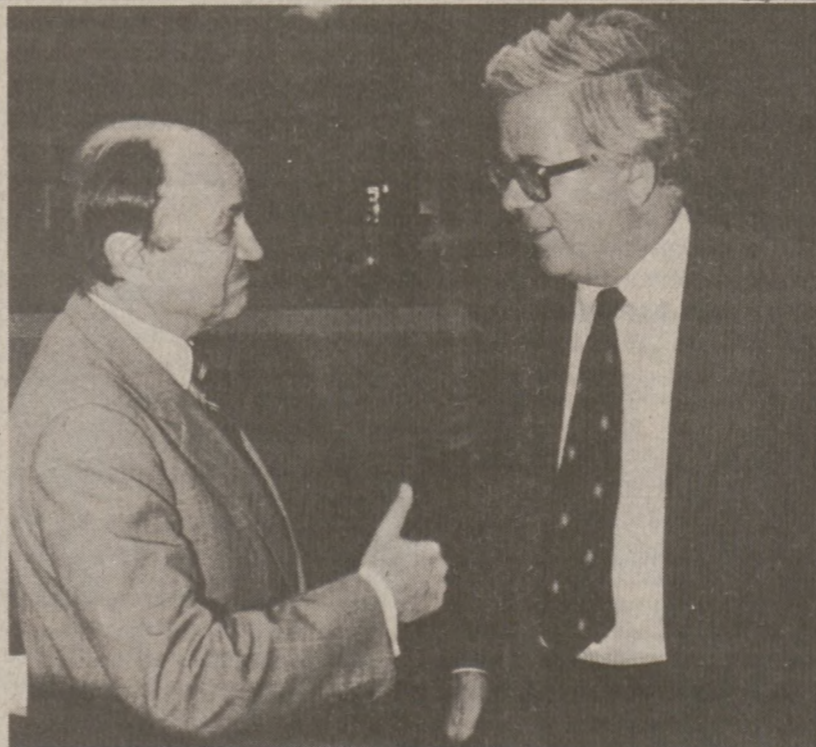
LUKSEMBURG — Minister spraw zagranicznych Francji, Claude Cheysson (z lewej) oraz nowy sekretarz spraw zagranicznych Wielkiej Brytanii, Sir Geoffrey Howe, przed konferencją ministrów spraw zagranicznych EWG, która rozpoczęła się w Luksemburgu 13 czerwca.

POZIOMO: Przedszkolanka. Rower. Odpoczynek. Efekt. Bartnik. Konduktor. Akcja. Ordynat. Aleuryt. Kondensator. PIONOWO: Porcelana. Zawiercie. Dorotka. Owoc. Artysta. Abaka. Oponent. Ebro. Redis. Nanet. Kuter. Urok.