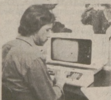
Nowoczesny system komputerowy zapewnia szybki wysyłkę paczek.

Przesyłki Lotnicze Cena: $1.50 za funt wagi Chicago / Poland