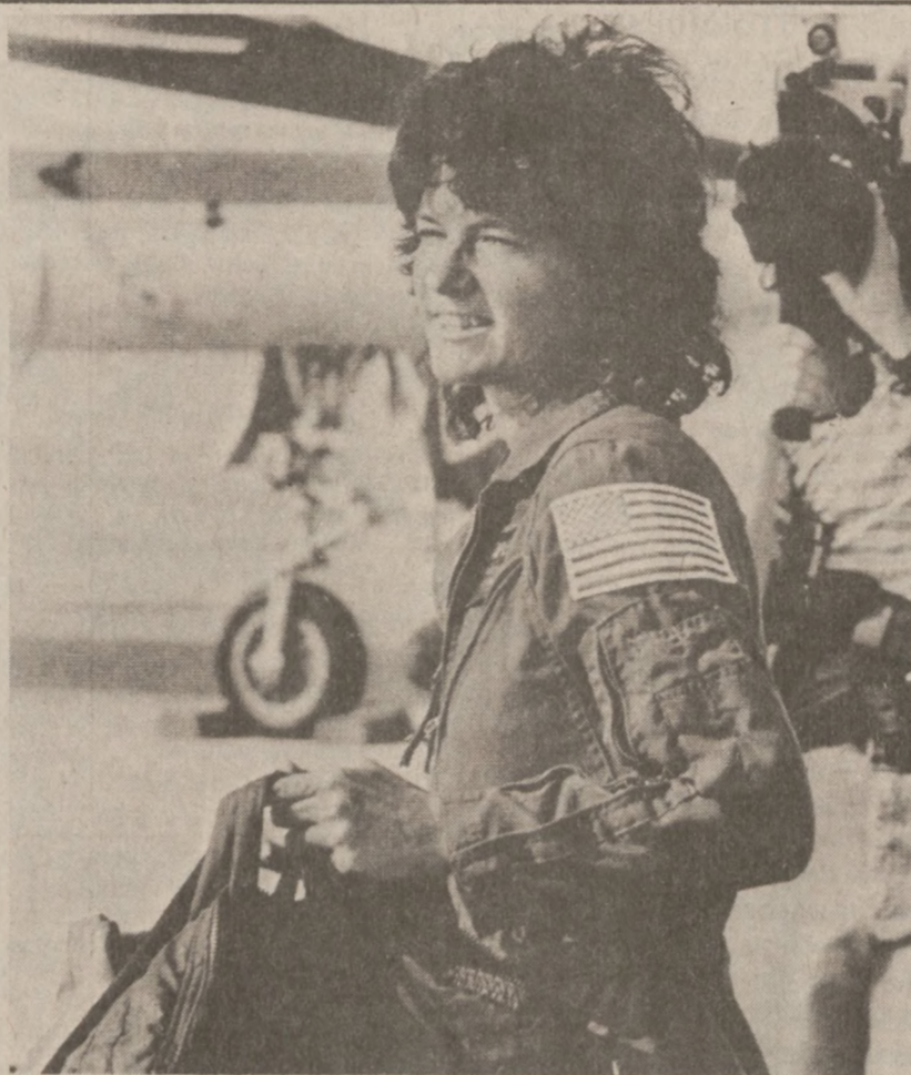
CAPE CANAVERAL, FLA. — Pierwsza amerykańska astronautka, Sally Ride, w trakcie przygotowań do lotu wahadłowca kosmicznego "Challenger", który w najbliższy piątek zakończy swoją misję.

Helms oświadczył w Rosemont, że zdecydowana większość przedstawionych mu zarzutów nie posiada żadnego uzasadnienia.