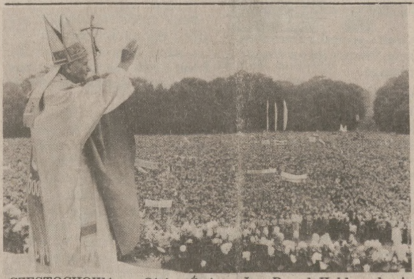
CHĘSTOCHOWA — Ojciec Święty Jan Paweł II błogosławi tłumy, które zebrały się 19 czerwca pod klasztorem Jasnogórskim.