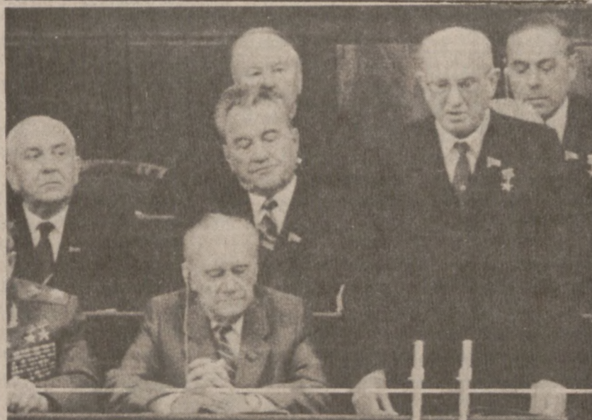
MOSKWA — Juri Andropow wygłasza przemówienie po powołaniu go 16 czerwca na stanowisko przewodniczącego Najwyższej Rady Związku Sowieckiego. Pełni on również funkcje sekretarza generalnego sowieckiej partii komunistycznej oraz przewodniczącego Rady Obrony ZSRR.