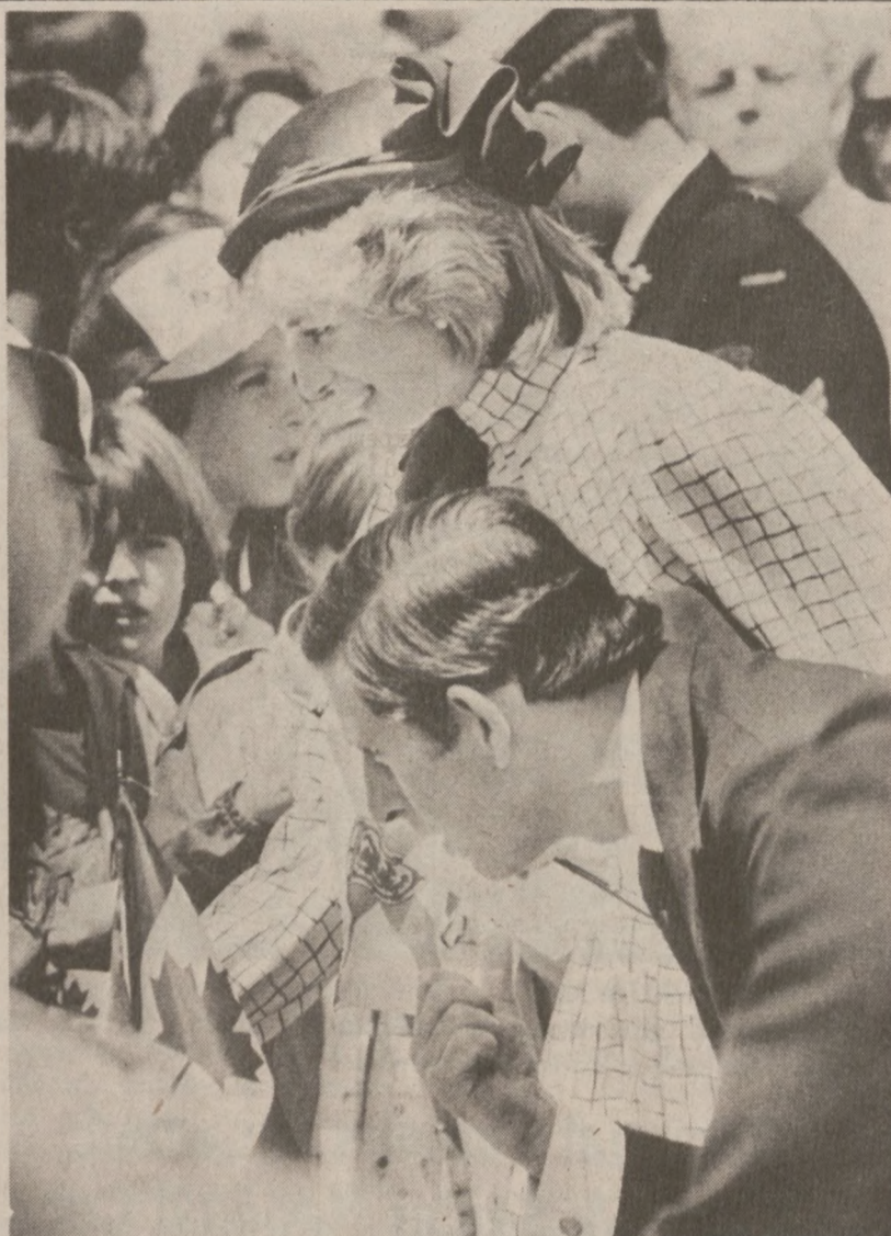
HALIFAX, N.S. — Księżę Karol oraz jego małżonka, księżna Walii, Diane, udali się w 18-dniową podróż do Kanady.

London (UPI) — Cena dolara spadła dzisiaj na wszystkich giełdach europejskich. Cena złota wzrosła w Londynie do $420.50 za uncję.