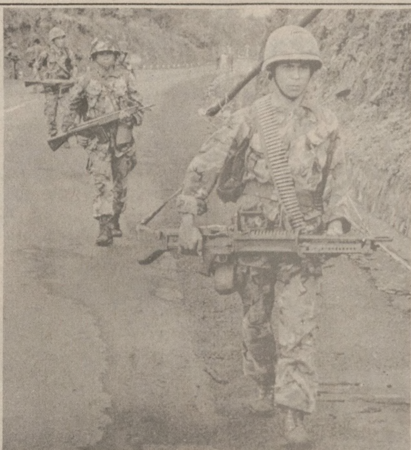
TECOLUCA, SALWADOR — Żołnierze armii rządowej patrolują okolice autostrady w pobliżu Tecoluca, 35 mil na wschód od stolicy kraju, San Salvador.

W grupie finałowej grało 5 drużyn — oprócz Cracovii wystąpiły Polonia Warszawa, Warta Poznań, Pogonia Lwów i ŁKS. W barwach Cracovii wówczas grali: Popiel, Latach, Rogalski, Fryc, Gintel, Synowiec, Ciekowski, Styczeń, T. Dąbrowski, Sperling, Nowak, Limanowski, Kogut, Kaluża, Kotapka, Chruściński, Mielech, Strycharz.