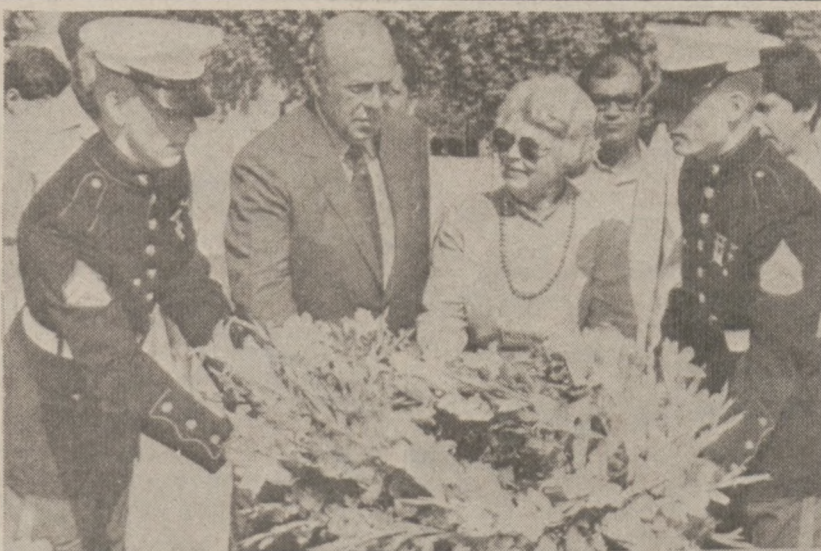
NEW DELHI. — Sekretarz stanu U.S. George Shultz z żoną w czasie ceremonii składania wieńca przy Rajghat (świątyni Gandhiego). Sekretarz Shultz był z wizytą w Indiach w ostatnich dniach czerwca.

Cena złota w Londynie wzrosła do $414.375 za uncję.