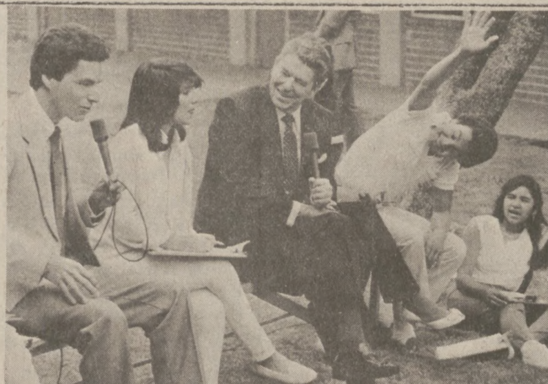
WHITTIER, KALIFORNIA. — Prezydent Ronald Reagan w rozmowie z uczniami szkoły średniej Pioneer.