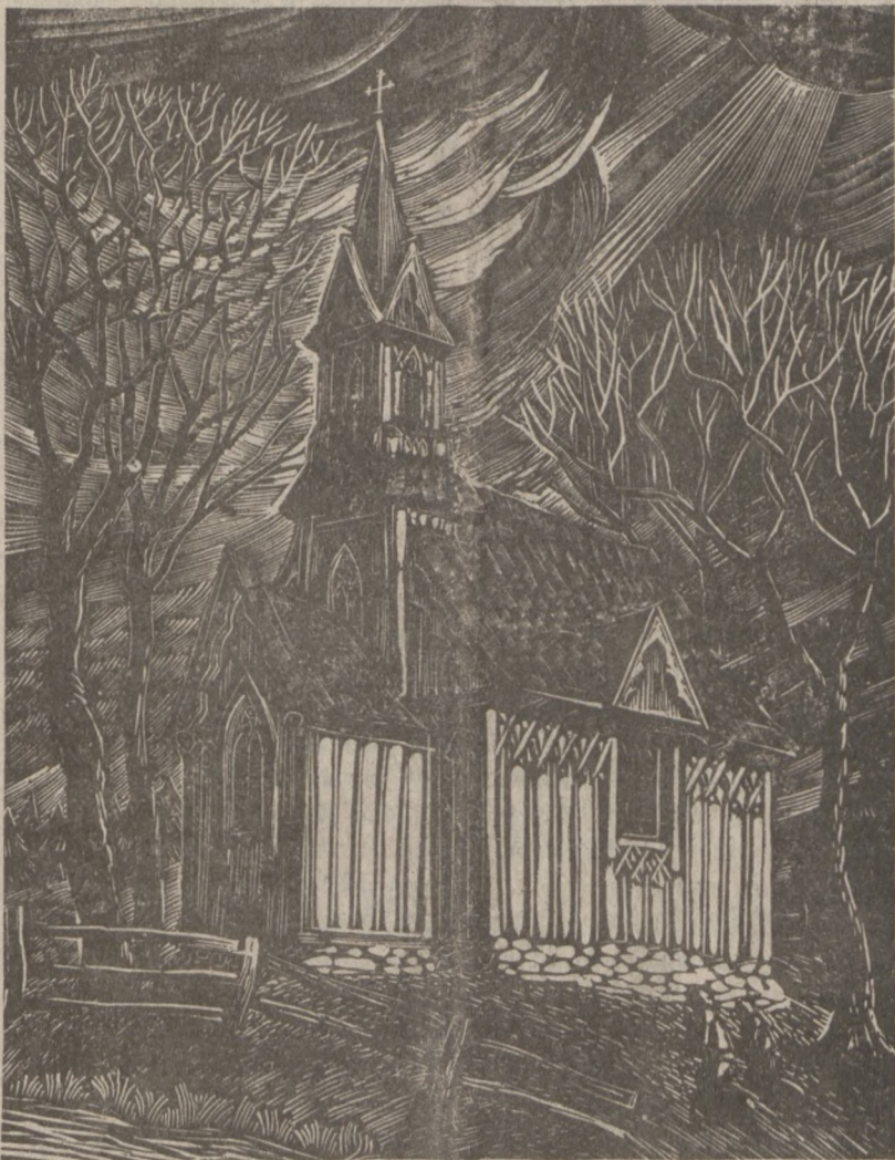
Kapliczka w Płazowie

Orzeczenie sądu zezwala policjantom na przeprowadzanie rewizji samochodów — bez nakazu aresztowania oraz bez uprzedniego aresztowania automobilistów.