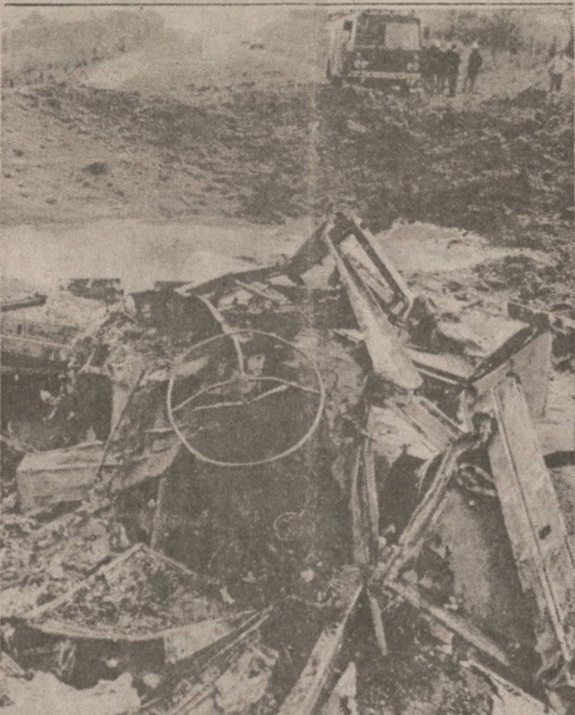
BALLYGAWLEY, POL. IRLANDIA. — Szczątki samochodu w którym zginęło czterech żołnierzy. Samochód najechał na minę podłożoną tu przez członków IRA. Wypadek wydarzył się w środę, 13 lipca br. (UPI)

W mieście nie wybuchła co prawda panika, jednak spora część jego 900,000 mieszkańców pozbawiona była w tym czasie wody oraz połączeń telefonicznych, liczni turyści narzekali też na opóźnienia planowanych odlotów z lokalnego lotniska.