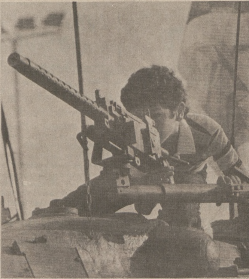
TEL AVIV, IZRAEL. — Chłopiec żydowski ogląda karabin maszynowy umieszczony na czołgu, znajdującym się na specjalnej wystawie broni, jaką otwarto tu 9 lipca.