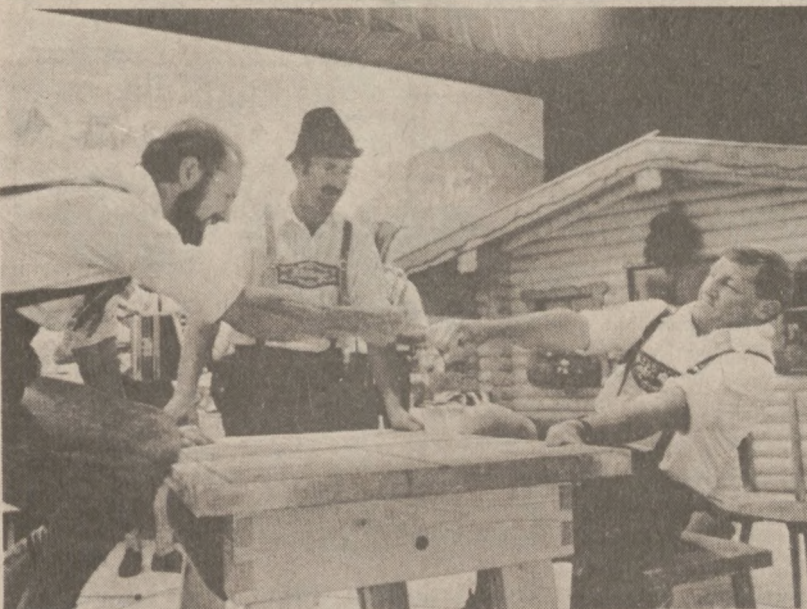
INZELI, NIEMCY ZACHODNIE. — W Bawarii nadal zgodnie z tradycją odbywają się zawody.. ciągnięcia palców. Na zdjęciu finałowe zawody — moment zwycięstwa.