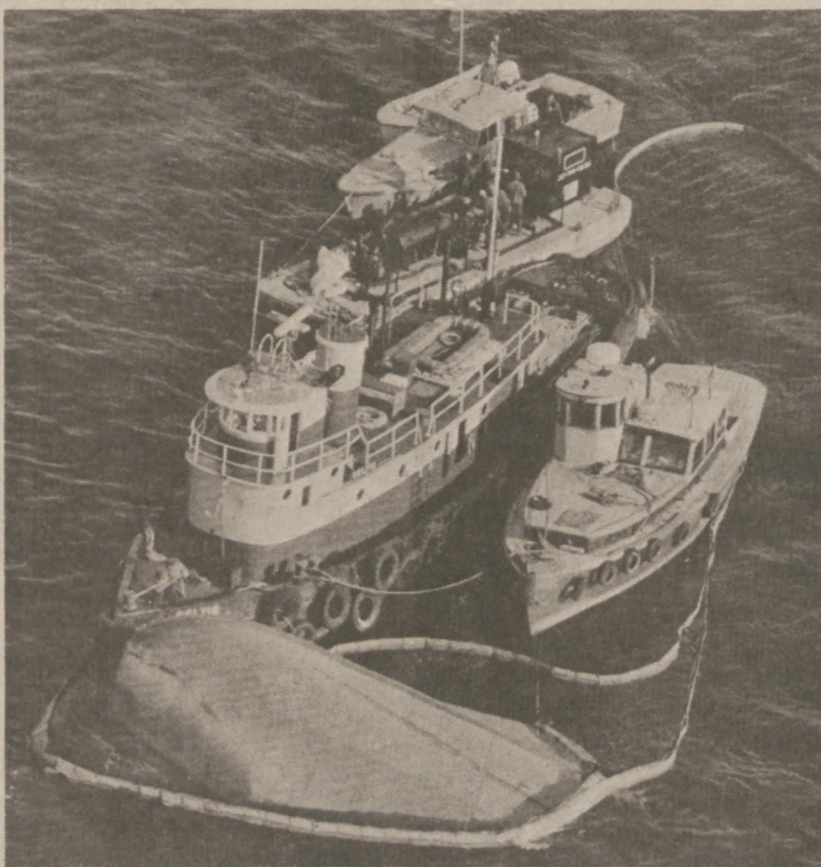
PORTLAND, MAINE. — Wywrócił się tu 7 lipca holownik holujący barkę z benzyną. W wyniku tej katastrofy zginęła jedna osoba, pięć zostało rannych. Na zdjęciu akcja ratunkowa.