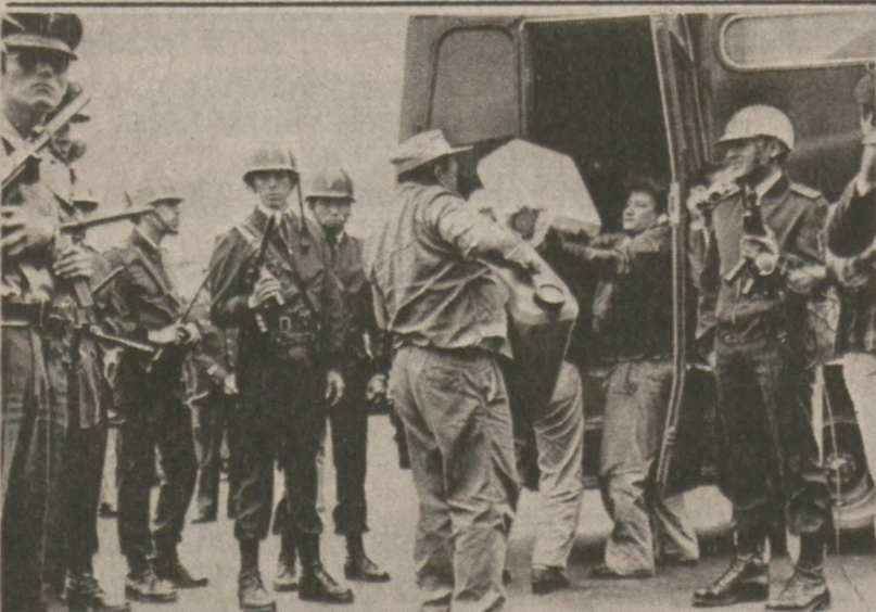
LIMA, PERU. — Pracownicy lokalnego lotniska załadują samochody butlami wypełnionymi kokainą, skonfiskowaną handlarzom.

Główna wygrana w loterii stanowej w grze Lotto, doszła już do $3.75 mln. Jeśli nie znajdzie się szczęśliwiec, który trafnie odgadnie wszystkich sześć cyfr w tej grze (w czasie sobotniego ciągnięcia) — nagroda jeszcze się powiększy.