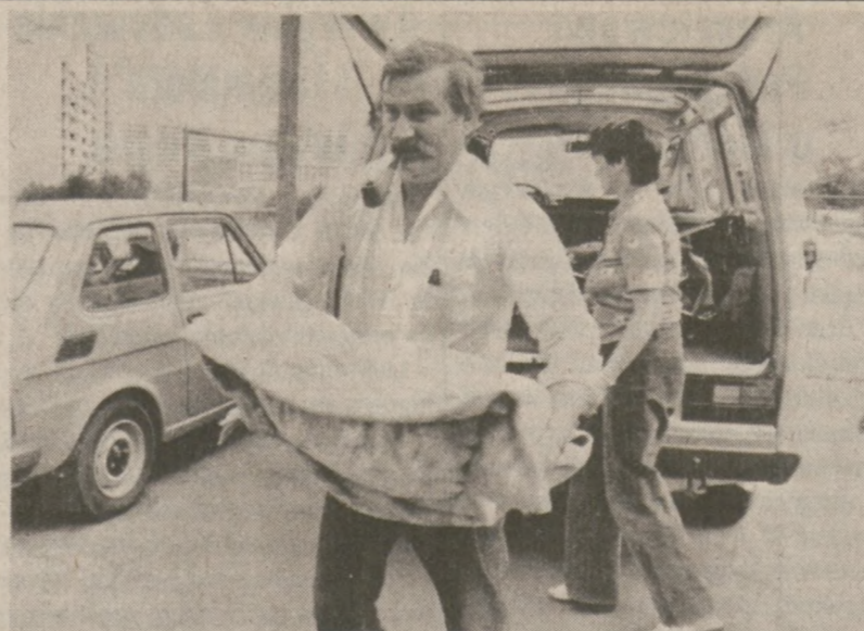
GDANSK. — Lech Wałęsa powrócił z miesięcznych wakacji. Na zdjęciu w chwili, gdy znosi pakunki do mieszkania. W głębi zdjęcia — Danuta Wałęsowa.