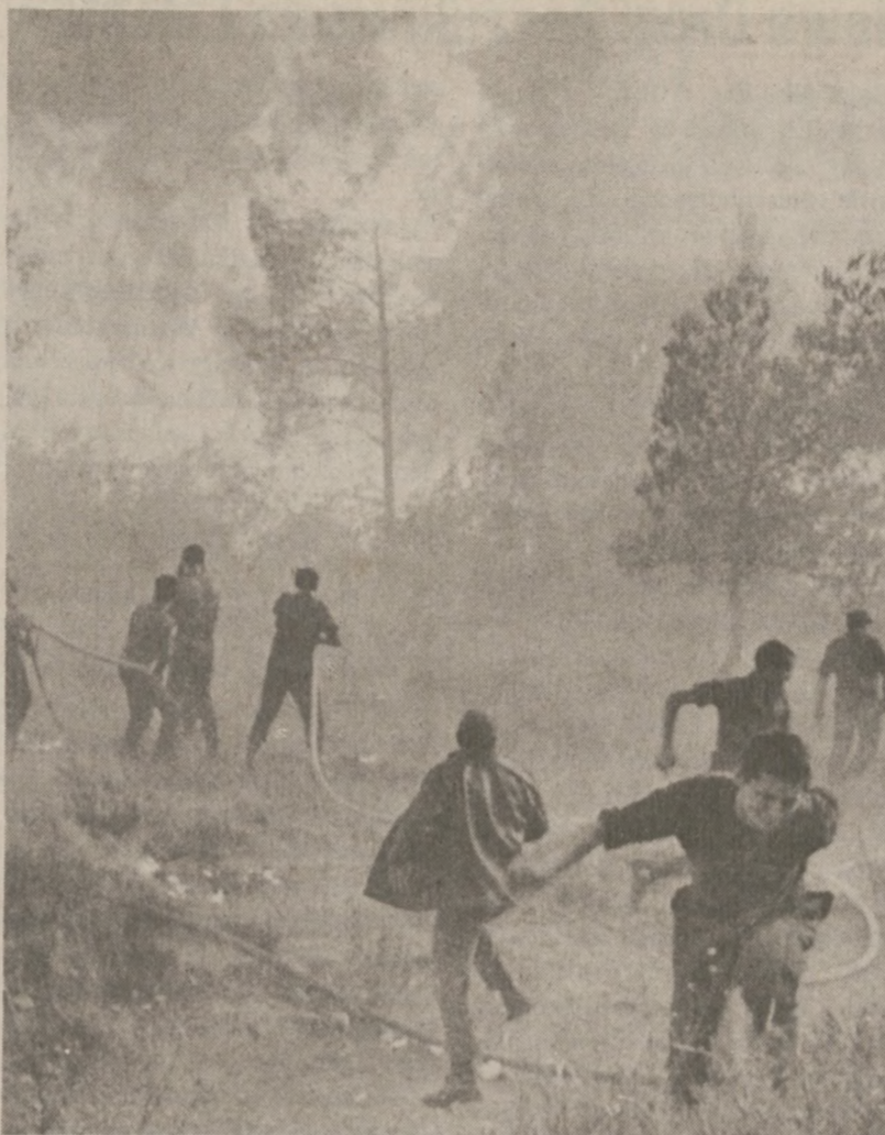
FREJUZ, FRANCJA. — Strażacy walczą z pożarem lasu.

Pamiętaj, że wobec zmuszenia narodu polskiego do milczenia, "Dz. Związkowy" jest jego wolnym głosem.