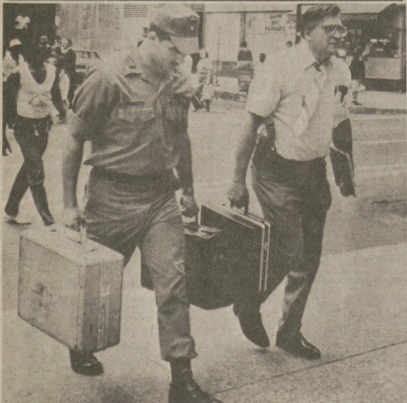
CHICAGO — Specjaliści zajmujący się rozbrajaniem bomb, w drodze do budynku federalnego Dirksen, gdzie młody mężczyzna zatrzymał trzy zakładniczek, grożąc władzom wysadzeniem budynku w powietrze bombą, którą rzekomo miał przy sobie.

Cięcia budżetowe mogą zmusić bibliotekę chicagowską do zamknięcia 15 z 82 oddziałów. Rada Biblioteki Miejskiej stara się znaleźć rozwiązanie w związku z budżetem mniejszym o $2.3 milionów. Przewodniczący Rady Charles Swibel oświadczył, że zamknięcie 18 oddziałów zaoszczędziło by $1.8 miliona. Następne $500,000 Rada wzięłaby z budżetu na kupno nowych książek.