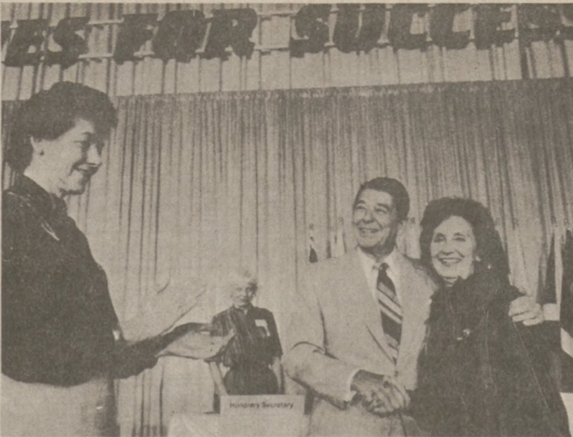
WASHINGTON — Prezydent Ronald Reagan w czasie spotkania z przedstawicielami organizacji kobiecej International Association of Business and Professional Women.

Spodziewanym jest, że wyniki tego śledztwa zostaną przedłożone Wielkiej Ławie Przysięgłych nie wcześniej jak za sześć albo więcej miesięcy.