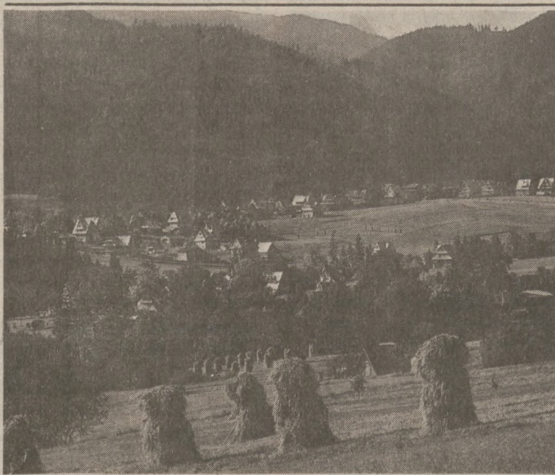
POLSKA. — Żniwa w całej pełni.

Bejrut, Liban (UPI, ST) — Pierwsza pokojowa misja bliskowschodnia nowego wysłannika Stanów Zjednoczonych Roberta McFarlane zakłada na jest serią ataków terrorystycznych. W dniu dzisiejszym ogień artyleryjski objął bejruckie lotnisko zabijając 3 Libańczyków oraz raniąc co najmniej 7 osób, w tym żołnierza amerykańskiego wchodzącego w skład międzynarodowego korpusu pokojowego.