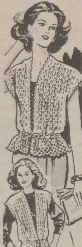
7517 by Alice Brooks

Dressy or casual, choose the look you love in easy crochet. One has a drawstring waist and peplum effect, the other a ribbed border and buttons. Crochet every-day-useful vests of pompadour yarn. Pattern 7517. Sizes 10-12, 14-16 included. $2.50 for each pattern. Add 50¢ each pattern for postage and handling. Send to: