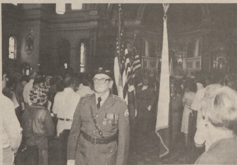
Poczty sztandarowe wychodzą z kościoła, po uroczystej Mszy św.

Z dała od Ojczyzny, na powiercie, polski żołnierz obchodził swe święto, na uroczystościach zorganizowanych pod kierownictwem Koła 53 SPK, w ubiegłą niedzielę w parafii św. Jacka.