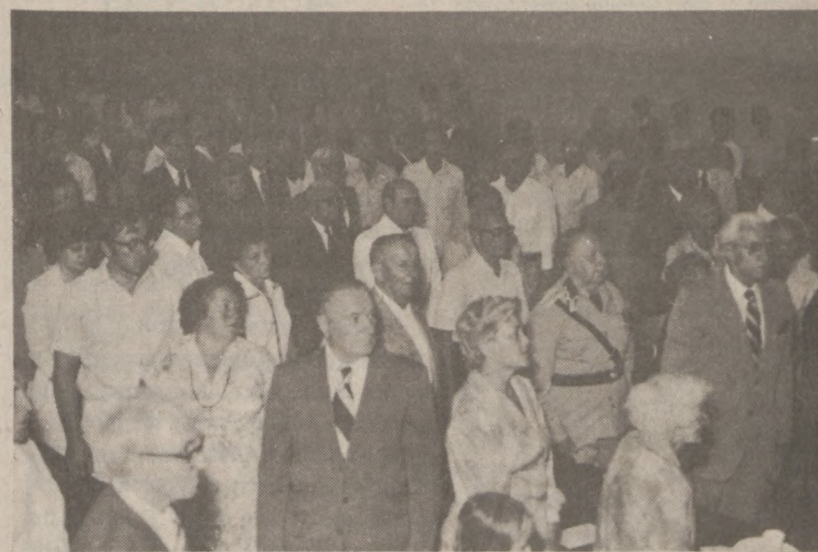
Fragment sali w czasie akademii.

Przeżywalimy zwycięstwa i klęski, troski i radości. Popłynęła piosenka żołnierska od legionowej po "Czerwone Maki," "Marsz Mokotowa" i "Kar-