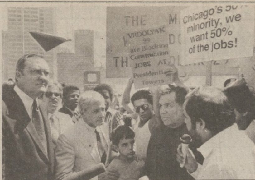
CHICAGO. — Gubernator Thompson i senator Chuck Percy w rozmowie z demonstrującymi przedstawicielami Latynosów. Domagali się oni posad przy pracach budowlanych na terenie Chicago. Demonstracja odbyła się 9 sierpnia.

Obie strony zaznaczyły, że nie będą żądać od uchodźców, którzy korzystali z tych funduszy, zwrotu wyplaconych im sum — nawet, gdy otrzymali je niesłusznie.