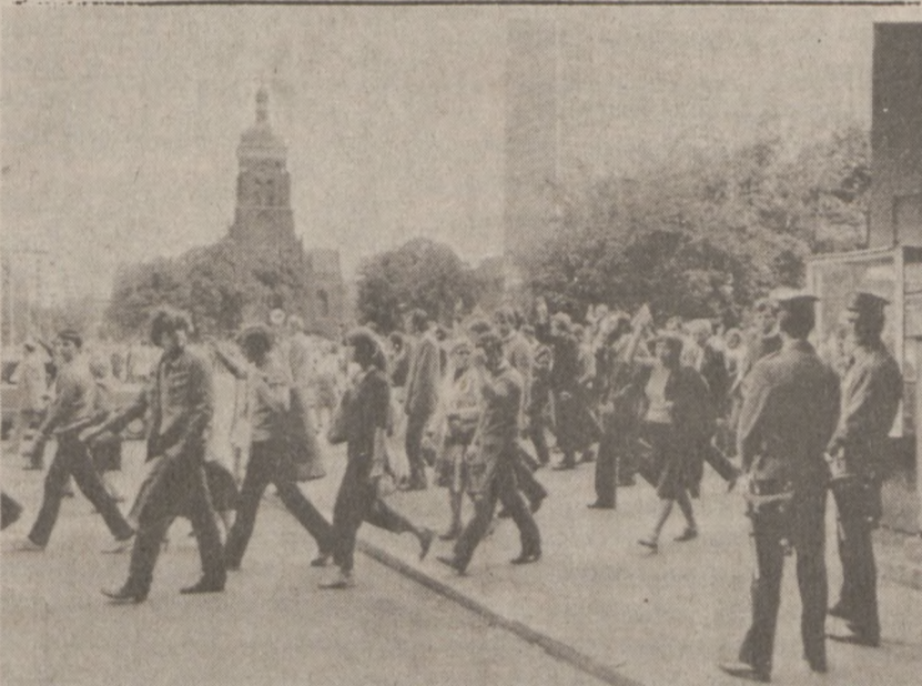
GDĄŃSK. — Zwolennicy "Solidarności" w drodze z kościoła św. Brygidy pod stocznice, gdzie znajduje się Pomnik Stocznia. Idącym ludziom przyglądają się dwaj milicjanci. Zdjęcie z 15 sierpnia br.

Cena złota w Londynie wynosiła $421,625 za uncję.