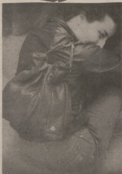
Najmodniejsze, skórzane torby sportowe.