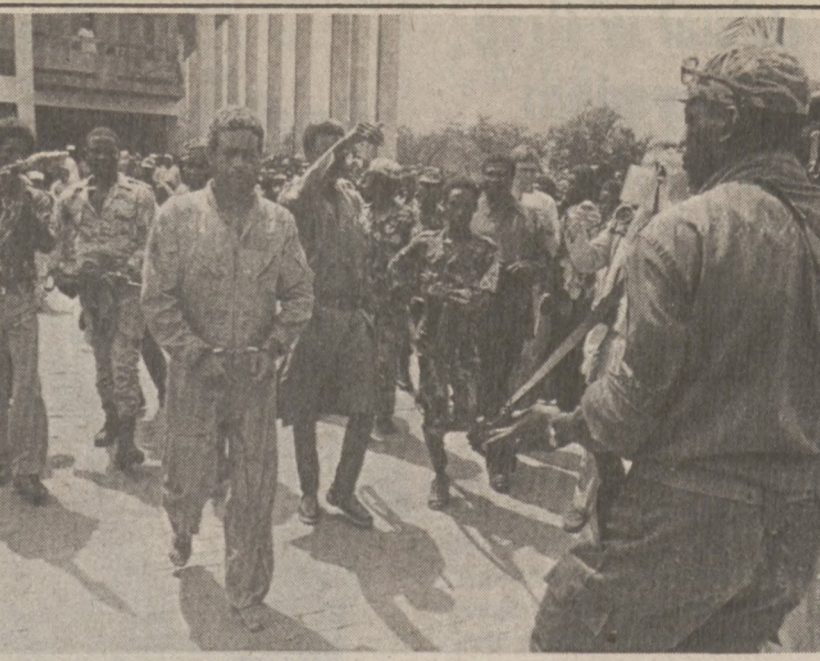
CZAD. — Pilot libijskiego bombowca zestrzelonego nad Czadem wychodzi z palacu kongresowego, gdzie rozmawiali z nim dziennikarze zagraniczni i dziennikarze z Czadu.

Pogrzebem zajmuje się: L.A. Kolssak i Syn, Telefon AL 2-3600.