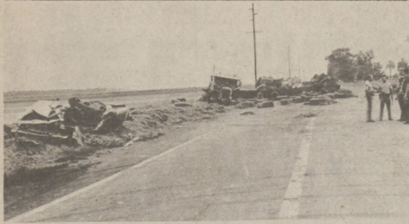
COACHELLA VALLEY. — Scena kraksy samochodowej w której zginęło 10 osób.