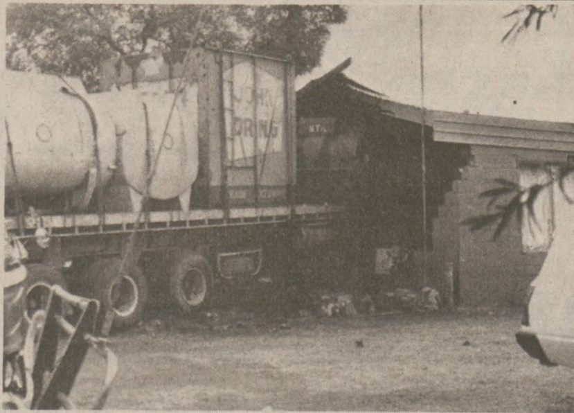
SYDNEY, AUSTRALIA. — Kierowca ciężarówki, któremu odmówiono podania napoju w barze motelowym z zemsty wjechał w budynek motelu, zabijając cztery osoby. (UPI)

London (UPI) — Cena dolara ponownie wzrosła na wszystkich giełdach europejskich. Cena złota w Londynie spadła do $414.875 za uncję.