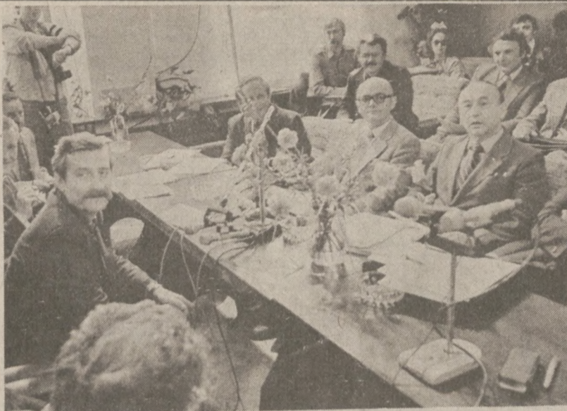
GDĄNSK. — Sierpień 1980 r. — Widok sali w stoczni im. Lenina w której prowadzono rozmowy między Komitetem Strajkowym a komisją rządową.

Przedstawiciele związków zawodowych nauczycieli nie podjęli decyzji ogłoszenia strajku czekając wczoraj na decyzję Rady Szkolnej. Jeżeli nie zostanie podpisany nowy kontrakt w dzisiejszym spotkaniu związków z Radą, przedstawiciele związków rozpoczną głosowanie nad decyzją strajku dzisiaj o godz. 4:30 po południu.