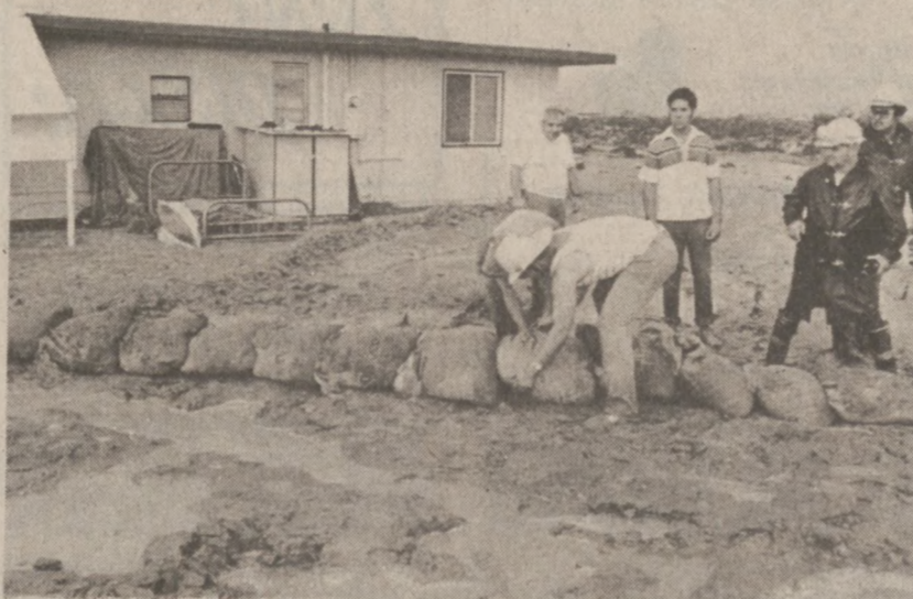
29 PALMS, KALIFORNIA. — Niespotykana w tym rejonie burza przeszła przez pustynię, zalewając sąsiednie miejscowości. Mieszkańcy zmuszeni byli układać zapory z worków wypełnionych piaskiem, aby uchronić domostwa.