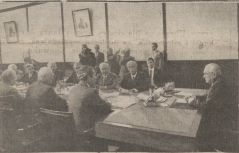
MOSKWA. — Jurij Andropow w rozmowie z amerykańskimi senatorami, którzy byli z wizytą w ZSRR w pierwszej połowie sierpnia br. Zdjęcie z 18 sierpnia.