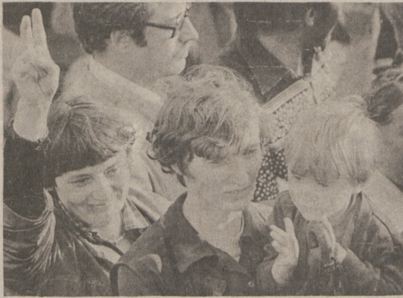
GDĄŃSK. — Sierpień 1980 r. — Rodziny strajkujących przez 18 dni stoczniowców z radością powitały wiadomość o pełnym zwycięstwie robotników polskich.

Uprzednie oferty sowieckie mówiły jedynie o demontażu pocisków, co wzbudzało podejrzenia, iż mogą one zostać zmontowane powtórnie za Uralem zagrażając państwom azjatyckim.