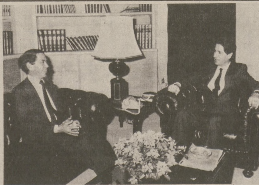
BEJRUT. — Prezydent Libanu Amin Gemayel w rozmowie ze specjalnym doradcą prezydenta Egiptu Hosni Mubaraką Oussama el Baz (po lewej).

Za propagandowym jedynie celem tych ofert sowieckich przemawia także fakt, iż zostały one wystosowane na kilka tygodni przed mającą się rozpocząć na Zachodzie potężną kampanią pacyfistyczną na rzecz powstrzymania rozmieszczenia pocisków amerykańskich nowej generacji.