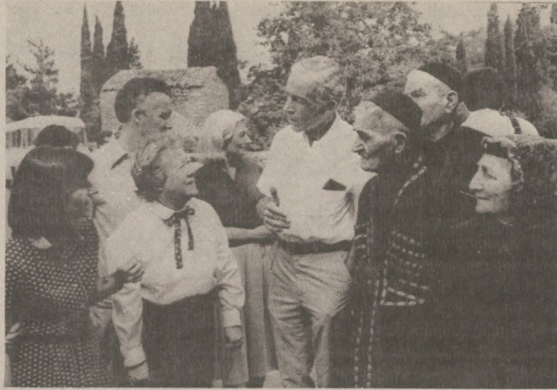
TBILISI. — Amerykańscy senatorzy w czasie swej wizyty w ZSRR zwiedzili republikę Gruzji. Na zdjęciu żona sen. Long z sen. C. Pell w rozmowie z długowiecznymi mieszkańcami tej republiki.