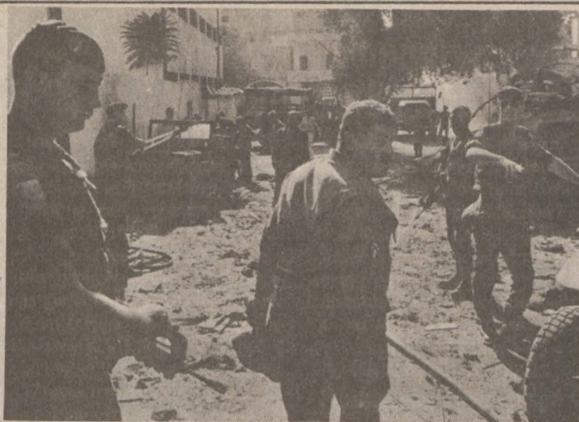
BEJRUT. — Żołnierze francuscy kierują akcją oczyszczania ulic z gruzów, po eksplozji, jaka nastąpiła w pobliżu ich posterunku.