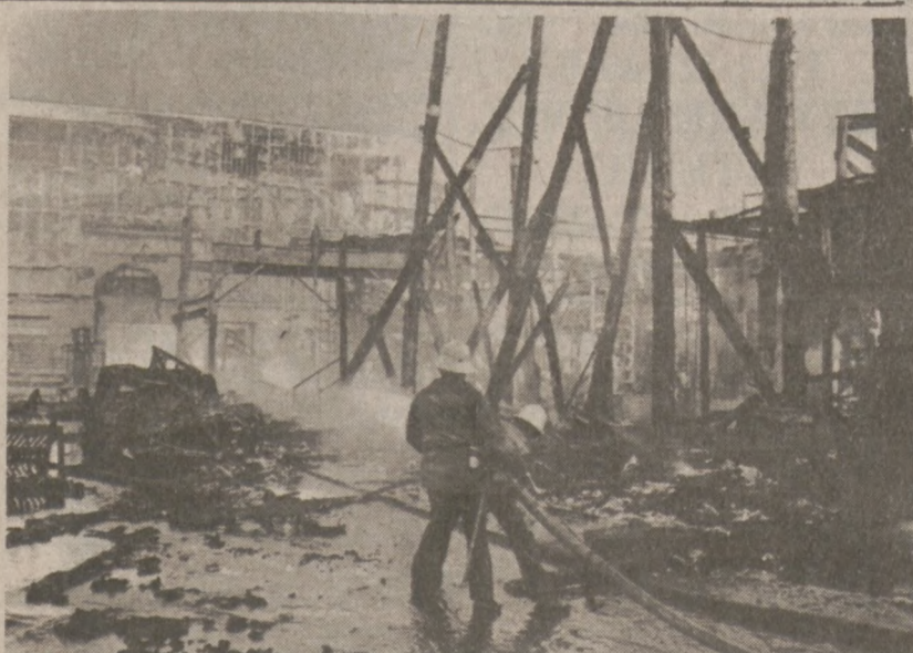
HOLLYWOOD. — Zgiszczają dekoracje, które spłonęły na terenach "Paramount Studios" 25 sierpnia.

W katastrofie zginęło 269 ludzi. Wydział Stanowy K.P.A. solidaryzuje się z Koreańczykami i apeluje do udziału w demonstracji.