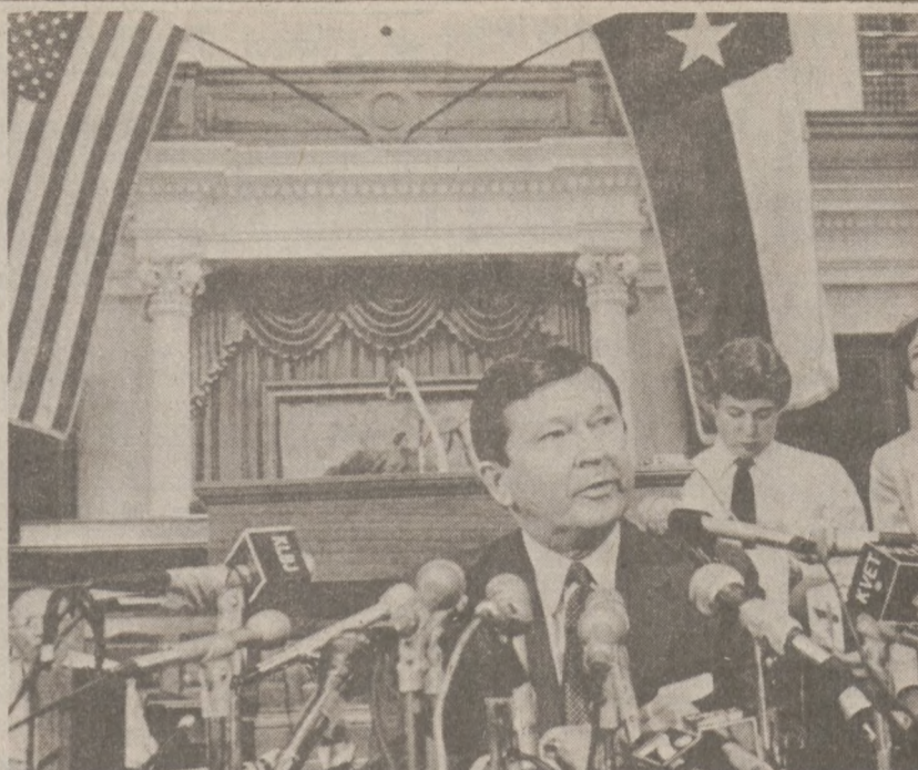
AUSTIN, TEKSAS. — Sen. John Tower — republikanin, podał do wiadomości, że nie ma zamiaru ubiegać się o ponowny wybór do Senatu Stanów Zjednoczonych.

Na ulicach Joliet nadal patrolują oddziały Guardian Angels — organizacji młodych ludzi, którzy chcieliby pomóc społeczeństwu w walce ze zbrodniami.