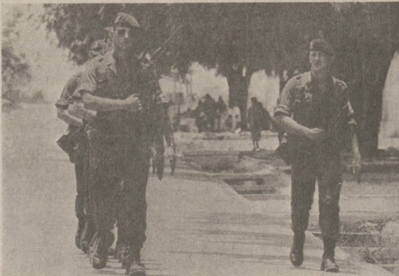
CZAD. — Francuscy spadochroniarze patrolują ulice stolicy Czadu.