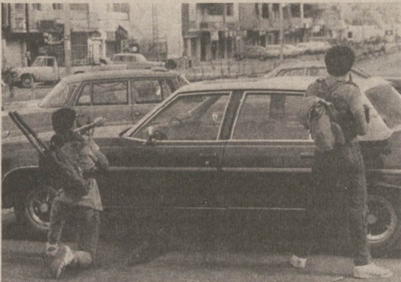
BEJRUT. — Walki uliczne w Bejrucie. Na zdjęciu dwaj członkowie zbrojnych oddziałów muzułmańskiej sekty szyitów.