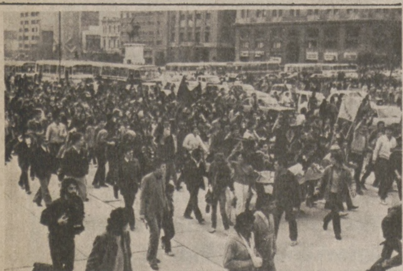
SANTIAGO, CHILE. — Demonstracja członków partii chrześcijańsko-demokratycznej przeciw prezydentowi Augusto Pinochet, jaka odbyła się tu 27 sierpnia br.