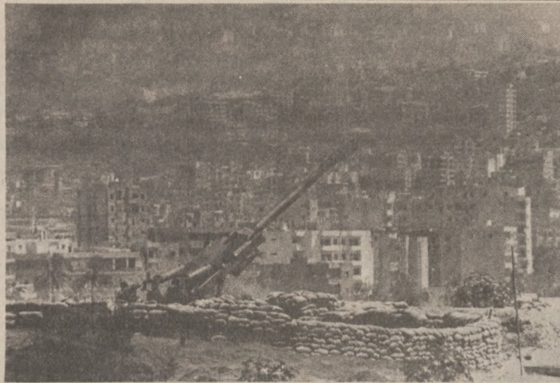
BEJRUT. — Działo należące do oddziałów amerykańskich strzelców morskich "155 mm howitzer", jedno z sześciu z jakich strzelano w kierunku szczytów, po atakowaniu przez nich pozycji amerykańskich. W ataku Szytów zginęło dwóch żołnierzy amerykańskich.

Rzecznik zarządu kopalni oświadczył, że na pomoc w akcji ratunkowej wyruszyły ekipy ratownicze z sąsiednich kopalni.