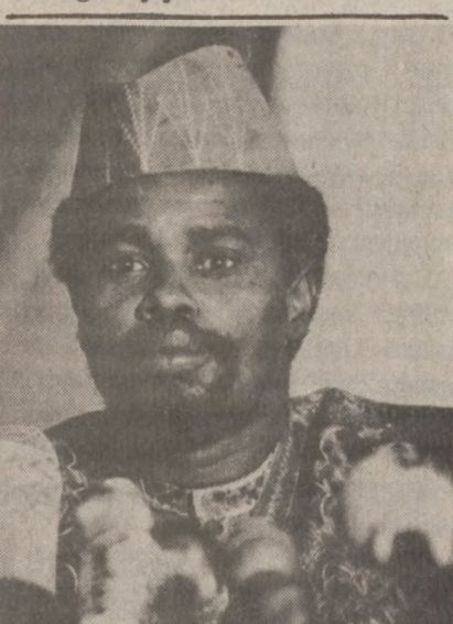
NDJAMENA, CZAD — Prezydent Czadu Hissene Habre.

Na łamach "Przeglądu Konińskiego" ukazał się felieton PYTAJNIKA. Proponuje on wydanie zarządzenia, tj. — ustalenia obywatelsko-administracyjnego. Ustalenie to pod groźbą surowych mandatów wprowadziłoby: "Zakaz wywieszania i suszenia bielizny itp w dni świąteczne i uroczystości, rocznice itp. (tak świeckich jak i religijnych) aby każdy mógł je uczcić według swojej woli".