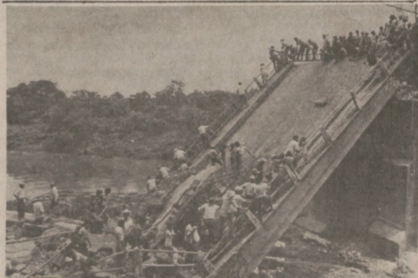
SAN MIGUEL, SALWADOR. — Przechodnie starają się wy dostać z mostu, zawalonego przez lewicowych rebeliantów 5 września br.

Jak z ostatnich wypowiedzi wynika, groźba strajku staje się coraz poważniejszą.