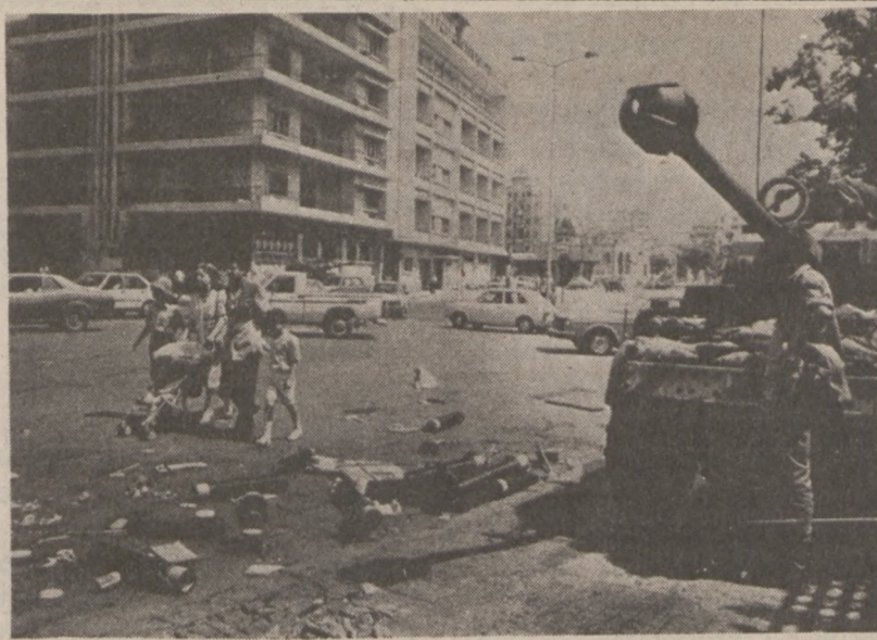
BEJRUT. — Czołgi armii libańskiej na ulicach stolicy. (UPI)

St. Surowka — prezes Fr. Puzska — koresp.