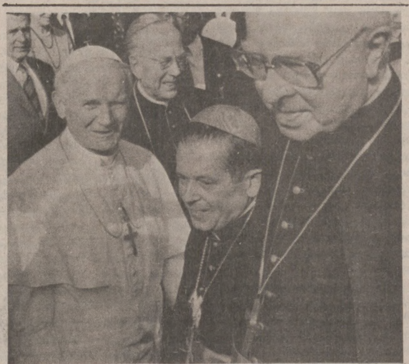
WIEDŃ, AUSTRIA. — Na lotnisku wiedeńskim przywitani Ojca Świętego Prymasa Polski Kardynał Józef Glemp, (w środku); austriacki kardynał Franz Koenig (po prawej) i holenderski kardynał Willebrands (w tyle). Zdjęcie z 10 września 1983 r.

McGovern posiada już spore doświadczenie w zakresie prowadzenia kampanii wyborczej, gdyż w 1972 roku bezskutecznie ubiegał się o wybór, przegrywając jednak walkę z Richardem Nixonem.