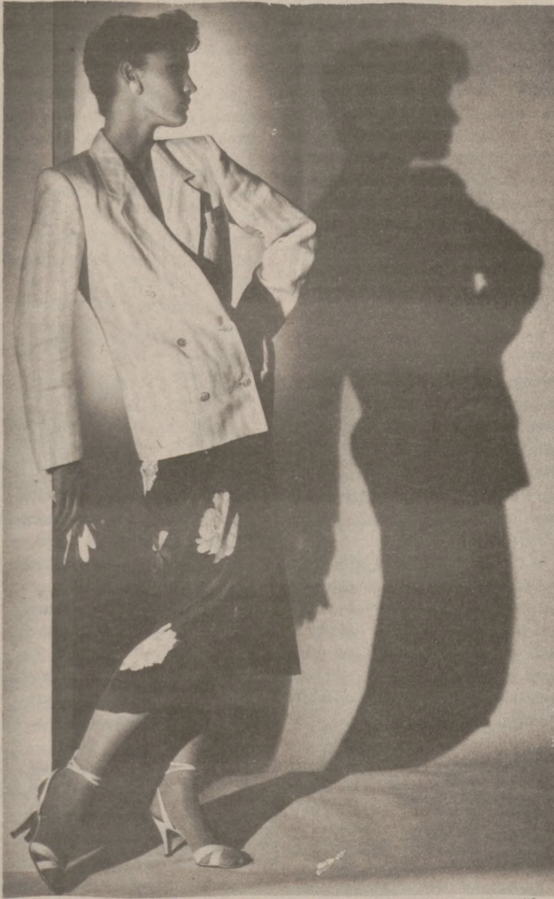
Dwurdzędowy żakiet z satyny w paski z jedwabną spódnicą w niebieskim kolorze z białymi kameliami.