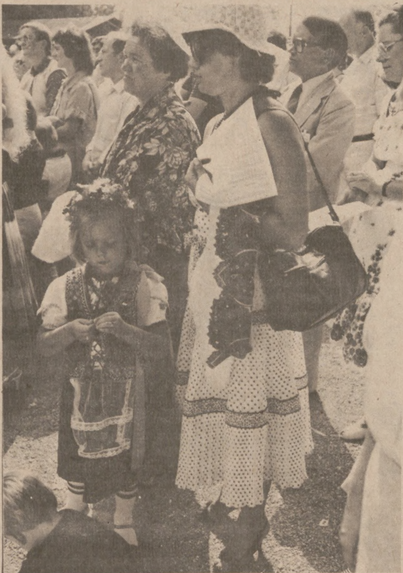
Obchód Odsieczy Wiedeńskiej w polskim Rapperswilu, 28 sierpnia 1983 r. Najmłodsza uczestniczka Zlotu Polaków ze Szwajcarii w Rapperswilu.

Na Wzgórzu Zamkowym, u stóp Kolumny Wolności, wysłuchano celebrowanej przez duchowieństwo polskie i szwajcarskie Mszy św., odprawionej — jak to podkreślił w swoim kazaniu dziekan rapperswilski, K.