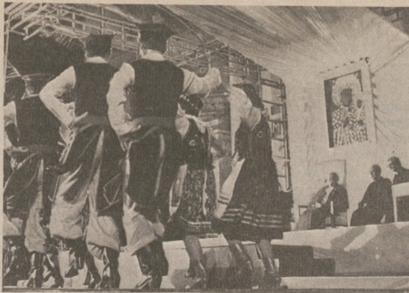
WIEDŃ. — Zespół taneczny polskiej młodzieży popisuje się przed Ojcem Świętym w czasie spotkania z Polakami.

Wcześniej sędzia lokalnego oddziału sądu federalnego w Nashville orzekł, że stanowią system więziennictwa w Tennessee działa niezgodnie z Konstytucją, głównie ze względu na panującą w zakładach karnych przeludnienie.