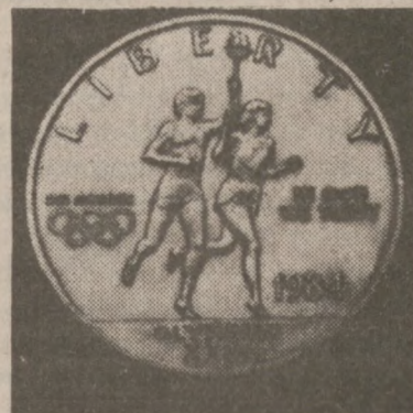
The obverse of the new gold coin

Treasury Secretary Donald T. Regan, in ceremonies recently at the United States Bullion Depository at West Point, N.Y., minted the first United States gold coin in 50 years. The not-for-circulation coin, with a