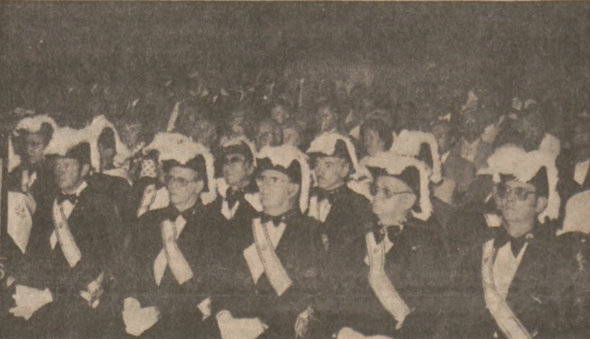
Widok sali, w czasie Mszy św. Na pierwszym planie Rycerze Kolumba z Orlando.