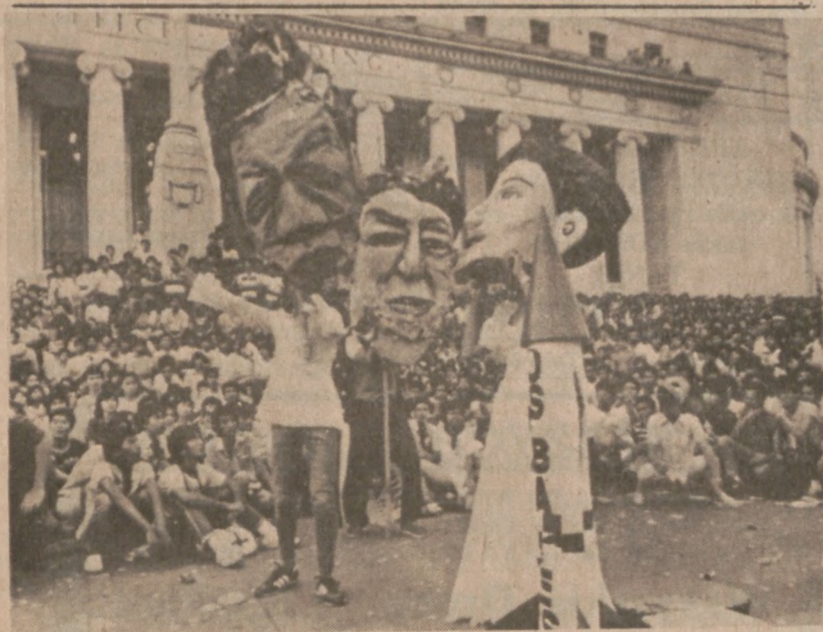
MANILA, FILIPINY. — Podczas antyrządowej demonstracji, jaka odbyła się w centrum Manili 15 września, studenci wystąpili z kukłami, przedstawiającymi prezydenta Reagana, prezydenta Filipin Ferdinanda Marcosa oraz jego żonę, Imeldę Marcos.

Dotychczas nie zdołano schwytać bandytów.