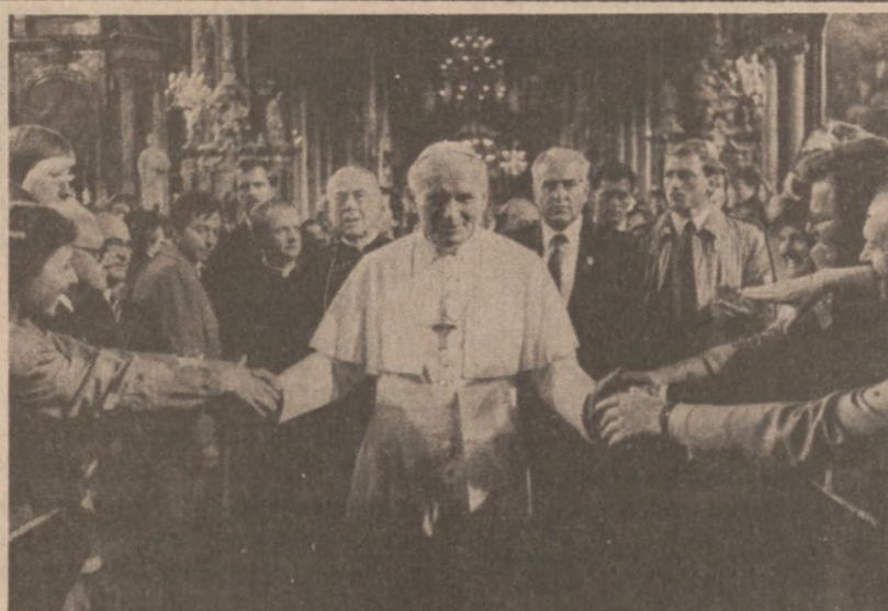
WIEDEŃ. — Papież Jan Paweł II w katedrze św. Stefana przed odprawieniem Mszy św. w 300 rocznicę Odsieczy Wiedeńskiej, 12 września br.