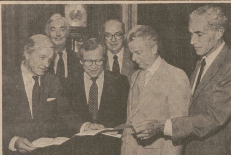
WASHINGTON — Senatorzy (od lewej) Charles Percy (R.-Ill), Daniel Moynihan (D.-N.Y.), Howard Baker (R. Tenn.), Jesse Helms (R. N.C.), Robert Byrd, (D.-W.Va.) oraz Claiborne Pell (D.-R.I.) zapoznają się z treścią poprawek do rezolucji, potępiającej władze Związku Sowieckiego za zestrzelenie południowo-koreańskiego odrzutowca.

Przeciwnicy wspomnianych ustaw podkreślili, że wprowadzenie ich będzie bardzo kosztowne dla podatników, którzy będą musieli płacić za podwyższone uposażenia itp. przedstawiciele wielu związków zawodowych już rozpoczęli szeroko zakrojone kampanie werbunkowe, chcąc zorganizować jak najwięcej pracowników, zapewniając tym samym swemu związkowi wielu nowych członków.