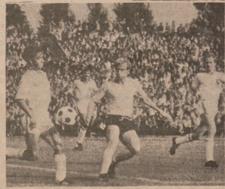
Fragment meczu pucharowego Widzew Łódź — Elfsborg Boras, Swarcgen zakończony wynikiem 0:0. Zaskoczyła wszystkich polskich kibiców słaba postawa Widzewa w Białymstoku.

2956 N. Milwaukee Ave. Pokój 205 A Róg Milwaukee i Central Park