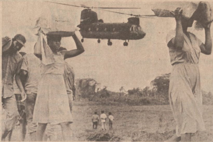
HONDURAS. — Uchodźcy ze szczepu indiańskiego Mosquita, uciekają przed oddziałami Sandinistów.