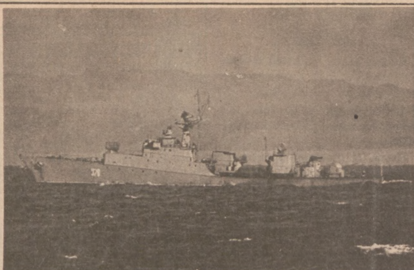
SACHALIN, ZSRR. — Okręt ZSRR "Grisza" odplywa od brzegów Sachalinu. Należał do okrętów prowadzących poszukiwania szczątków południowokoreańskiego samolotu zestrzelonego 1 września.

Przedstawicielka federalnej agencji powiedziała także, iż agencja prowadzić będzie bardzo ścisłą kontrolę w następnym roku, aby sprawdzić oddziaływanie nowego systemu opłat, zapobiec ewentualnym nadużyciom.