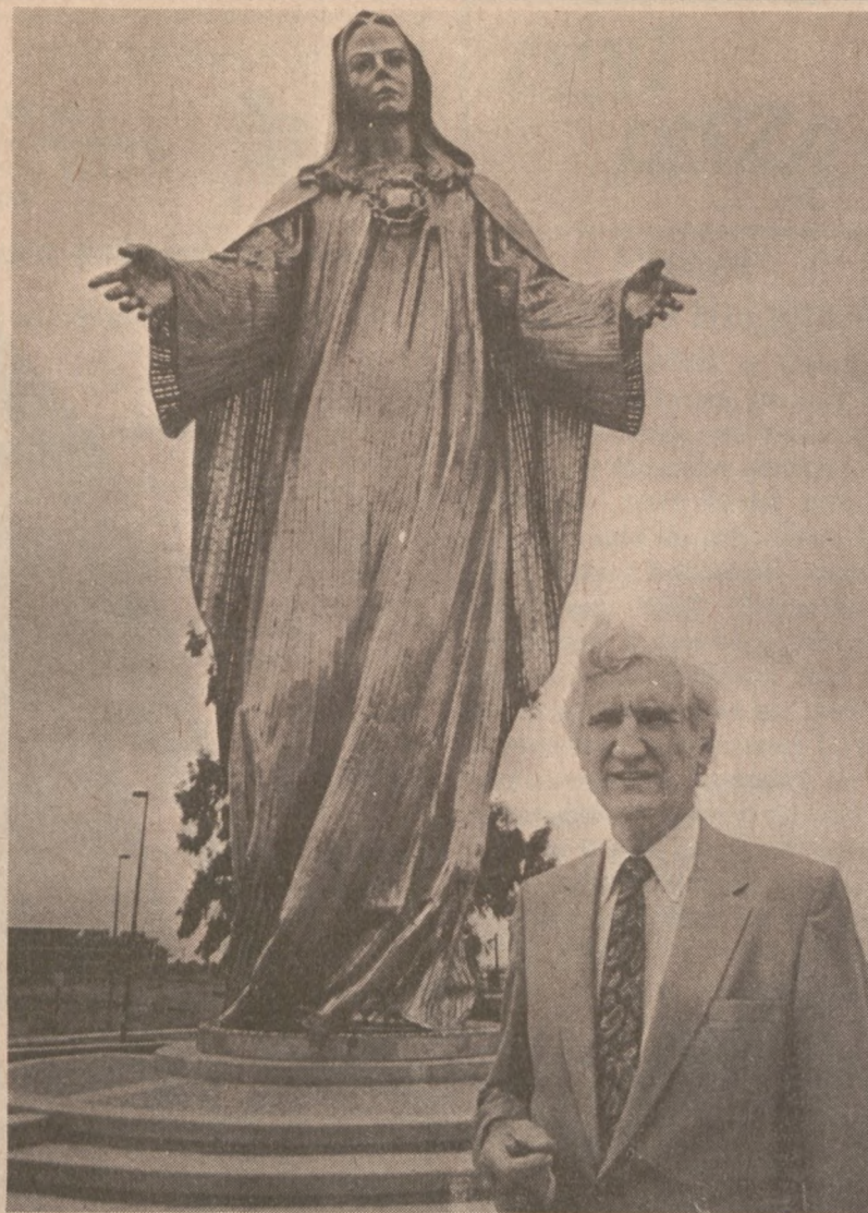
SANTA CLARA, KALIFORNIA. — Posąg Matki Boskiej Królowej Pokoju przybył już na miejsce przeznaczenia. Przez kilka miesięcy znajdował się w Chicago na terenach Seminarium Duchownego Quigley.

(Więcej o dwudniowych uroczystościach przejęcia steru ZNP przez nowy Zarząd w następnych wydaniach Dziennika.)