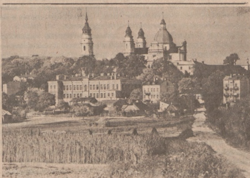
CHELM LUBELSKI. — Fragment miasta z późnobarokowym kościołem.

Sandinisci są również zaniepokojeni zeszytym tygodniową decyzją członków senackiego komitetu w Kongresie USA, którzy drogą głosowania zaakceptowali dalszą pomoc CIA dla antylewicowych partyzantów w Nikaragui. Pomoc ma sięgać $19 mln.