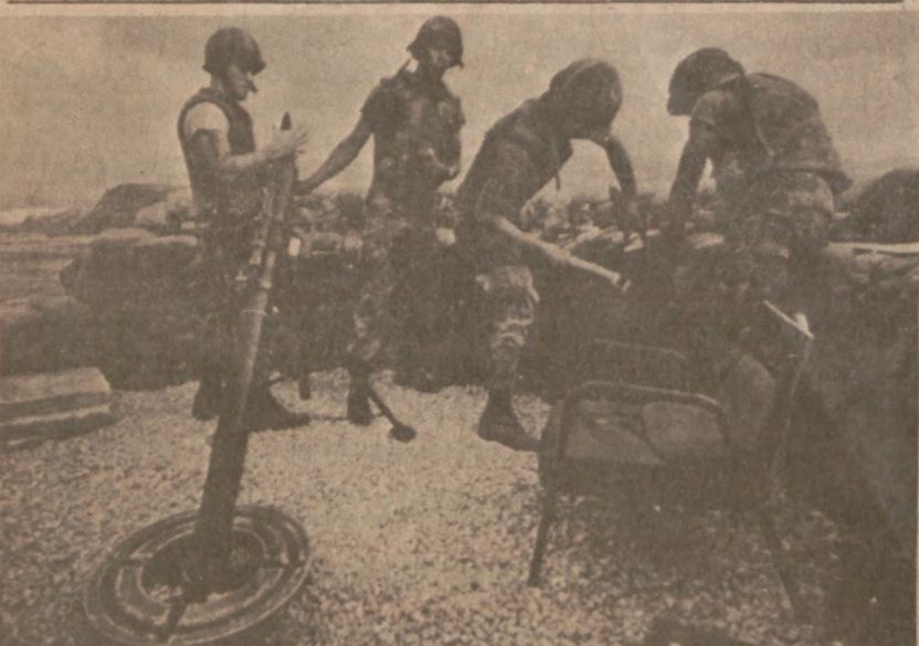
BEJRUT. — Oddział amerykańskich "Marines" na stanowisku bojowym.