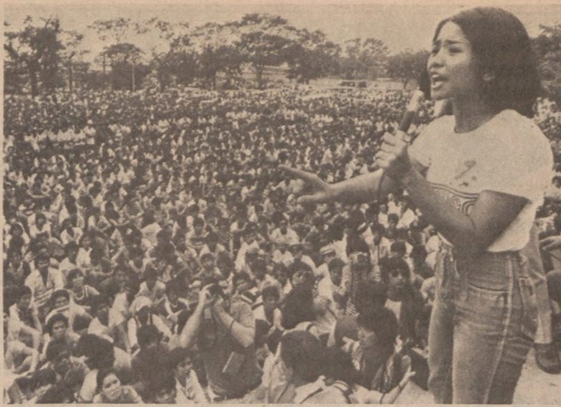
MANILA. — Demonstracja ludności, domagającej się ustąpienia prezydenta Marcosa. Demonstracja ta odbyła się 30 września br.

Mueller, który w wieloletniej karierze zdobył 636 bramek, w swym ostatnim, pożegnalnym meczu, nie strzelił ani jednej.