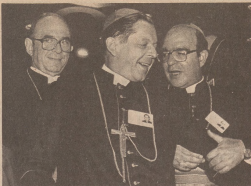
WATYKAN. — Kardynałowie: (od lewej) — Joseph L. Bernardin, z Chicago, Józef Glemp — prymas Polski i Alfonso Lopez Trujillo z Medellinu w Kolumbii, po przyjeździe na Światowy Synod Biskupów.