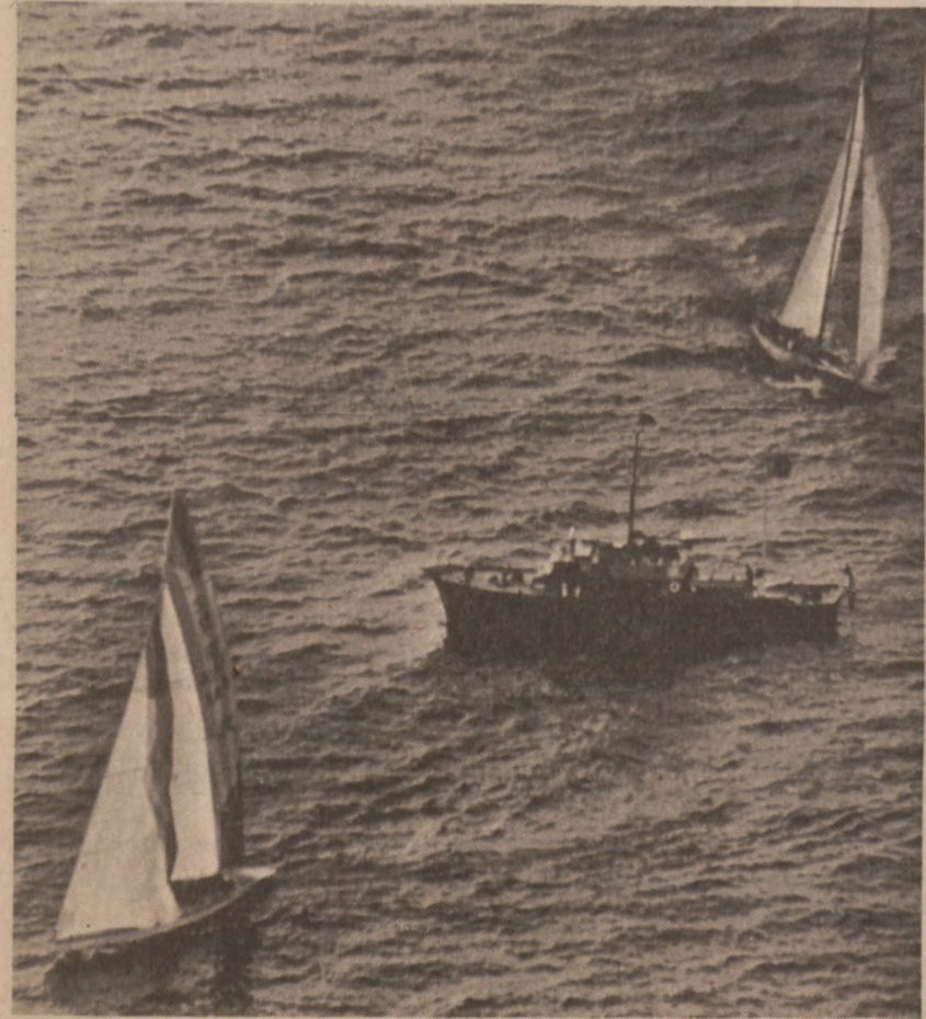
NEWPORT, R.I. — Zwycięski żaglowiec australijski "Australia II", po ostatnim rejsie (u dołu).