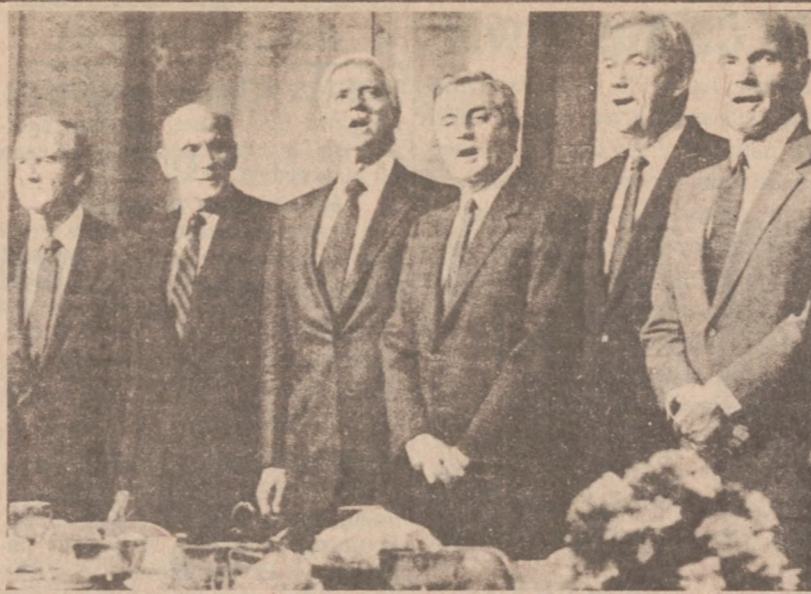
DES MOINES, IOWA. — Sześciu demokratycznych kandydatów na stanowisko prezydenta U.S. na specjalnym obiedzie wydanym z okazji "Jefferson-Jackson Day". Od lewej: George McGovern, Alan Cranston, Ernest Hollings, Walter F. Mondale, Reubin Askew i John Glen.

Zwrócono też uwagę, iż przepisy regulujące przyznawanie stypendiów nie zabraniają przydzielania im osobom znanym lub spokrewnionym z ustawodawcami. Jedynym ograniczeniem, jakie mają ustawodawcy stanowi jest to, iż mogą przyznawać stypendia jedynie studentom mieszkającym w ich okręgach wyborczych.