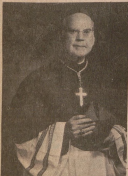
NOWY YORK. — Kardynał Terence Cooke (zdjęcie z 1981 r.), który zmarł 6 października 1983 r.

ADMINISTRACJA DZIENNIKA ZWIĄZKOWEGO — ZGODA 6100 N. CICERO AVE. • Chicago, IL 60646 TELEFON 286-0141