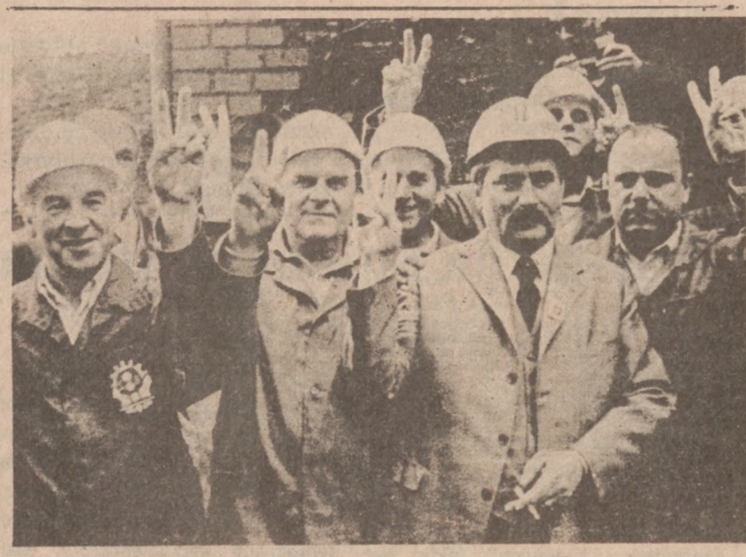
GDĄŃSK. — Lech Wałęsa w towarzystwie kolegów, po Mszy św. odprawionej w ubiegłą niedzielę w intencji laureata Pokojowej Nagrody Nobla w kościele św. Brygidy.