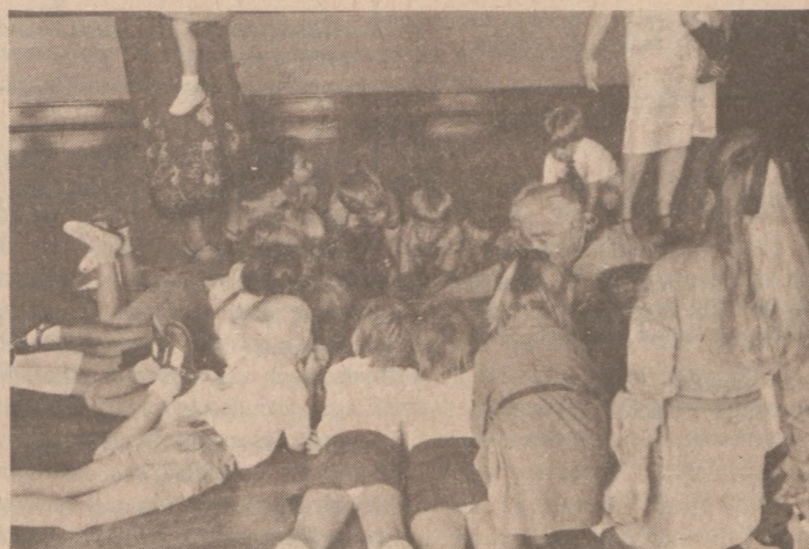
"Czytanie" mapy Polski