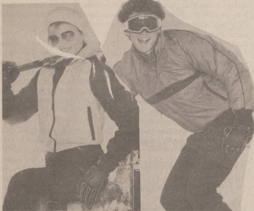
Sportowe kurtki na nadchodzący sezon zimowy.