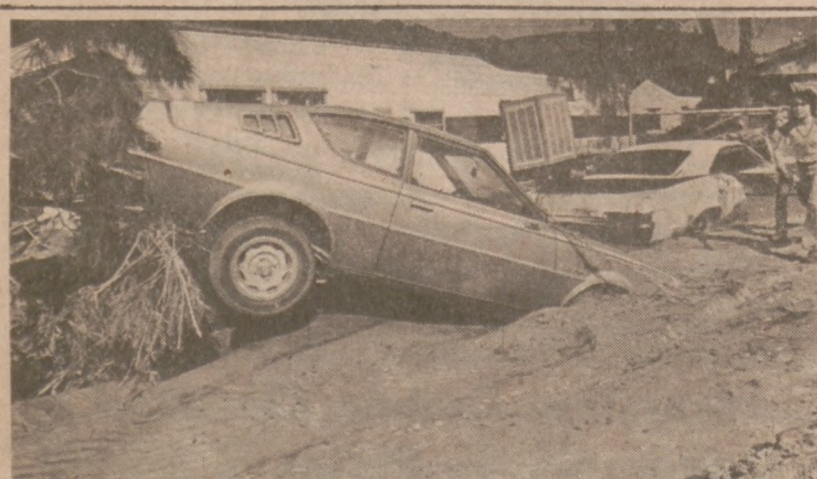
CLIFTON, ARIZONA. — "Pobojowisko" po powodzi jaka nawiedziła niektóre tereny Arizony. Prezydent Reagan ogłosił, że tereny te zostały dotknięte klęską.

Wyrok śmierci zostanie wykonany przez wstrzyknięcie Buggsowi trucizny. Obecnie, adwokat skazanego złożył apelację od wyroku, zgodnie z kodeksem prawnym.