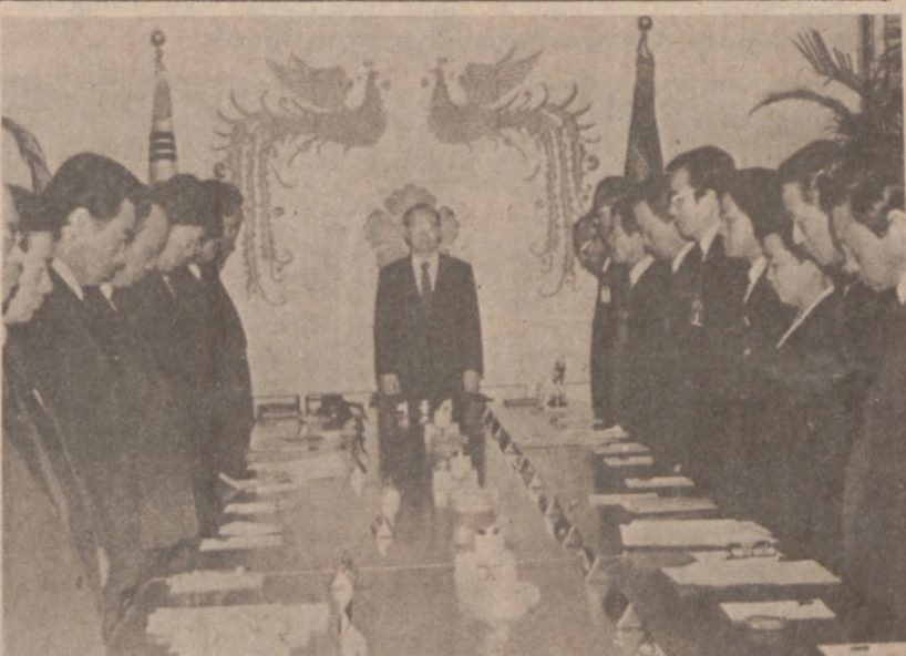
SEUL, POŁUDNIOWA KOREA. — Prezydent Płd. Korei Chun Doo-Hwan i członkowie jego gabinetu, oddali cześć pamięci tych wszystkich, którzy zginęli w wybuchu bomby podłożonej przy mauzoleum w stolicy Birmy Rangun.

Moskwa (NYT) — Radio Moskwa w programie prowadzonym w języku angielskim oświadczyło, że Czan Duan może obecnie wykorzystywać zamach w Birnie, w którym zginęło 16 przedstawicieli władz południowokoreańskich do “zwiększenia represji oraz eskalacji napięcia w tym rejonie”.