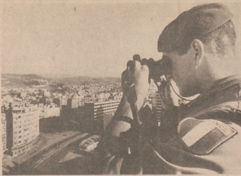
BEJRUT. — Francuski żołnierz obserwuje miasto.