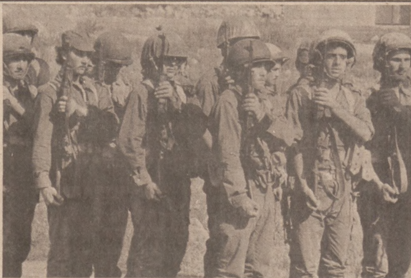
ANSAR, LIBAN. — Członkowie oddziałów szczytów w pełnym uzbrojeniu.