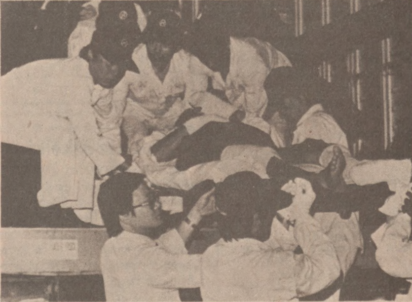
SEUL, POŁUDNIOWA KOREA. — Do Południowej Korei przywieziono 11 osób, które zostały rannne w wybuchu bomby podłożonej pod mauzoleum w stolicy Birmy Rangunie.