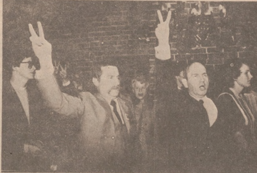
GDANSK. — Jeszcze jedno zdjęcie z Mszy św. odprowionej 9 października w kościele św. Brygidy w intencji Lecha Wałęsy. Na zdjęciu moment w którym wierni (z Lechem) śpiewają "Boże Coś Polskę".

Jeżeli dana osoba wywiąże się z zadania bez powtórzonego naruszenia prawa, wyrok ten nie będzie wpisany w akta osobiste skazanego. Program taki trwa przeważnie od 6 miesięcy do roku. Miasto musi wyrazić zgodę na skorzystanie z pracy społecznej skazanych. Biorący udział w tym programie muszą poświadczyć o 8 do 30 godzin pracy ochotniczej.