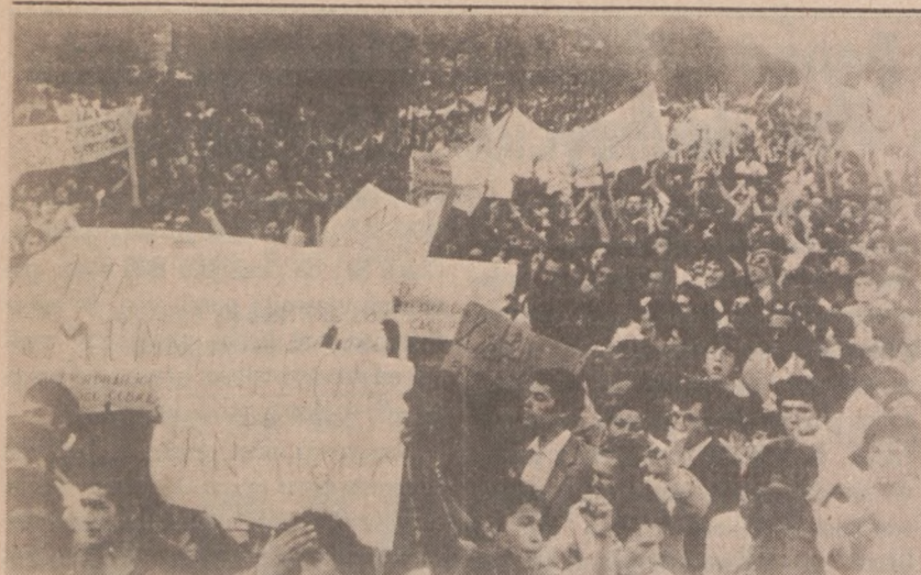
SANTIAGO, CHILE. — Tysiące górników, studentów i robotników protestowało 5 października przeciw rządowi prez. Augusto Pinochet.