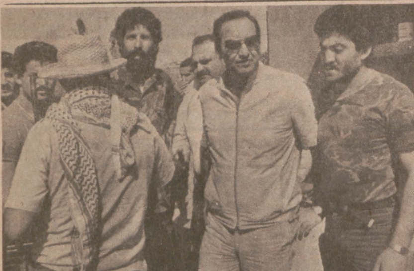
BEJRUT. — Przywódca milicji "Amal", Nabib Berri (drugi od prawej), odwiedza swe oddziały na południowych przedmieściach stolicy Libanu.