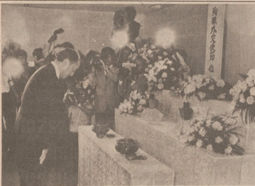
TOKIO, JAPONIA. — Premier Japonii Yasuhiro Nakasone oddaje hołd pamięci 16 Koreańczyków, którzy zginęli w Rangunie. Premier Japonii odwiedził w tym celu ambasadę Korei Południowej w Tokio.