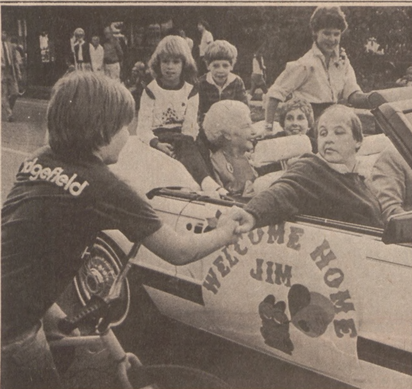
CENTRALIA, ILL. — Sekretarz prezydenta Jim Brady, serdecznie witany przez mieszkańców rodzinnego miasta, gdy odwiedził swą matkę w ubiegłą niedzielę (9 października).