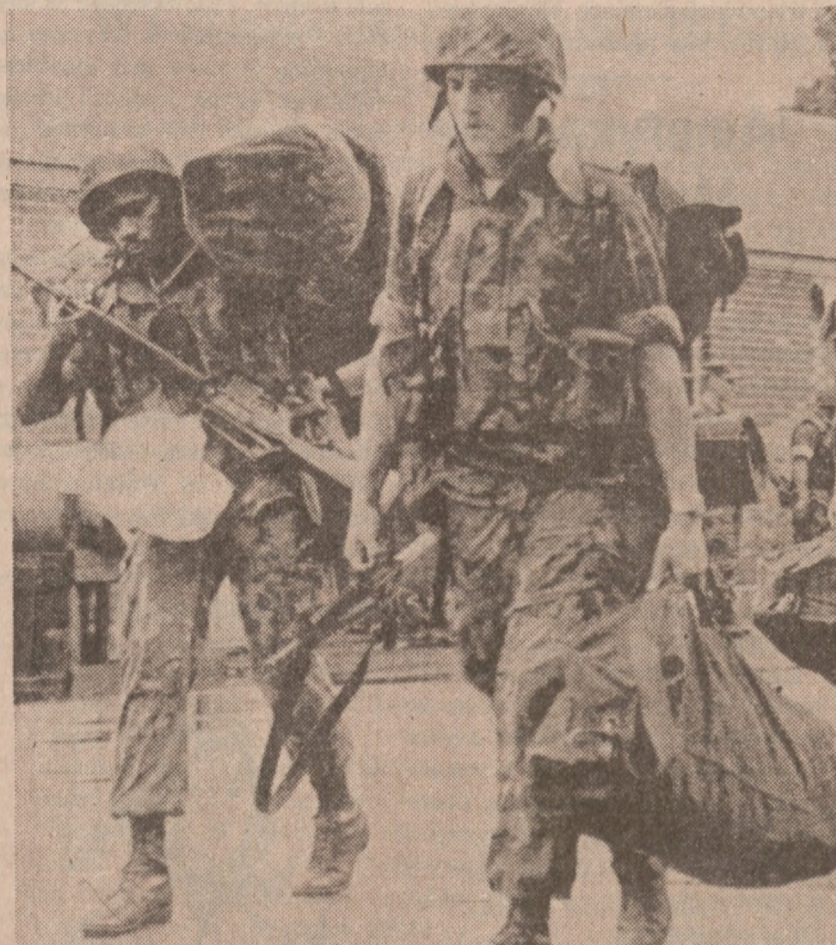
KOSZARY LEJEUNE, N.C. — Żołnierze 2 Dywizji Strzelców Morskich w drodze do samolotu, który zawiezie ich do Libanu.

Cena złota w Londynie wzrosła do $396.75 za uncję.