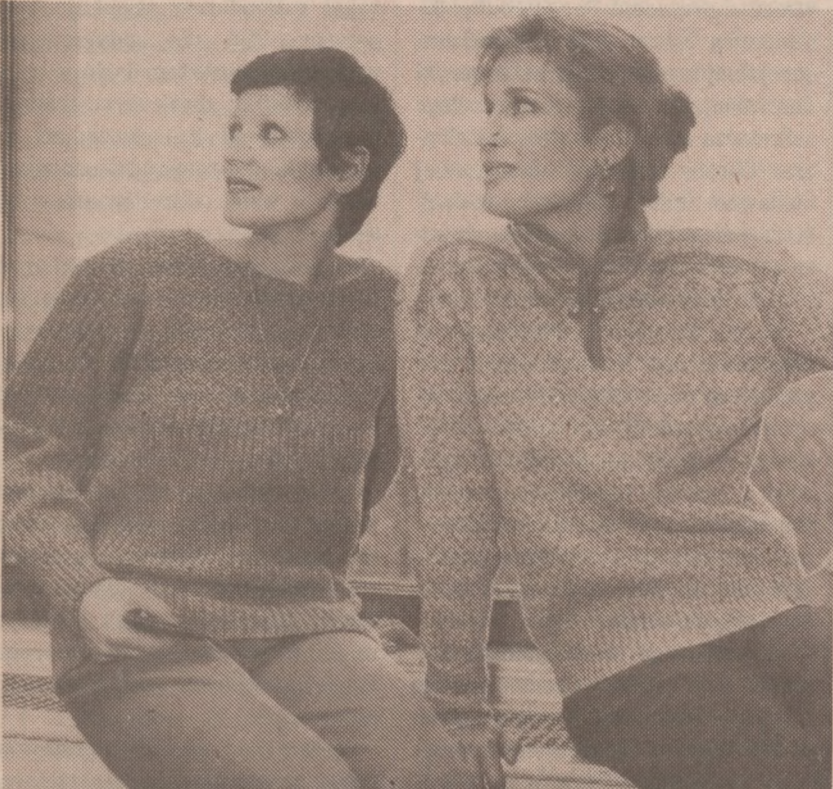
Luźne swetry sportowe na zimę. Przypominamy, że tego roku obowiązują swetry obszerne, sprawiające wrażenie dużych.