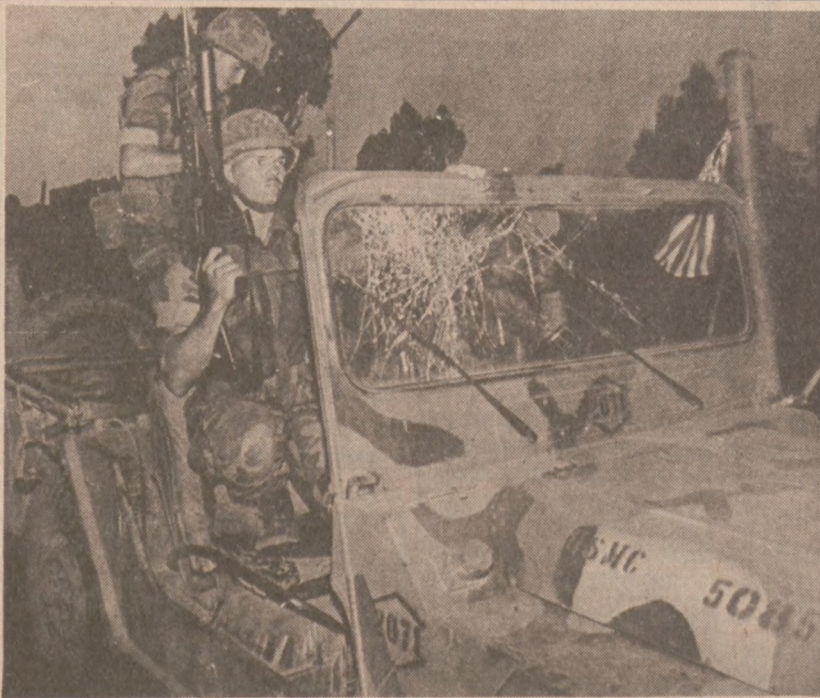
BEJRUT.—Amerykański "marines" w pogotowiu bojowym zaraz po tym, jak nastąpił wybuch bomby podłożonej w mieście przez które przejeżdżał konwój wojskowy U.S. 19 października br.

Potrzebna jest też nowa autostrada wzdłuż jeziora, lecz jak twierdzi Wood nie są tu trudności nie do pokonania. "Gwarantuję wam, że za rok, dwa, zobaczycie szalone zmiany nad tym brzegiem jeziora — powiedział Wood.