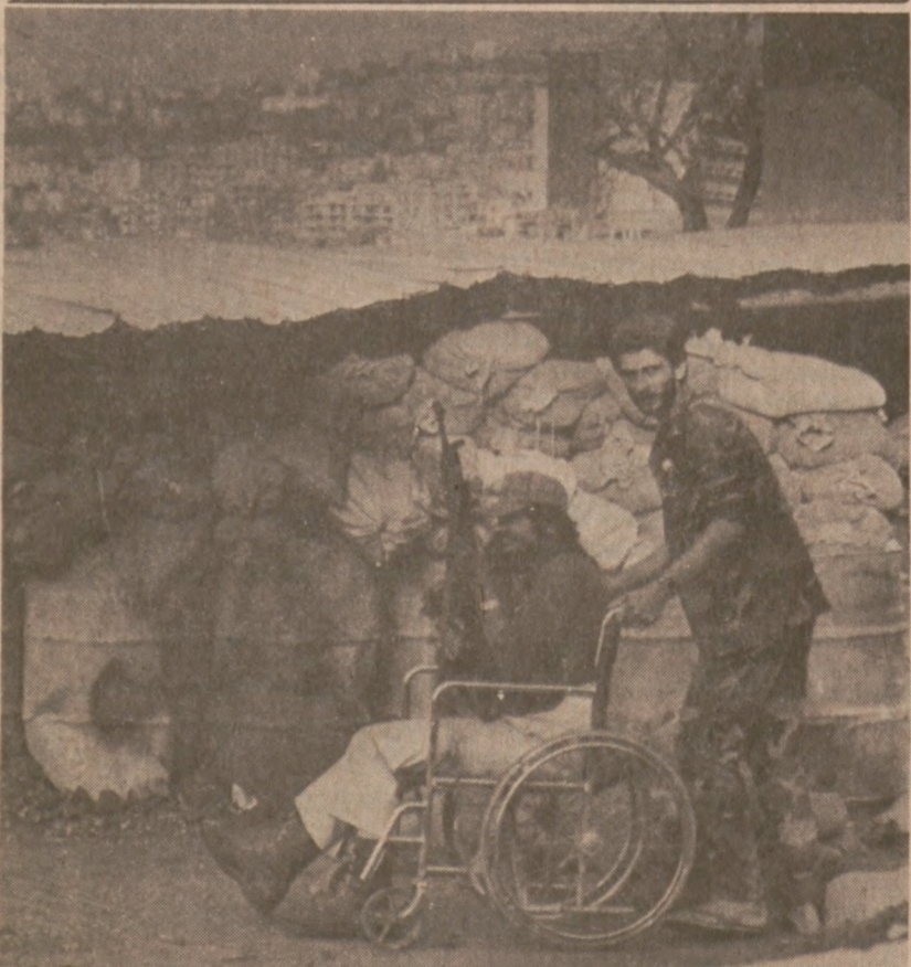
BEJRUT.—Uzbrojony członek oddziałów szczytów popycha wózek inwalidzki z własnym kolegą, trzymającym w ręku karabin maszynowy. Młody szycia ma na sobie mundur polowy bardzo podobny do tego, jaki noszą amerykańscy "marines."