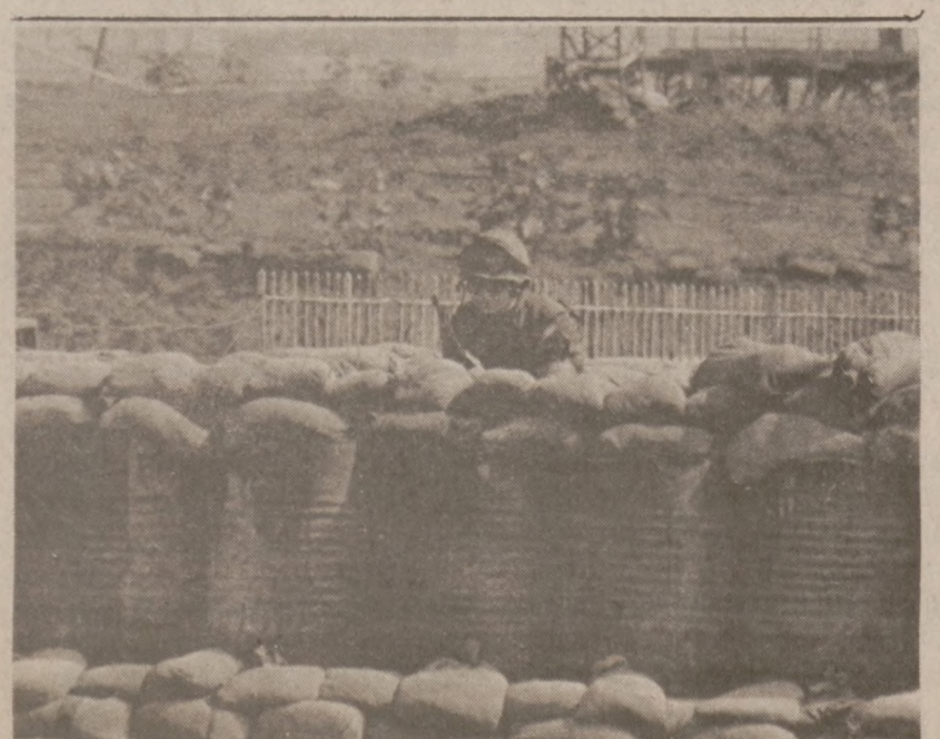
BEJRUT.—Na straży przed kwaterą amerykańskich "marines" niedaleko Bejrutu.

W sobotnim ciągnięciu, w grze: "LOTTO" loterii stanowej, wyciągnięto następujące numery: 24, 25, 30, 31, 35, 36. Zastępczy: 38. W tym tygodniu wygrana wynosi $6,000,000.