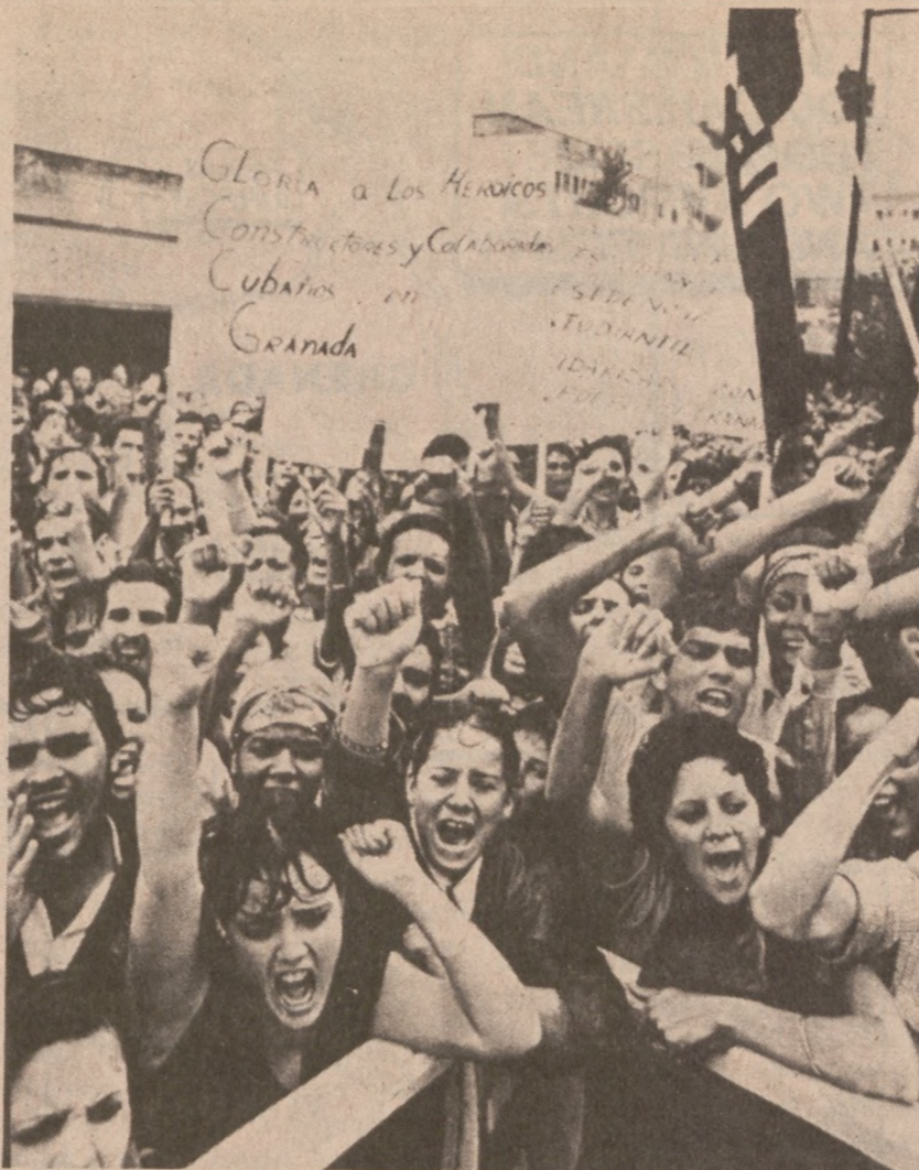
HAWANA, KUBA. — Kubańscy demonstrują przeciw Stanom Zjednoczonym w związku z akcją militarną w Grenadzie.

Zonie, synowi i córce, oraz trojgu wnucząt, głębokie wyrazy współczucia.