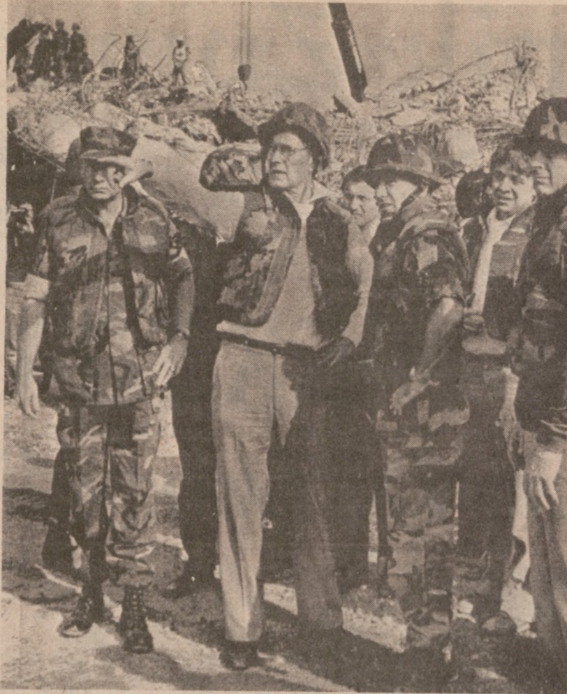
BEJRUT, LIBAN.—26 października przybył tu wiceprezydent U.S. George Bush, aby osobiście zobaczyć ogromniszczeń oraz, pocieszyć żołnierzy amerykańskich stacjonujących w Bejrucie.

Wyprawa amerykańska postanowiła powrócić w Himalaje, celem zdobycia Mt. Everestu w r. 1987.