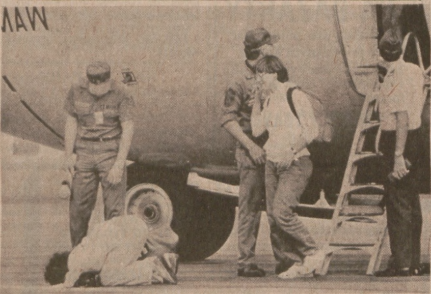
CHARLESTON, S.C. — Jedna ze studentek medycyny, po wyjściu z samolotu wojskowego, którym przyleciała wraz z kolegami i koleżankami z Grenady, całuje na powitanie ziemię amerykańską, wdzięczna za uwolnienie.