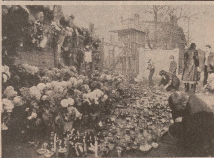
KATOWICE. — Niedaleko głównej bramy kopalni "Wujek", gdzie w grudniu 1981 r. polegli górnicy. W święto Wszystkich Świętych pamiętamy o wszystkich zmarłych, szczególnie tych, którzy oddali życie za Ojczyznę. Zdjęcie zrobione rok temu, na Wszystkich Świętych.

Gęsta mgła zaległa wiele stanów, powodując zahamowania w komunikacji lotniczej. W tym samym czasie w północnym rejonie Wielkiej Równiny Prerii oraz na północy Gór Skalistych, panują wyjątkowo jak na tę porę roku wysokie temperatury. Termometr wskazywał tu ponad 70 stopni.