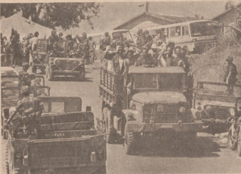
POINT SALINES, GRENADA. — Jeńcy kubańscy transportowani są do nowo wybudowanego obozu.

W przyszłą niedzielę zebrana będzie kolekta na ogrzewanie.