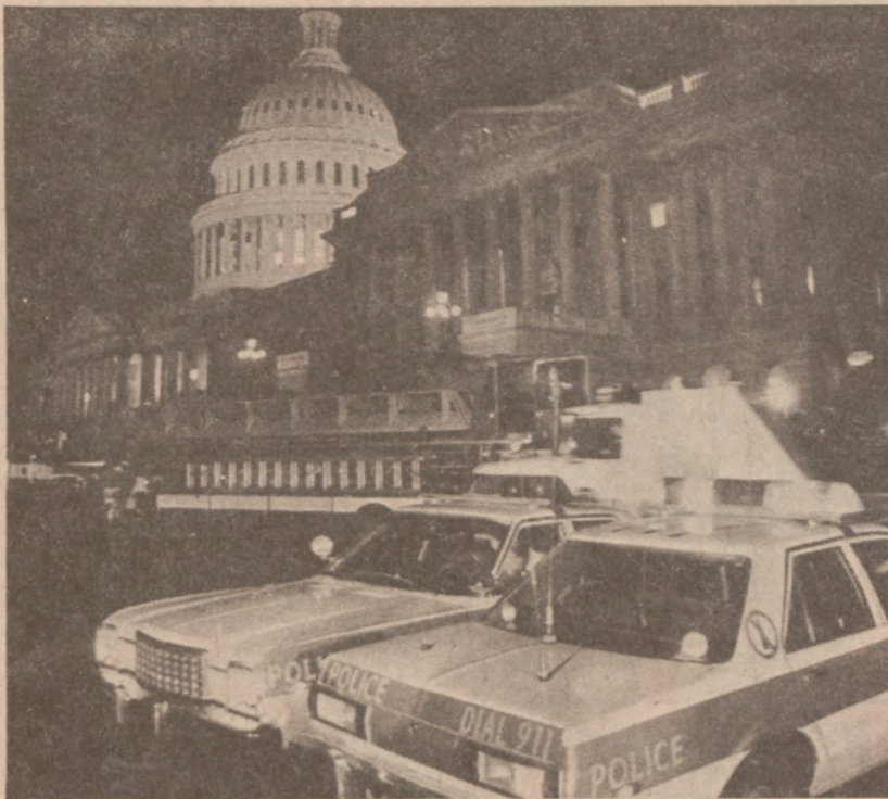
WASHINGTON.—Skrzydło Kapitolu, gdzie nastąpił wybuch bomby podłożonej przez nieznaną sprawców.

Illinois Bell zwróciła się z prośbą o udzielenie pozwolenia na tę podwyżkę do Stanowej Komisji Handlowej. W poniedziałek Komisja prowadziła specjalne przesłuchania w tej sprawie na które stawili się przedstawiciele emerytów. Stwierdzili oni, że podwyżki opłat zmuszą wielu do odłączenia telefonu. Brak jakiegokolwiek połączenia ze światem, poza ich domami, może często być bardzo niebezpieczne.