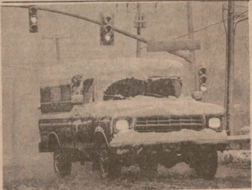
CASPER, WYO.—Pierwszy śnieg zaskoczył mieszkańców tego stanu, tym bardziej, że spadło tu 8 listopada 11 cali "puszystej pierzynki".

W najbliższą sobotę zostanie ponownie zamknięty zwozomy most przy Columbus Drive. "Nie ma powodu do niepokoju" — tak przynajmniej twierdzą odciości miasta. Obecne zamknięcie mostu potrwa około 8 godzin i ma w celu dostrojenia mechanizmu podnoszącego most. Most, który zbudowano kosztem $33 mln. otworzono po raz pierwszy 31 października 1982