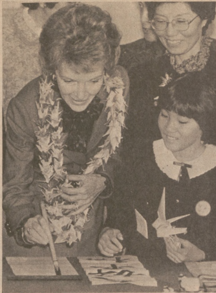
TOKIO. — W czasie swej wizyty w Japonii Nancy Reagan odwiedziła lokalną szkołę podstawową. Na zdjęciu pani Prezydentowa próbuje pisać pędzelkiem.