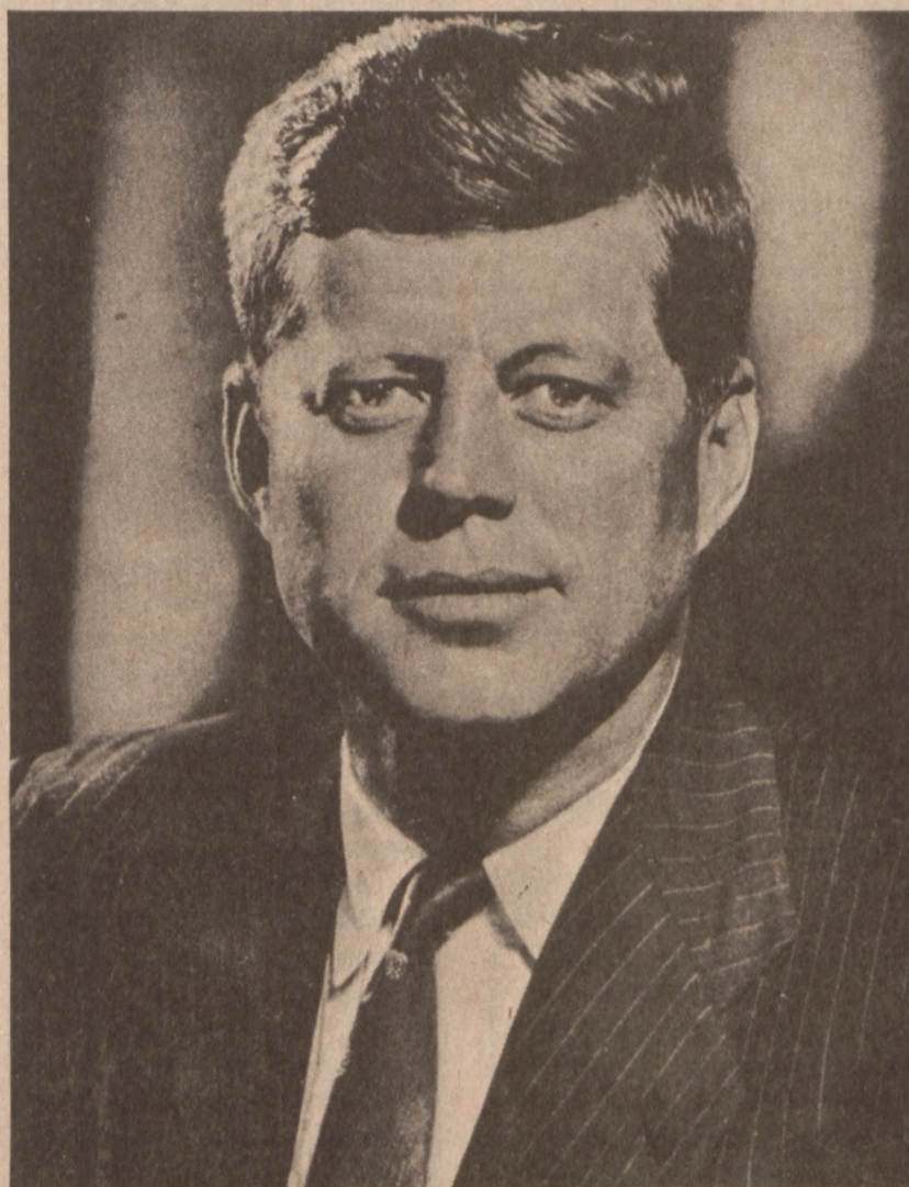
Prez. John F. Kennedy zginął od kul zamachowca 22 listopada 1963 r. w Dallas, Tex.