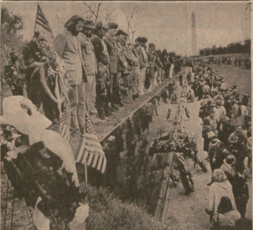
WASHINGTON. — Ceremonie z okazji Dnia Weterana przy pomniku wzniesionym dla upamiętnienia żołnierzy poległych w Wietnamie.

Pracę organów śledczych, takich jak FBI czy też policji stanowej utrudnia fakt, że większość ekwipunku nie posiada znaków identyfikacyjnych. Dopiero od niedawna w związku z wzrastającą ilością kradzieży, firmy produkujące sprzęt ciężki, wśród nich Caterpillar Tractor Co. w Peoria, postanowiły rozpocząć umieszczanie znaków identyfikacyjnych na swoim sprzęcie.