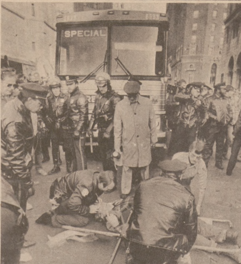
BOSTON. — Pracownik budowlany został potrącony przez autobus linii Greyhound, wyjeżdżający z dworca autobusowego. Kierowcy tej linii strajkowali. Wypadek wydarzył się 18 listopada br.