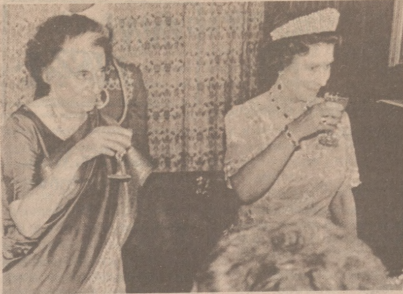
NEW DELHI. — Premier Indii Indira Gandhi i królowa Wielkiej Brytanii Elżbieta II w czasie bankietu wydanego na cześć Królowej, która przybyła tu z 10-dniową wizytą. Zdjęcie z 17 listopada.

Wypadek wydarzył się o godz. 1 rano na autostradzie Kennedy, niedaleko Montrose Ave. W wypadku tym 29 pasażerów odniosło lekkie obrażenia. Policja stwierdziła, że nawierzchnia autostrady była dość śliska na skutek padającego stale deszczu. Uznano, iż kierowca jechał za szybko na warunki, jakie panowały na zosie.