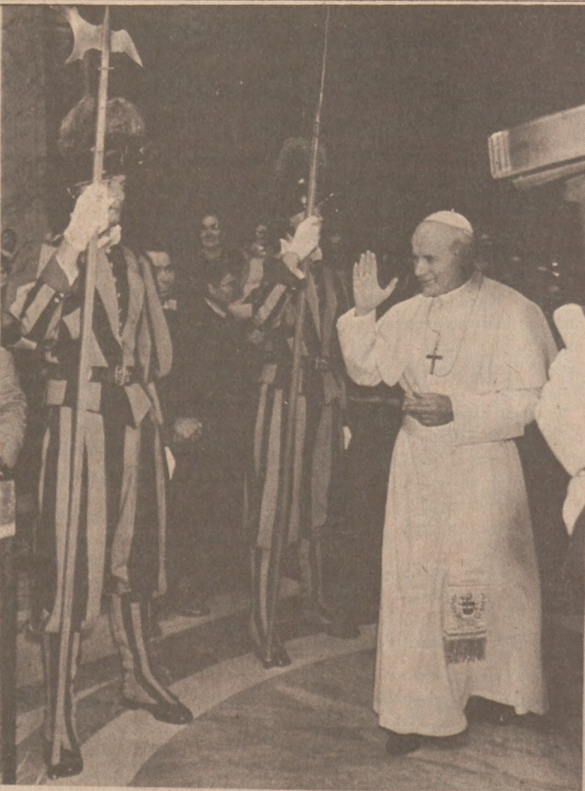
WATYKAN.— Członkowie papieskiej Szwajcarskiej Gwardii salutują Ojcu Świętemu idącemu na cotygodniową audyencję generalną na plac św. Piotra.