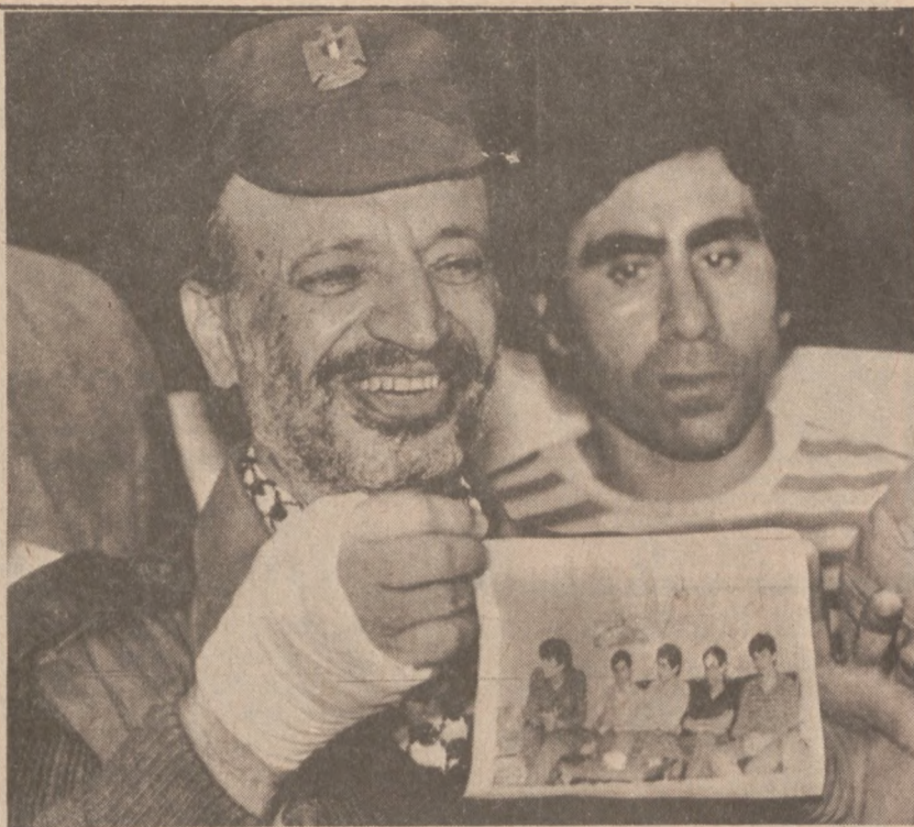
TRYPOLIS, LIBAN — Przywódca PLO Yasir Arafat ze zdjęciem żołnierzy izraelskich wziętych do niewoli. Zwolniono tych jeńców w zamian za tysiące jeńców zatrzymanych przez Izrael.