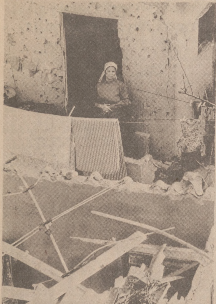
OBÓZ UCHODźCÓW W TRYPOLISIE.—Kobieta w drzwiach zrujnowanego domu.