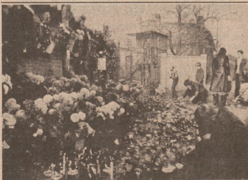
KATOWICE. — Mieszkańcy Katowic pamiętają o górnikach poległych w kopalni "Wujek" w pierwszych dniach wprowadzenia stanu wojennego. Na zdjęciu mur, niedaleko bramy do kopalni, gdzie polegli górnicy, w Wszystkich Świętych 1982 r.

W konferencji prasowej wzięli również udział szef sztabu sowieckich sił zbrojnych Nikołaj Ogarkow i wicepremier Georgi Kornienko. Obaj oskarżyli Stany Zjedn. o spowodowanie załamania się rozmów rozbrojeniowych.