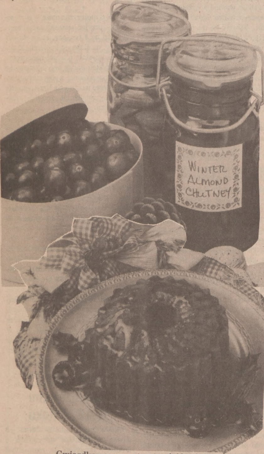
Gwiazdkowe prezenty z twojej kuchni.