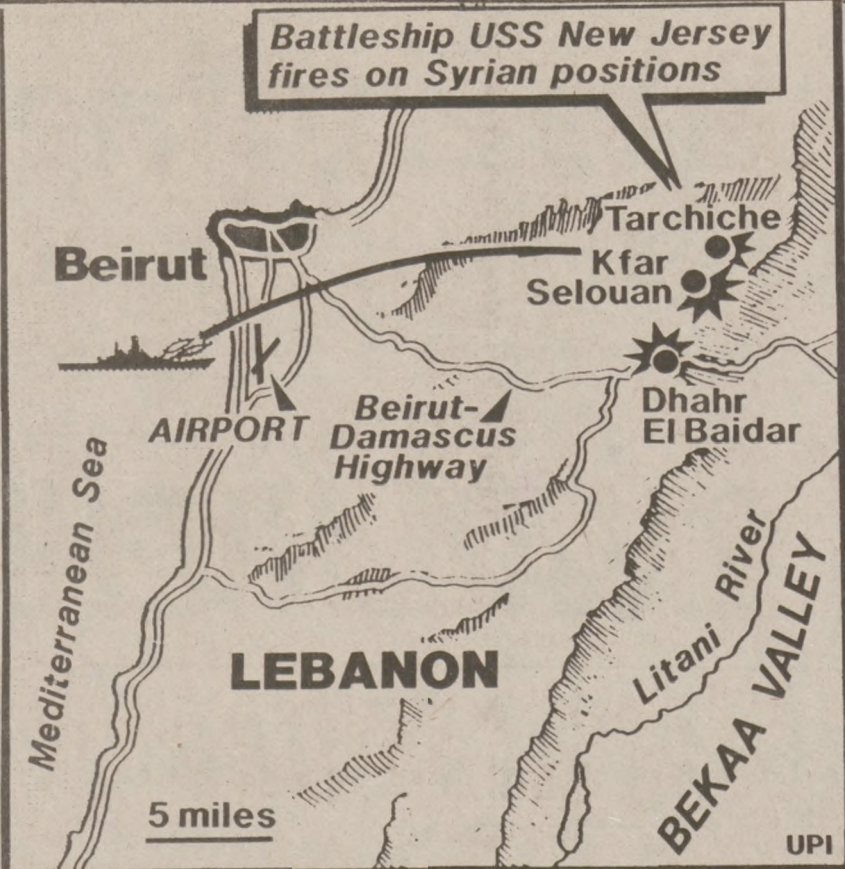
BEJRUT. — Amerykański okręt wojenny "USS New Jersey" ostrzelał pozycje z których atakowano amerykańskich "marines". Mapa ilustruje pozycje okrętu i tereny ostrzelane.