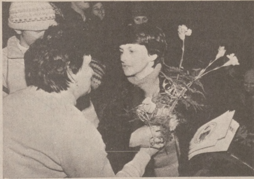
GDANSK. — Przywitanie Danuty Wałęsowej powracającej z Oslo. Zdjęcie z 14 grudnia 1983 r.