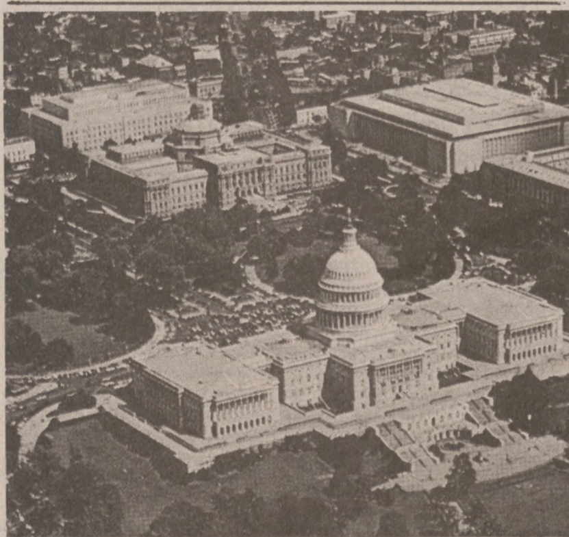
WASHINGTON. — Dzisiaj rozpoczyna obrady Kongres Stanów Zjednoczonych po dwumiesięcznej przerwie. Na zdjęciu budynek Kapitolu, siedziba Kongresu U.S.

Doszły również informacje, że przedstawiciele Dept. Rolnictwa próbują uzyskać poparcie rządowe dla programu tymczasowych robotników, w którym uczestniczyliby obokrajowcy zatrudnieni przy zbieraniu owoców. Ludzi ci, otrzymywaliby tymczasowe karty pracy. Za takim programem opowiadają się właściciele sadów i pół uprawnych. Propozycję poparł również sekr. Dept. Rolnictwa, John Block.