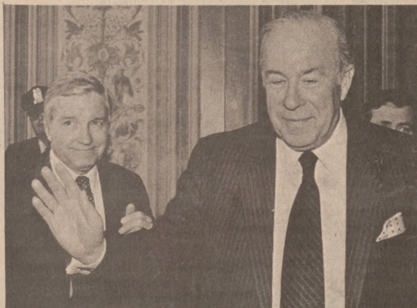
WASHINGTON. — Sekretarz stanu, George Shultz opuszcza salę obrad senackiego Komitetu Stosunków Międzynarodowych po konferencji na temat ewentualnego wycofania wojsk amerykańskich z Bejrutu. Obok przewodniczący Komitetu, senator Charles Percy (R-Ill.)