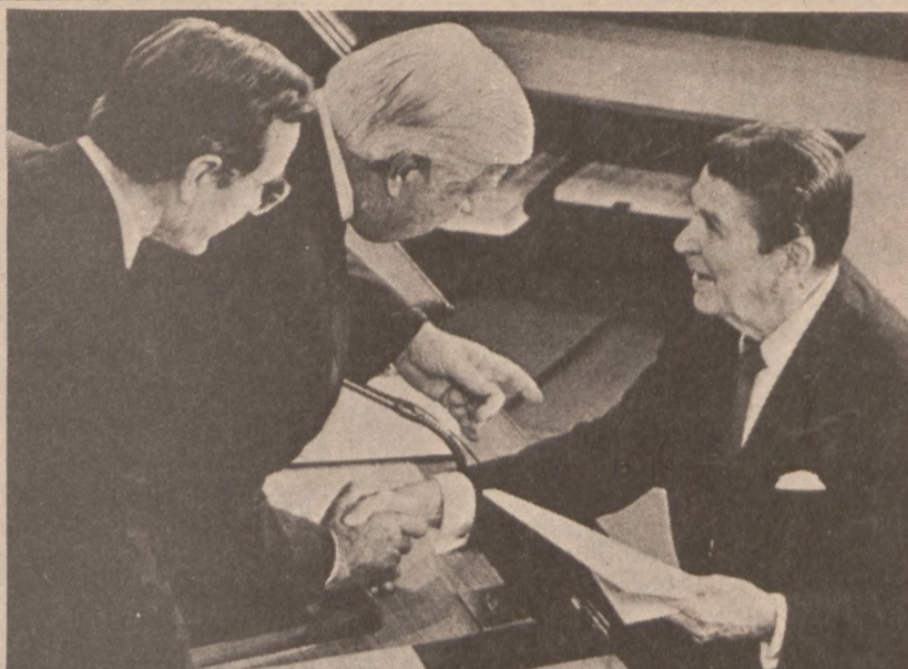
WASHINGTON. — Prezydent Reagan wymienia uścisk dłoni z Marszałkiem Izby Reprezentantów, Tipem O'Neilem przed wygłoszeniem wobec członków Kongresu przemówienia "O Stanie Unii". Z lewej wiceprezydent, George Bush.