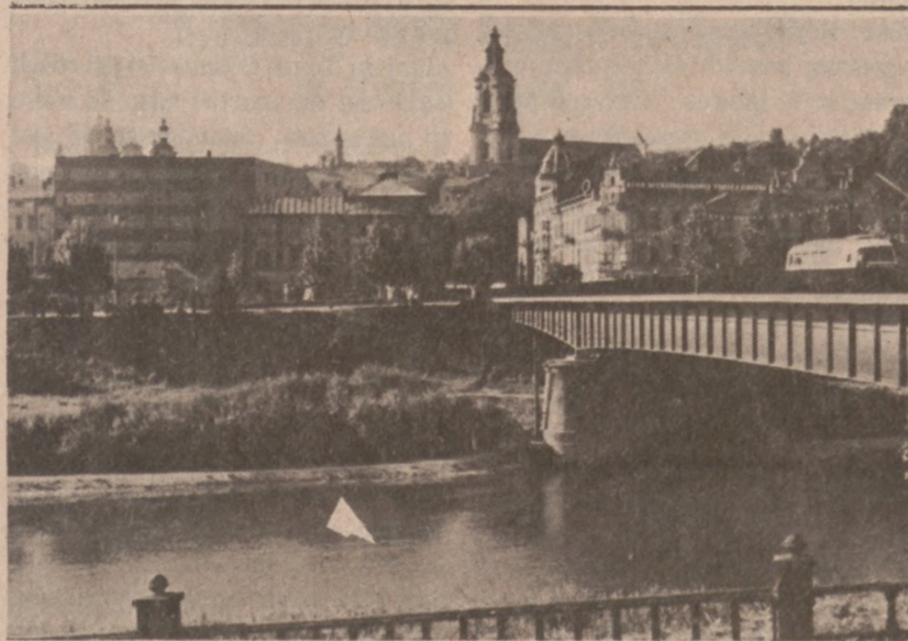
PRZEMYSŁ NAD SANEM.