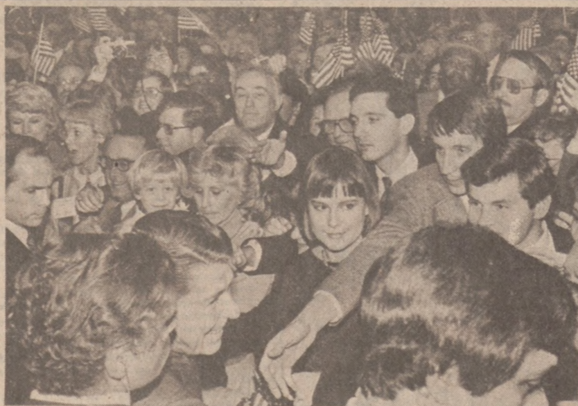
ATLANTA.—Prezydent Reagan wśród zwolenników jego administracji. Zdjęcie wykonano podczas pobytu Prezydenta w Atlancie, 26 stycznia b.r.