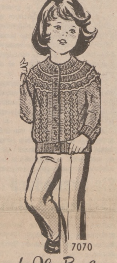
by Alice Brooks

When coats come off, she'll love going out in this pretty jacket. Synthetic mohair in a contrasting color accents the charming yoke effect. Knit cardigan of worsted for all-year wear. Note fancy cable detail. Pattern 7070. Girls' Sizes 6, 8, 10 included. $2.75 for each pattern. Add 50¢ each pattern for postage and handling. Send $4. Alice Brooks Needlecraft Dept. 263 Polish Daily Zgoda Box 163, Old Chelsea Sta., New York, NY 10113. Print Name, Address, Zip, Pattern Number.