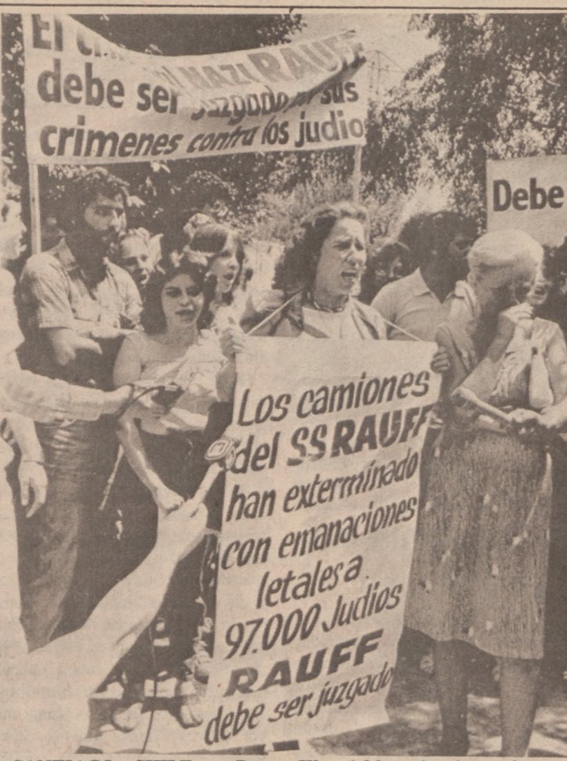
SANTIAGO, CHILE — Beate Klarsfeld, zajmująca się poszukiwaniem zbrodniarzy wojennych na czele demonstrantów, którzy żądają wydalenia z Chile Waltera Rauffa, odpowiedzialnego za uśmiercenie 97,000 Żydów.