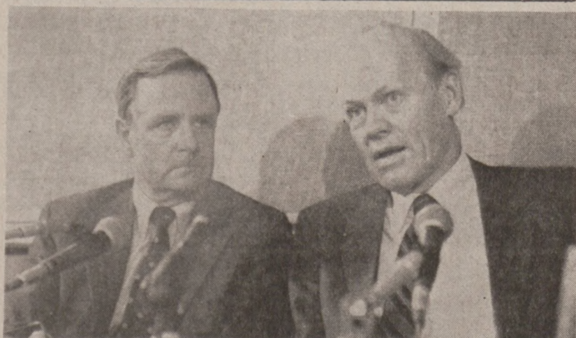
OSLO. — Minister spraw zagranicznych Norwegii Sven Stray (po prawej) w czasie konferencji prasowej na której podał do wiadomości, że Norwegia postanowiła wywalić pięciu dyplomatów sowieckich. Obok (po lewej) sekretarz stanu Norwegii Eiving Berg.

Minister Butajew skrytykował, co prawda, Aeroflot, ale nie omieszczał dodać, że mimo wszystko w 1983 roku linie spisywały się dobrze, choć Stany Zjednoczone rzuciły im kłody pod nogi, usiłując zablokować połączenia Aeroflotu na trasach międzynarodowych.