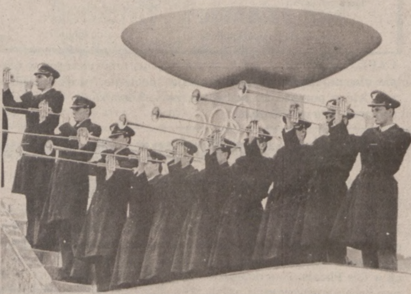
SARAJEWO, JUGOSŁAWIA.—Oddział trębaczy jugosłowiańskiego lotnictwa w czasie próby generalnej, do oficjalnych ceremonii otwierających 14 Olimpiadę Zimową. Otwarcie Olimpiady odbędzie się jutro.

Premier zapowiedział, że w najbliższym czasie powoła specjalną komisję, która zbada sprawę reformy szkolnictwa pod kątem odpowiedniego przygotowania zawodowego nauczycieli, zmiany systemu egzaminacyjnego, oraz modyfikacji nauczania przedmiotowego.