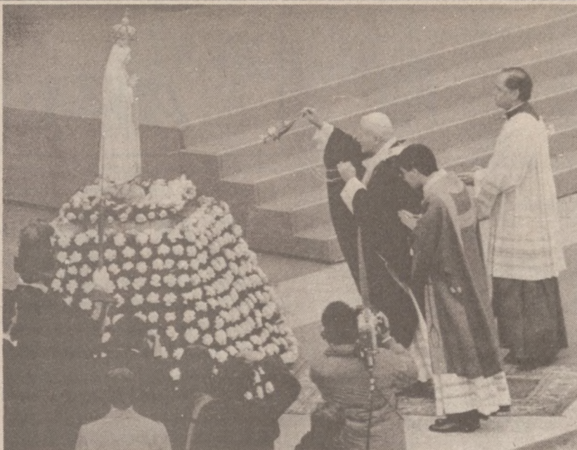
WATYKAN. — Ojciec Święty Jan Paweł II odprawił uroczystą Mszę św. w niedzielę, 25 marca, przed statua Matki Boskiej Fatimskiej.