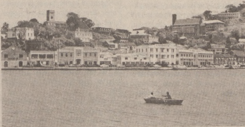
ST. GEORGE, GRENADA. — Widok miasta.

Cena złota spadła w Londynie do $387.75 za uncję.