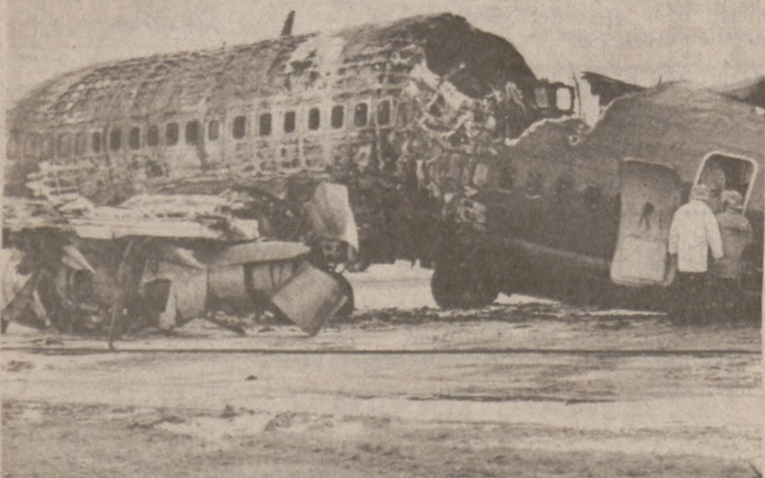
CALGARY. — Straż pożarna ogląda szczątki samolotu linii lotniczych Pacific Western Airlines 737, który miał odlecieć do Edmonton z 114 pasażerami 21 marca br. Na pokładzie wybuchł pożar.