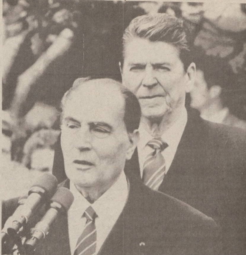
WASHINGTON. — Prezydent Francji Francois Mitterrand przemawia do witających go zebranych przy Białym Domu. Obok prezydent Ronald Reagan. Zdjęcie z 22 marca.