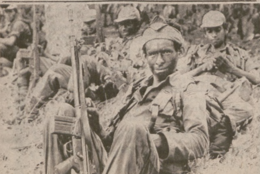
JUCUARAN, SALWADOR. — Żołnierze z batalionu Cazadores odpoczywają w czasie całodziennego marszu.

Wczoraj na terenach firmy Cozi Iron and Metal przy 2500 S. Paulina wydarzył się tragiczny wypadek, w którym zginął 25-letni Wynpalek, w którym zginął 25-letni Wynpalek. Poniósł śmierć, gdy runęła na niego sterta żelaznego złomu.