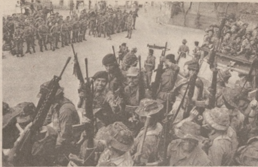
SAN FRANCISCO GOTERA, SALWADOR. — Tysiące żołnierzy salwadorskich wyruszyły w teren, aby powstrzymać rebeliantów przed zakusami wyborów, jakie się tu odbyły w niedzielę, 25 marca.

Gubernator wyrażając radość z tego, że problemy finansowe RTA zostały choćby częściowo rozwiązane podkreślił, iż od 1979 r. stara się przeprowadzić szereg ustaw mogących pomóc transportowi publicznemu. Jak dotąd ustawy te jednak nie otrzymują potrzebnego poparcia. Być może, po listopadowych wyborach będzie można nareszcie opracować właściwą formułę dla finansów transportu publicznego w naszym stanie.