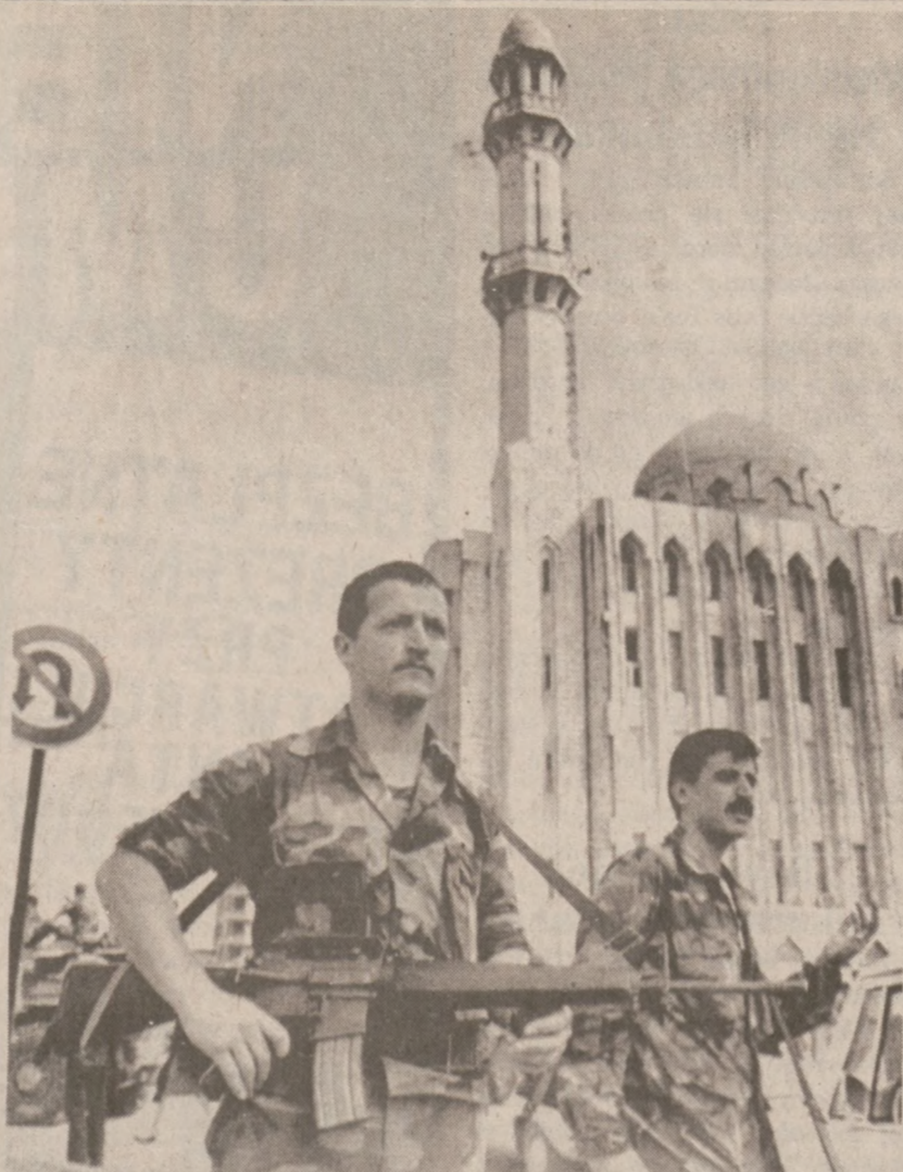
BEJRUT. — Żołnierze libańscy strzegą budynku przekazanego przez Druzów.

Głównie pasmo "wstęgi" sięga obecnie wysokości 30 stóp i szerokości 2,000 stóp. Poczynając od poniedziałku, wyciekająca lawa posunęła się jedynie o 10 stóp.