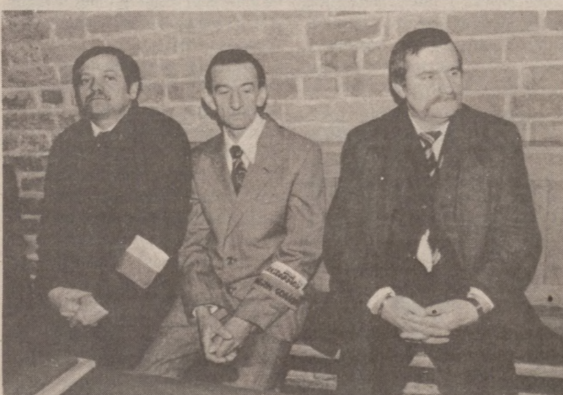
GDĄNSK. — Lech Wałęsa w czasie Mszy św. odprawionej w kościele św. Brygidy w ubiegłą niedzielę, 1 kwietnia.

(NYT) — Prezydent Sudanu Jafar Numeiry poinformował, że podczas minionego weekendu w kraju nastąpiła nieudana próba zamachu stanu. Prezydent nie udzielił w tej sprawie żadnych bliższych informacji, stwierdzając jedynie, że według jego opinii, zamach z całą pewnością przygotowały władze libijskie.