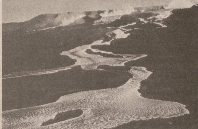
HAWAJE. — Lawa z wulkanu Mauna Loa.

W sprawie bliższych informacji należy telefonować do biura wydziału szkolenia kierowców mieszczącego się na rogu Augusta Blvd. i Paulina St., na nr 866-0575, w następujących terminach: od poniedziałku do piątku włącznie, od 3:30 do 5:30 po poł., w soboty od 8:30 do 2:30 po poł.