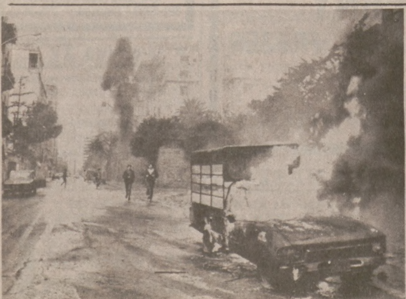
BEJRUT, LIBAN.—Wybuch pocisku w zachodniej dzielnicy Bejrutu. Ogień przenosił się na sąsiednie zabudowania, w wyniku czego kilka osób zostało rannych.