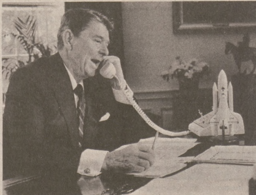
WASHINGTON.—Prezydent Reagan składa gratulacje załodze wahadłowca "Challenger" której udało się przechwycić krążącego na orbicie okołozemskiej, uszkodzonego satelitę.