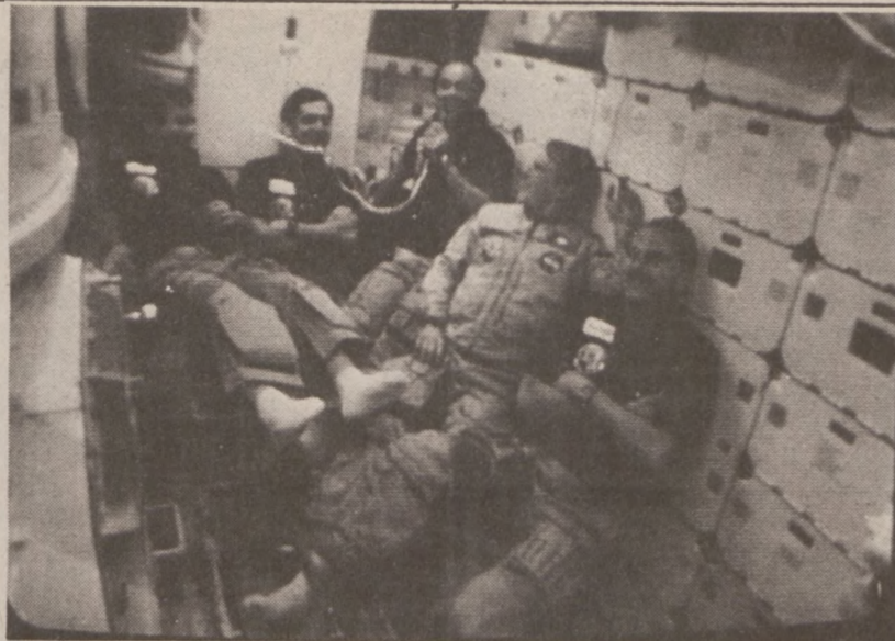
HOUSTON. —Załoga wahadłowca kosmicznego "Challenger" odbiera od prezydenta Reagana gratulacje z tytułu pomyślnego zakończenia akcji przechwytywania uszkodzonego satelity słonecznego. Akcję przeprowadzono 4 kwietnia.

Potrzebna wykwalifikowana i utalentowana sprzedawczyni do jednego z największych hurtowników/importerów w kraju. Konieczne jest doświadczenie i biegła znajomość języka angielskiego. Musi mieć reprezentacyjny wygląd i chcieć pracować w szybkim tempie. Wyższe wykształcenie pomocne. Wysokie wynagrodzenie. Pytać o Mr. Sheldon 973-7072