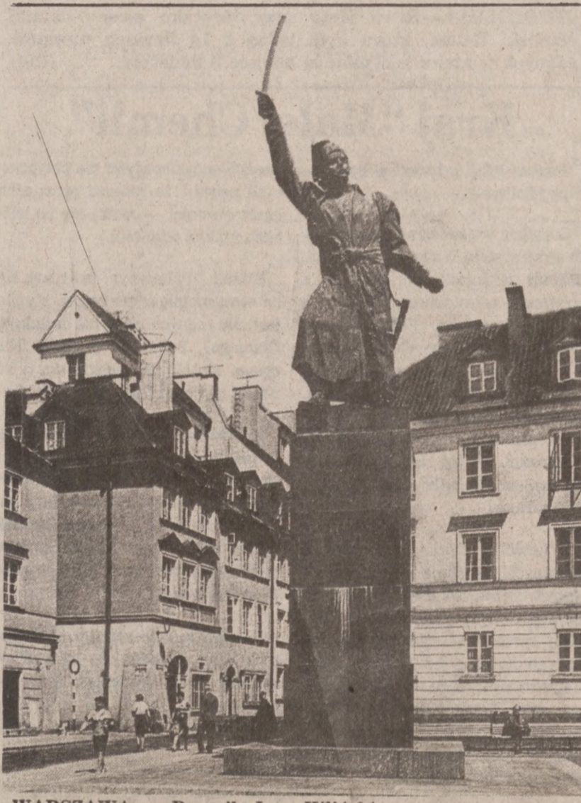
WARSZAWA. — Pomnik Jana Kilińskiego, szewca warszawskiego, który odegrał wraz z mieszczanami dużą rolę w wygnaniu Moskali ze stolicy w 1794 r. Dziś, 17 kwietnia przypada rocznica wybuchu insurekcji w Warszawie.

Cena złota utrzymała się w Londynie na wysokości $380.50 za uncję.