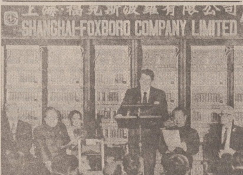
SZANGHAJ, CHINY. — Prezydent Ronald Reagan w ostatnim dniu swego pobytu w Chinach wygłosił przemówienie do pracowników jednej z firm przemysłowych zainteresowanych współpracą z firmami amerykańskimi.

Cena złota wzrosła w Londynie do $376.35 za uncję.