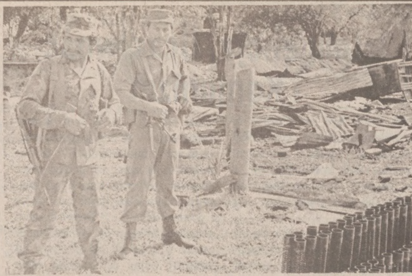
SAN JUAN del NOTRE, NIKARAGUA. — Żołnierze oddziałów "sandinistów" przy gruzach domów tego miasteczka.

Previn obejmie stanowisko dyrygenta tej orkiestry po Carlo Maria Giulini, który musi ustąpić ze względu na stan zdrowia.