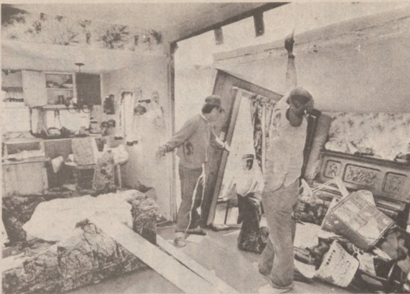
MORGAN HILL, KALIFORNIA. — Zniszczenia spowodowane stosunkowo silnym trzęsieniem ziemi, jakie nawiedziło Kalifornię 24 kwietnia br.