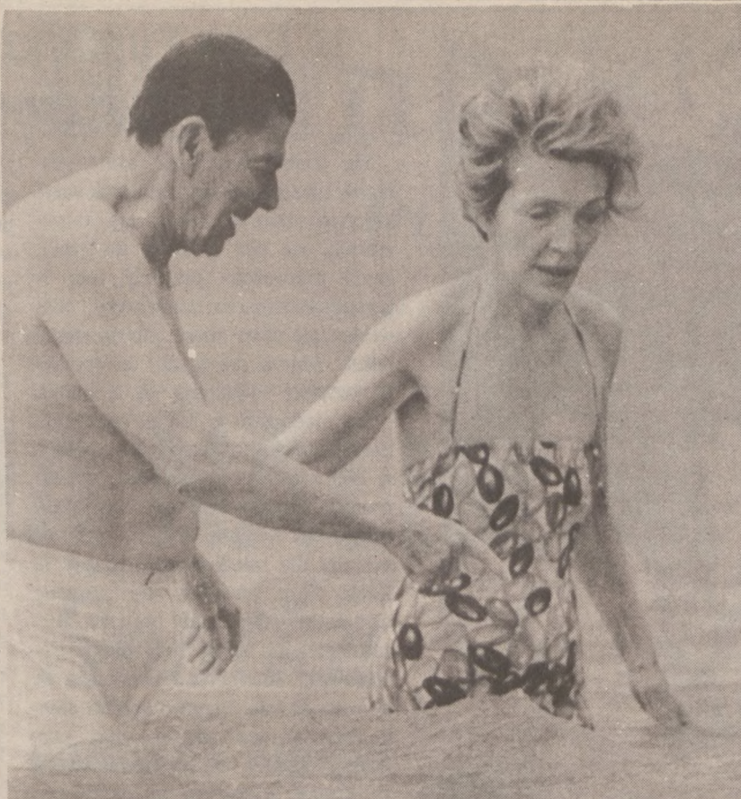
HONOLULU. — Państwo Reaganowie zażywali kąpieli przed odlotem do Chin, 23 kwietnia br.