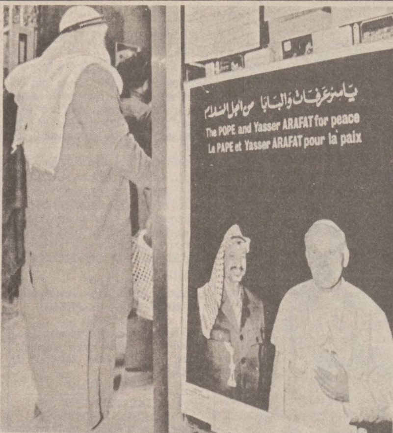
JEROZOLIMA. — Plakat ze zdjęciami Ojca Świętego Jana Pawła II i przywódcy PLO Yassera Arafata, z hasłem: "Papież i Yasser Arafat za pokojem".