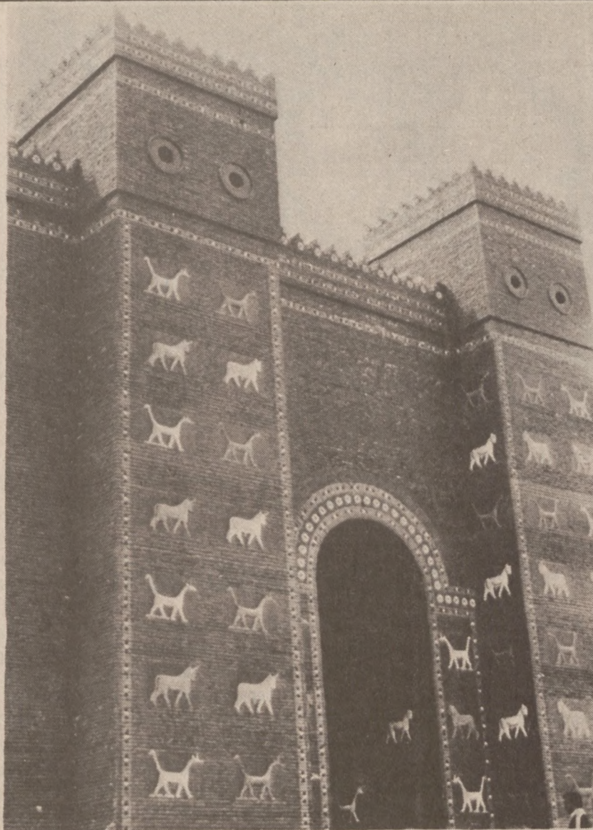
BABILON, IRAK. — Niedawno odnowiono zupełnie Bramę Ishtar — jedną z monumentalnych bram w murach Babilonu prowadzących do świątyni. Brama ozdobiona jest fryzami z glazurami koloru rdzawego i złotego. Cała brama jest koloru niebieskiego.

● KUPUJĄCE W SKŁADACH ● ● KTÓRE OGŁASZAJĄ SIĘ W ● DZIENNIKU ZWIĄZKOWYM