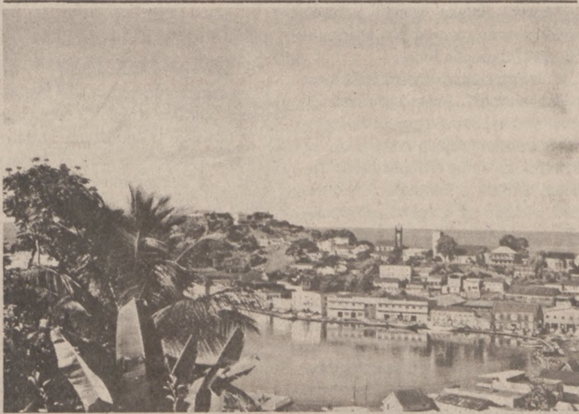
GRENADA. — Widok malowniczego miasteczka St. George.

Ciężarówki, które najechały na drobinę opisaną substancję, objęte zostały ogniem i spaliły się całkowicie. W wypadku, rzucenia "płynnego ognia" na most — pierwszy pojazd, który przejeździe przez most, spowodować może spalenie się całego mostu.