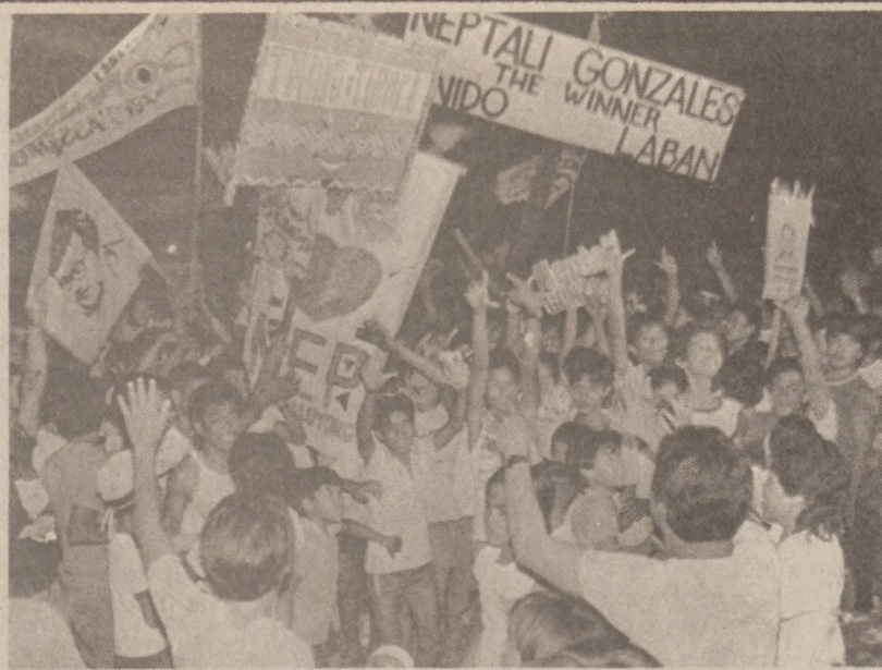
MANILA, FILIPINY. — Zwolennicy opozycji zebrałi się przed ratuszem przedmieścia Manilii, ponieważ dowiedzieli się o kradzieży urn wyborczych.

Dotychczas została wypłacona suma $80 milionów tytułem odszkodowania, rodzinom ofiar wypadku.